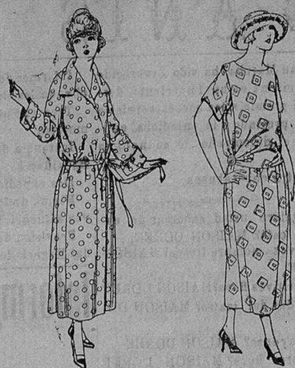
Batas de percal, voile listado, etcétera. de ptas. 16 a 28