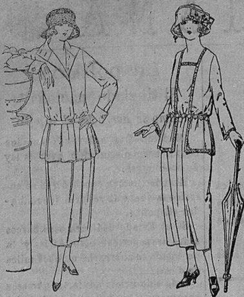
Traje sastrero de estambre gabardina, etc., chaqueta forrada de seda, en negro marino y colores moda. de ptas. 115 a 145

Sucursales: Madrid, Barcelona, Almería, Bilbao, Cádiz, Cartagena, Gijón, Granada, Málaga, Palma de Mallorca, Santander, Sevilla, Valencia, Valladolid, Zaragoza