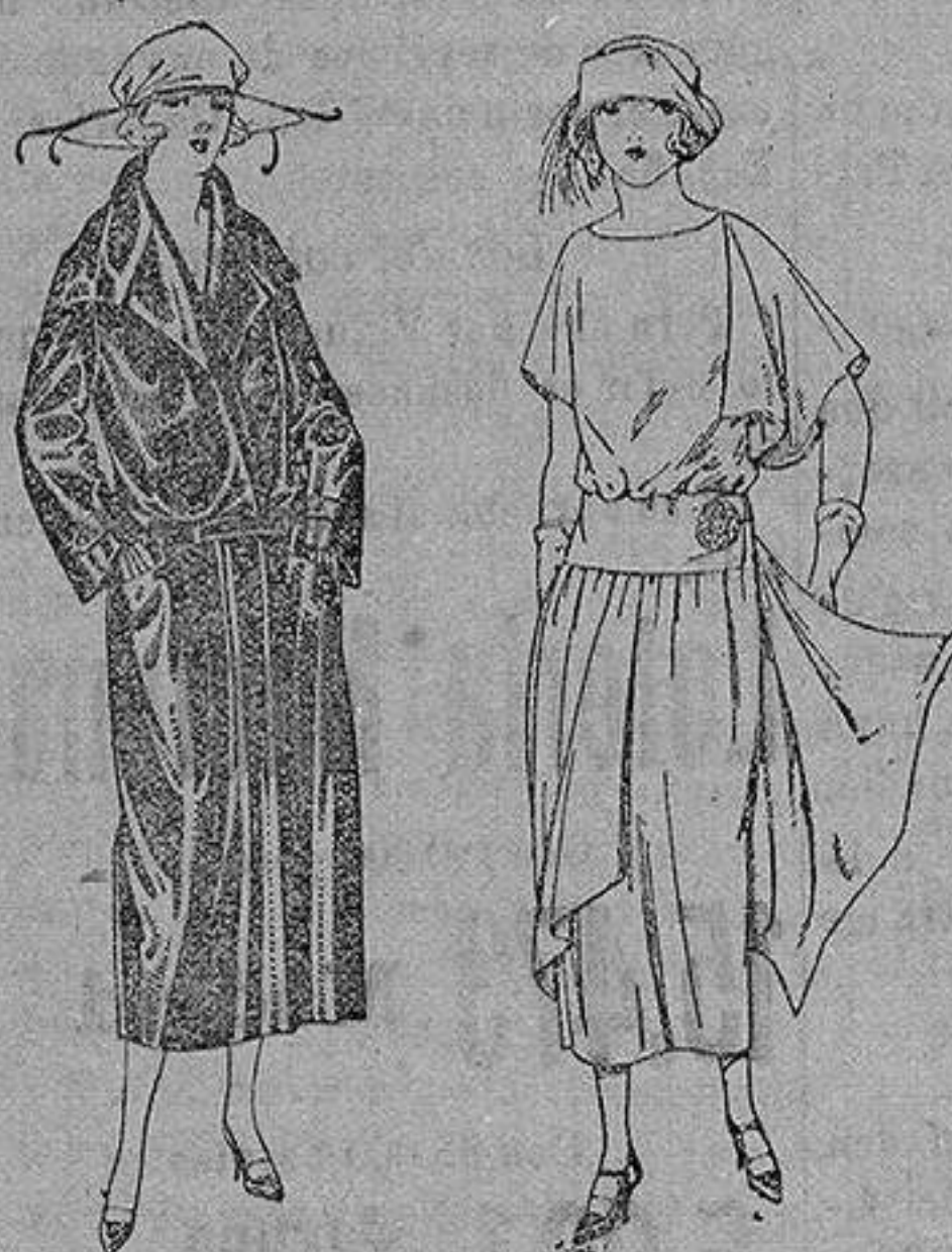
Abrigo de seda impermeables, en negro, azul y color. de ptas. 130 a 225