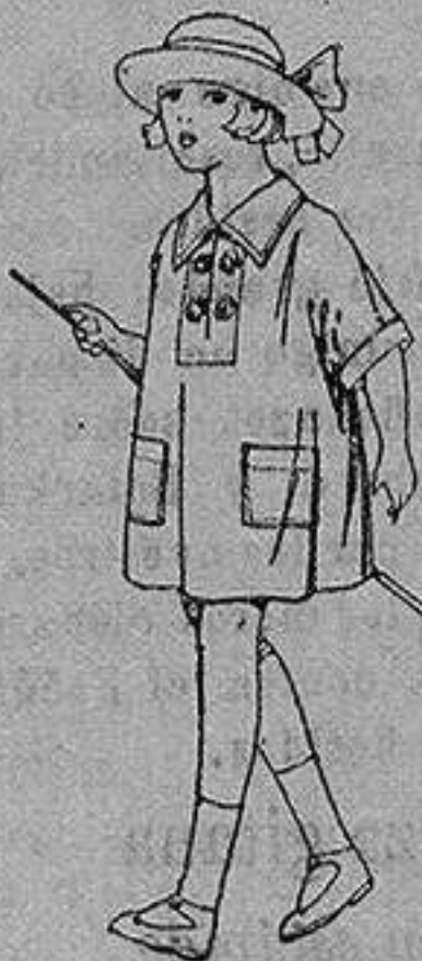
Vestidos de batista blanca, adornos bordados, para niñas de 3 a 6 años. de ptas. 6 a 8

Boas, Camisería, Géneros de punto Corbatería, Guantería, Sombrerería Zapatería, Paraguas Bastones y Artículos de Viaje