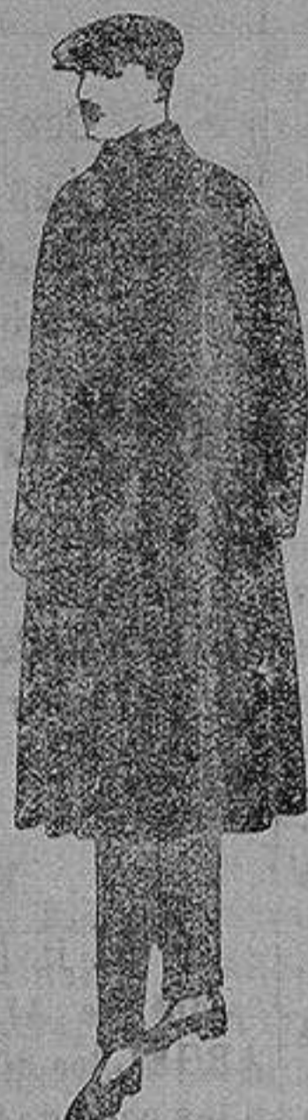
Gabanes de patén. Cheviot cover. de ptas. 55 a 160