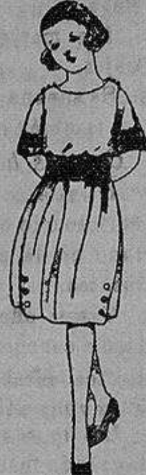
Vestidos de sarga inglesa, lanilla etc en azul y color adornos bordados para niñas de 4 a 9 años de ptas. 35 a 45.