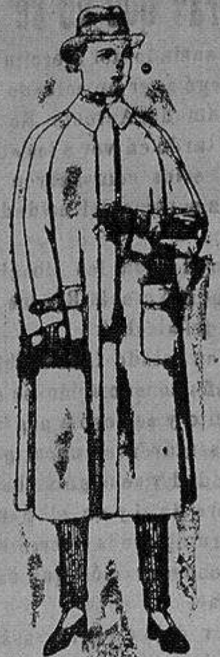
Impermeables raglán en azul y colores. de ptas 40 a 170