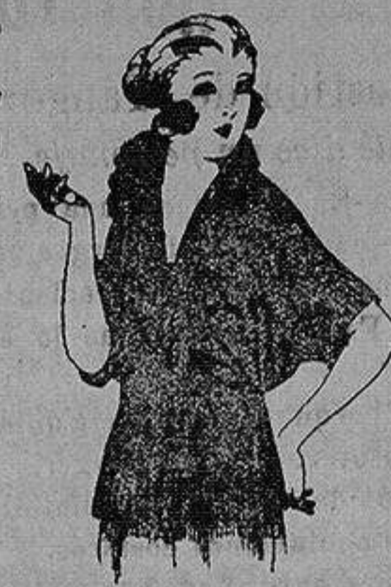
Blusas de Charmuse, gramina, etc. en negro, azul y color de ptas. 30 a 55.