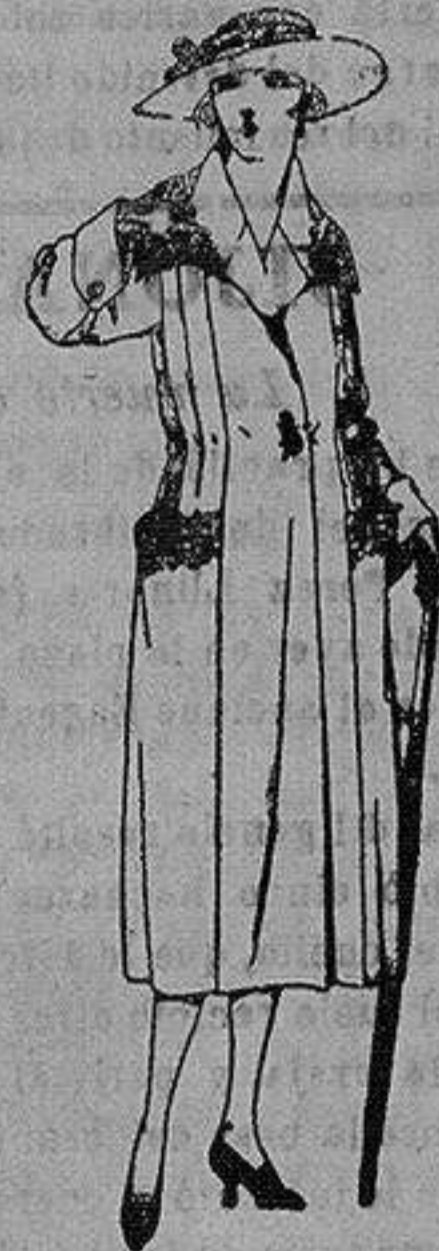
Abrigos de pañete, gamuza, etc. en azul y color, adornos bordados. de ptas. 70 a 120