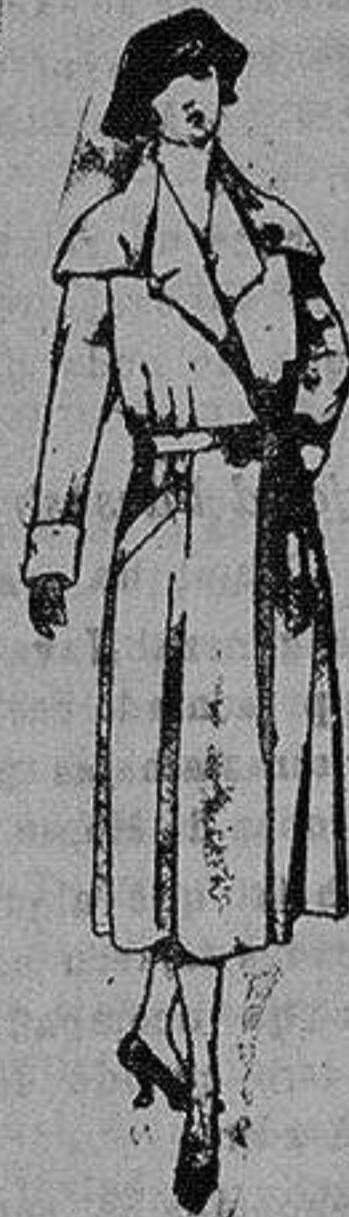
Abrigos de seda impermeables. de ptas. 130 a 225

Ropas confeccionadas para Caballero, Señora, Niño y Niña Peletería, Camisería Géneros de punto Corbatería, Guantería, Sombrerería, Zapatería, Paraguas Bastones y Artículos de Viaje