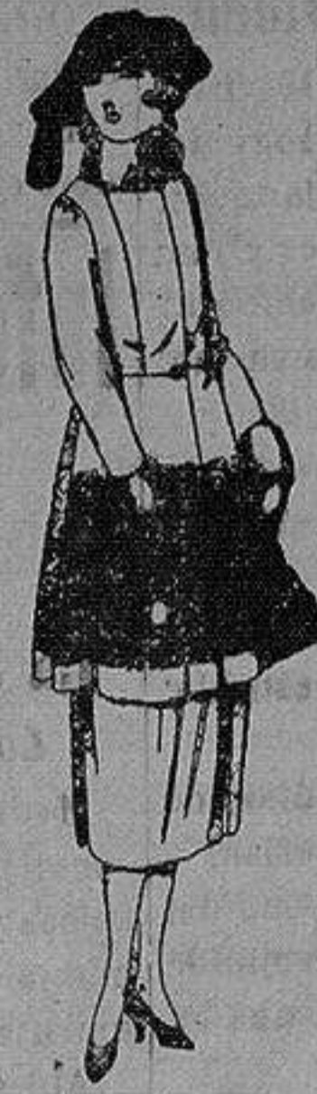
Trajes de gamuza, adornos bordados y con piel, en negro, azul y color de ptas. 180 a 230