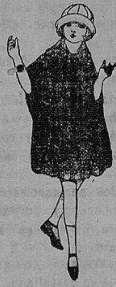
Capas de pañete, cheviot, etc. en diferentes colores y dibujos, para niñas de 4 a 9 años de ptas. 25 a 55