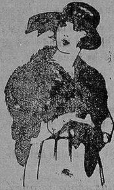
Cuello piel Renardina en blanco, marrón, gris y negro. de ptas. 18 a 40