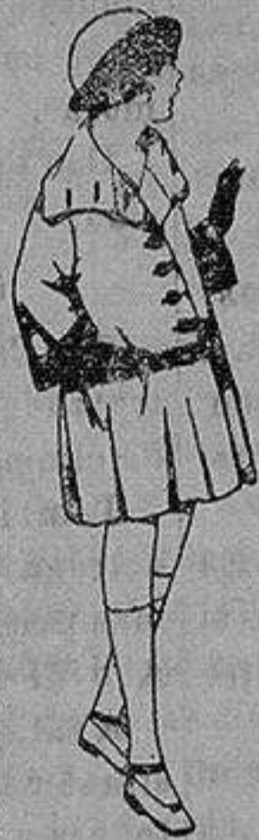
Abrigos de gamuza ratina, etc. en azul y color para niñas de 4 a 12 años. de ptas. 35 a 60