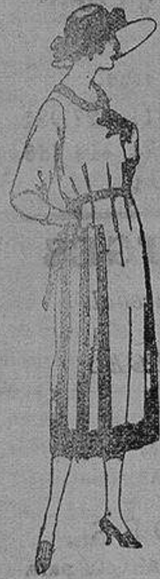
Vestido de estambre, terciopelo, gabardina, etc. en negro azul y color, adornos bordados. de ptas. 110 a 180