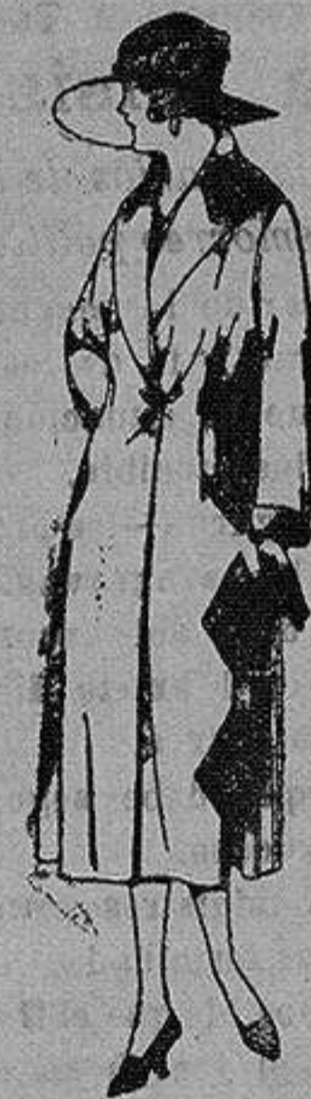
Abrigos de gamuza, ratina, etc. en negro, azul y color adornos y pespantes seda de ptas. 65 a 110

Ropas confeccionadas para Caballero, Señora, Niño y Niña Peletería, Camisería Géneros de punto Corbatería, Guantería, Sombrerería, Zapatería, Paraguas Bastones y Artículos de Viaje