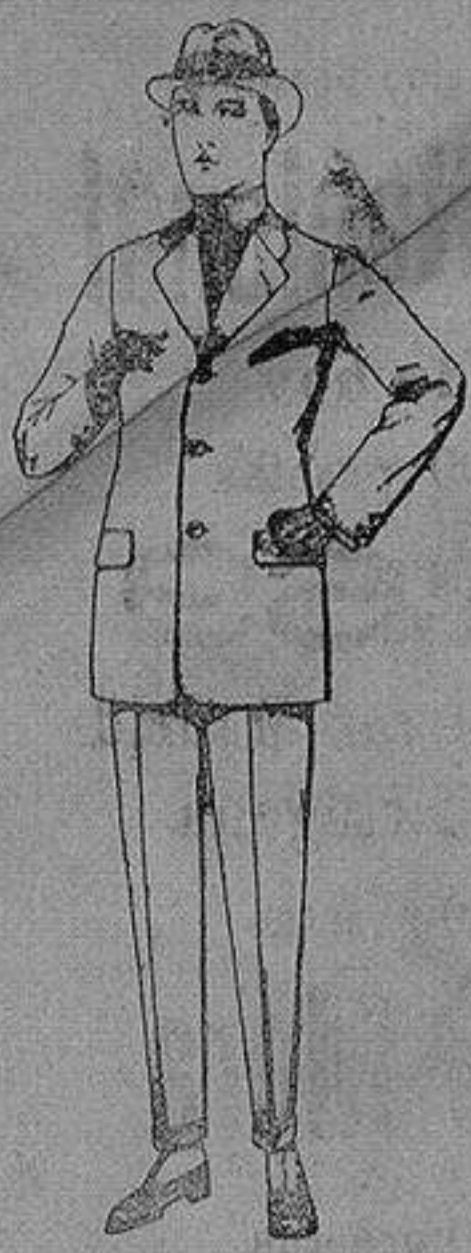
Trajes de cheviot, patén etc de ps. 88 a 185

Sucursales: Madrid, Barcelona, Almería, Bilbao, Cadiz, Cartagena, Gijón, Granada, Málaga, Palma de Mallorca, Santander, Sevilla, Valencia, Valladolid, Zaragoza