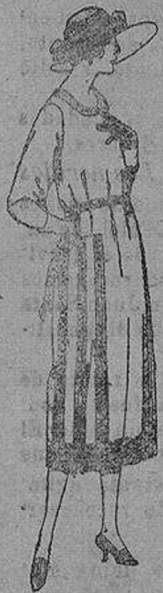
Vestido de estambre, terciopelo, gabardina, etc. en negro azul y color, adornos bordados. de ptas. 110 a 180