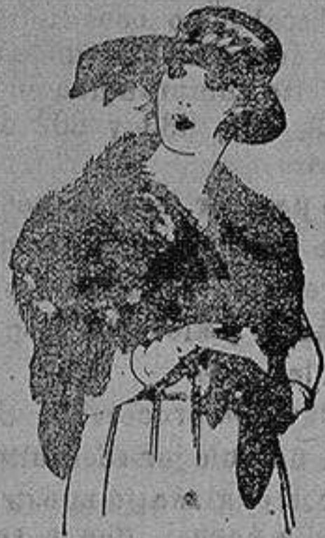
Cuella piel de ardina en blanco, marrón, gris y negro. de ptas. 15 a 40