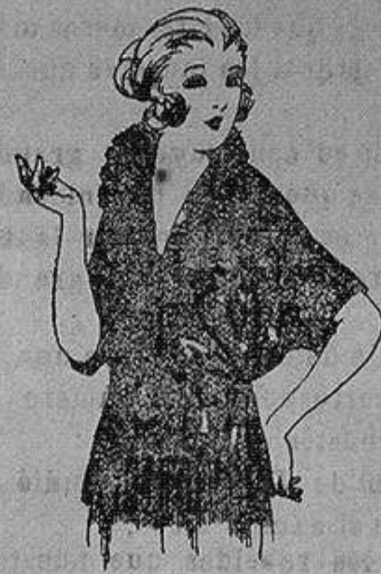
Blusas de Charmuse, grana dina, etc. en negro, azul y color de ptas. 30 a 55.