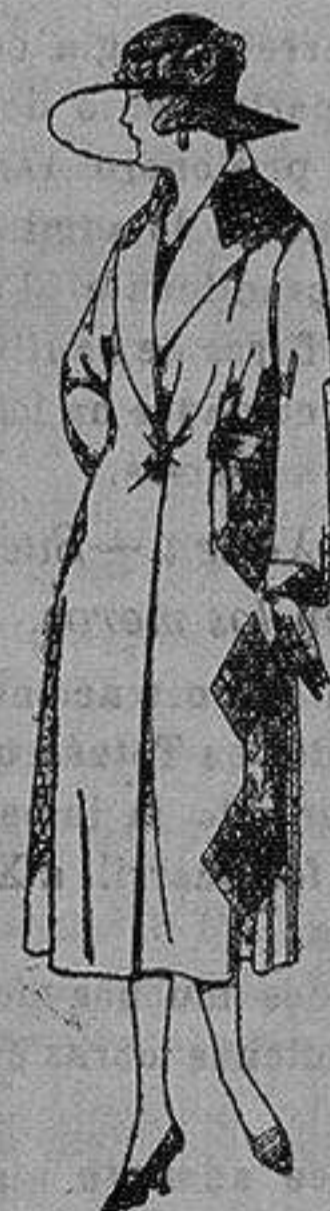
Abrigos de gamuza, ratina, etc. en negro, azul y color, adornos y pespunte seda de ptas. 65 a 110

Ropas confeccionadas para Caballero, Señora, Niño y Niña Pelotería, Camisería, Sombreros de punto, Corbatería, Guantería, Sombrerería, Zapatería, Paraguas, Bastones y Artículos de Viaje