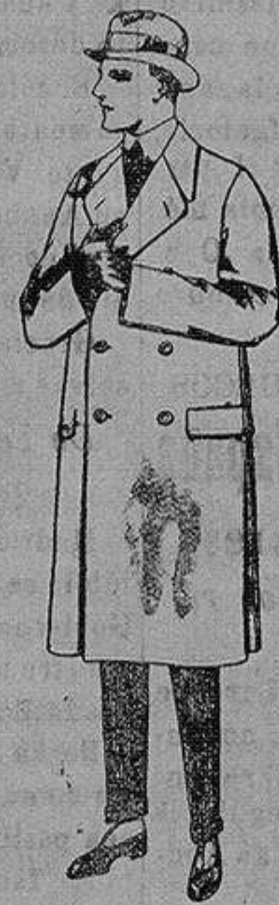
Gabanes de patén, gamuza o cower. de ptas. 60 a 200