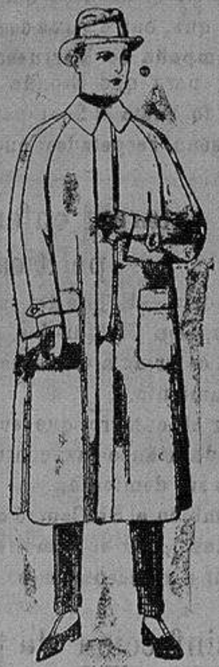
Impermeables raglán en azul y colores. de ptas 40 a 170