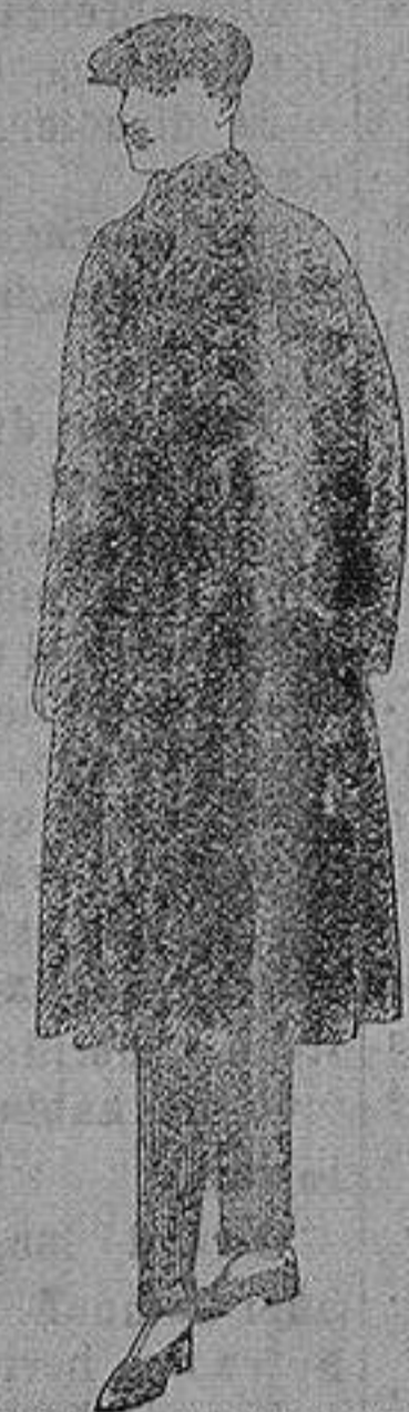
Gabanes de patén, Cheviot o cower. de ptas. 55 a 160