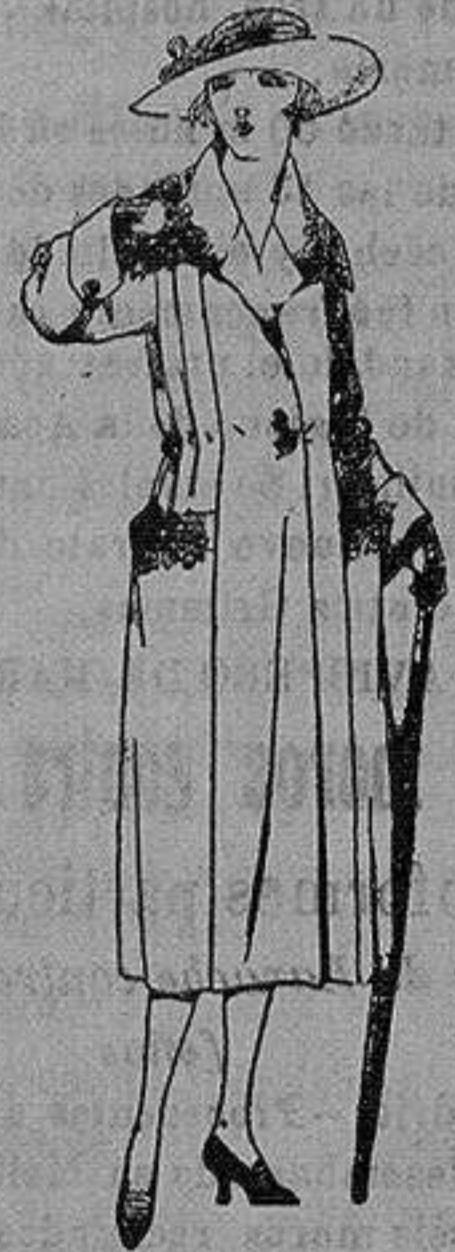
Abrigos de pañete, gamuza etc. en azul y color, adornos bordados. de ptas. 70 a 130