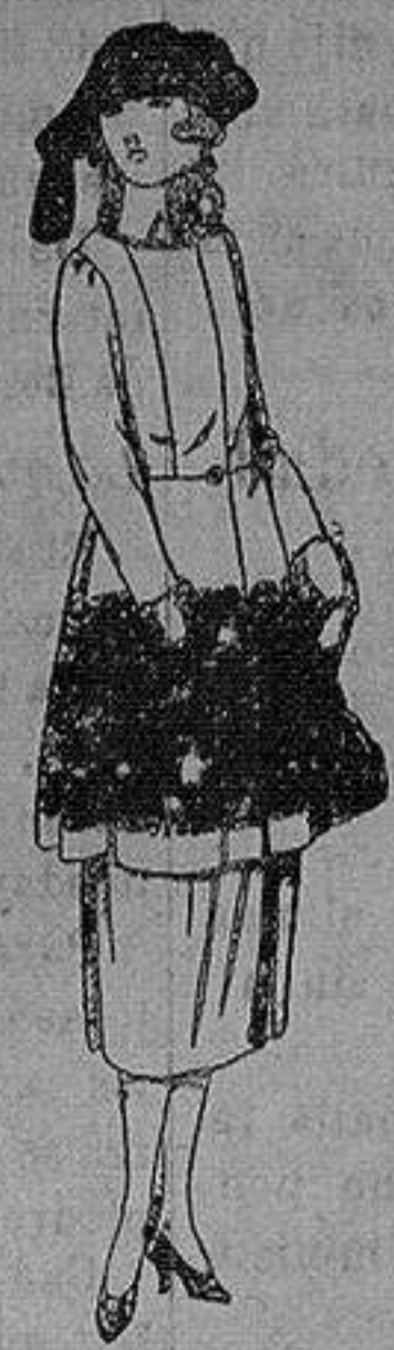
Trajes de gamuza, adornos bordados y con piel, en negro, azul y color de ptas. 130 a 250