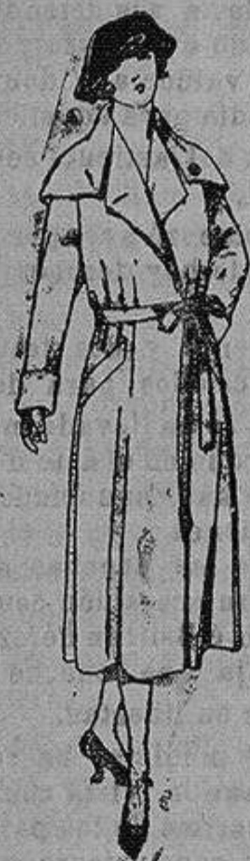
Abrigos de seda, impermeables. de ptas. 130 a 275

Ropas confeccionadas para Caballero, Señora, Niño y Niña Pelotería, Camisería, Sombreros de punto, Corbatería, Guantería, Sombrerería, Zapatería, Paraguas, Bastones y Artículos de Viaje