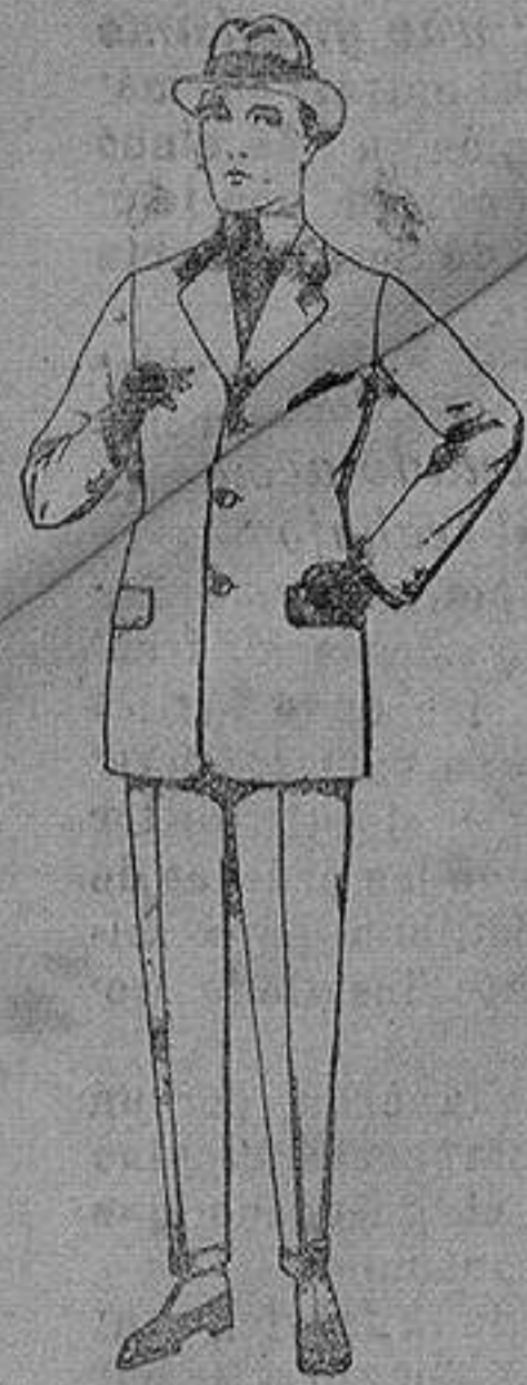
Trajes de cheviot, patén etc de ps. 88 a 185

Sucursales: Madrid, Barcelona, Almeria, Bilbao, Cadiz, Cartagena, Gijón, Granada, Málaga, Palma de Mallorca, Santander, Sevilla, Valencia, Valladolid, Zaragoza