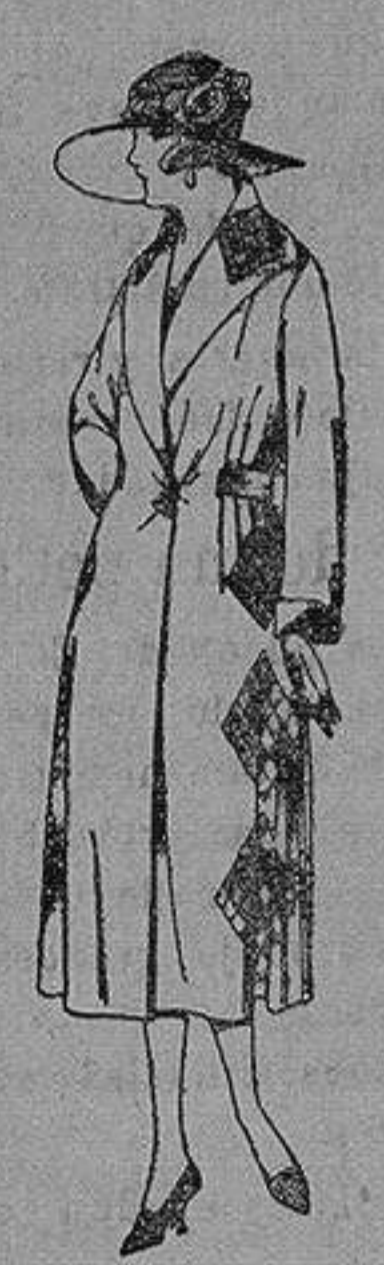
Abrigos de gamuza, ratina, etc. en negro, azul y color, adornos y respuntes seda de ptas. 65 a 110

Ropas confeccionadas para Caballero, Señora, Niño y Niña Pelotería, Comisaría Géneros de punto Corbatería, Guantería, Sombrerería, Zapatería, Paraguas Bastones y Artículos de Viaje