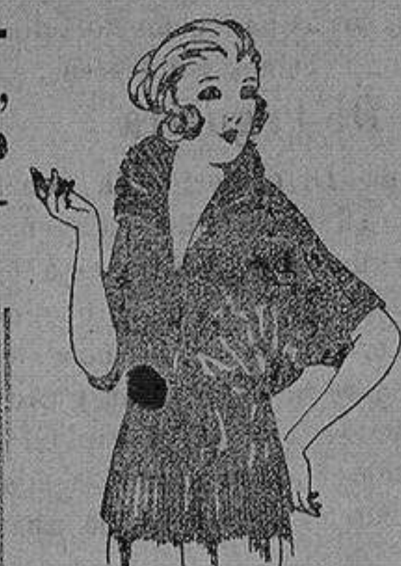
Blusas de Charmense, granadina, etc. en negro, azul y color de ptas. 30 a 55