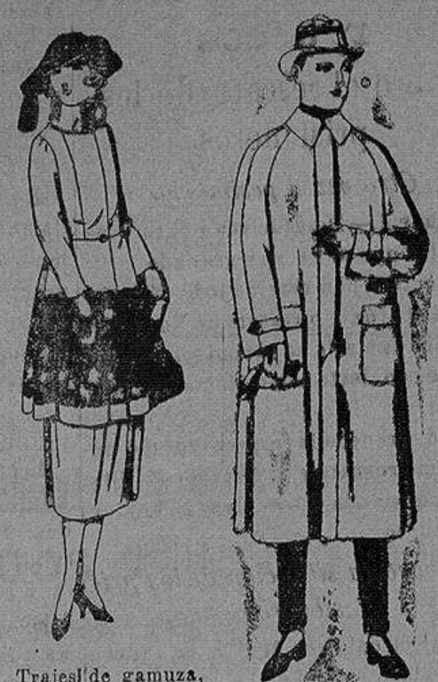
Trajes de gamuza, adornos bordados y con piel, en negro, azul y color de ptas. 180 a 230