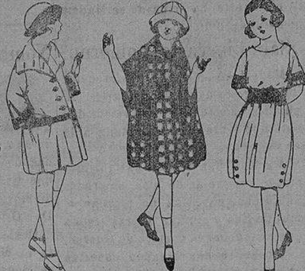
Abrigos de gamuza, ratina, etc. en diferentes colores y dibujos, para niñas de 4 a 9 años de ptas. 25 a 55