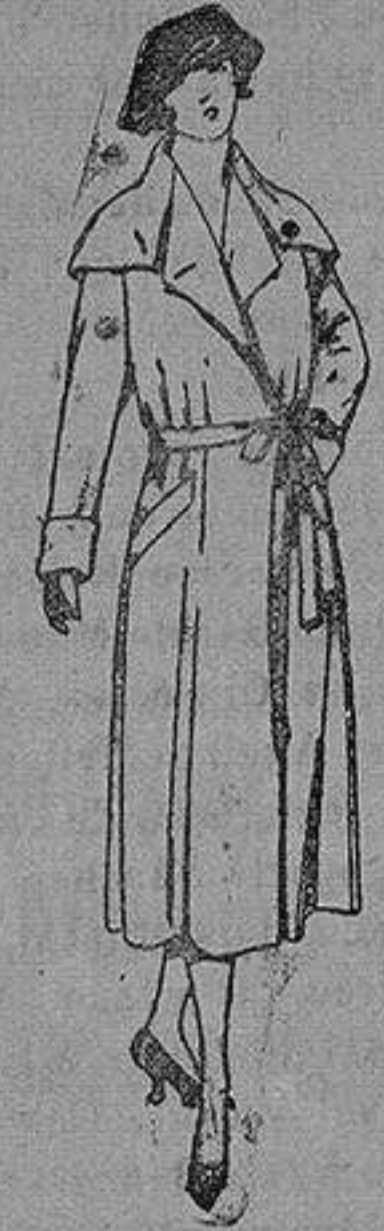
Abrigos de seda impormebles. de ptas. 130 a 225

Ropas confeccionadas para Caballero, Señora, Niño y Niña Pelotería, Comisaría Géneros de punto Corbatería, Guantería, Sombrerería, Zapatería, Paraguas Bastones y Artículos de Viaje