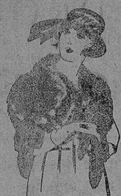
Cuello piel Renardina en blanco, marrón, gris y negro. de ptas. 18 a 40