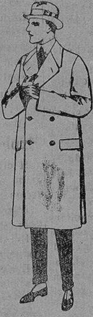
Gabanes de patén, gamuza o cover. de ptas. 60 a 200