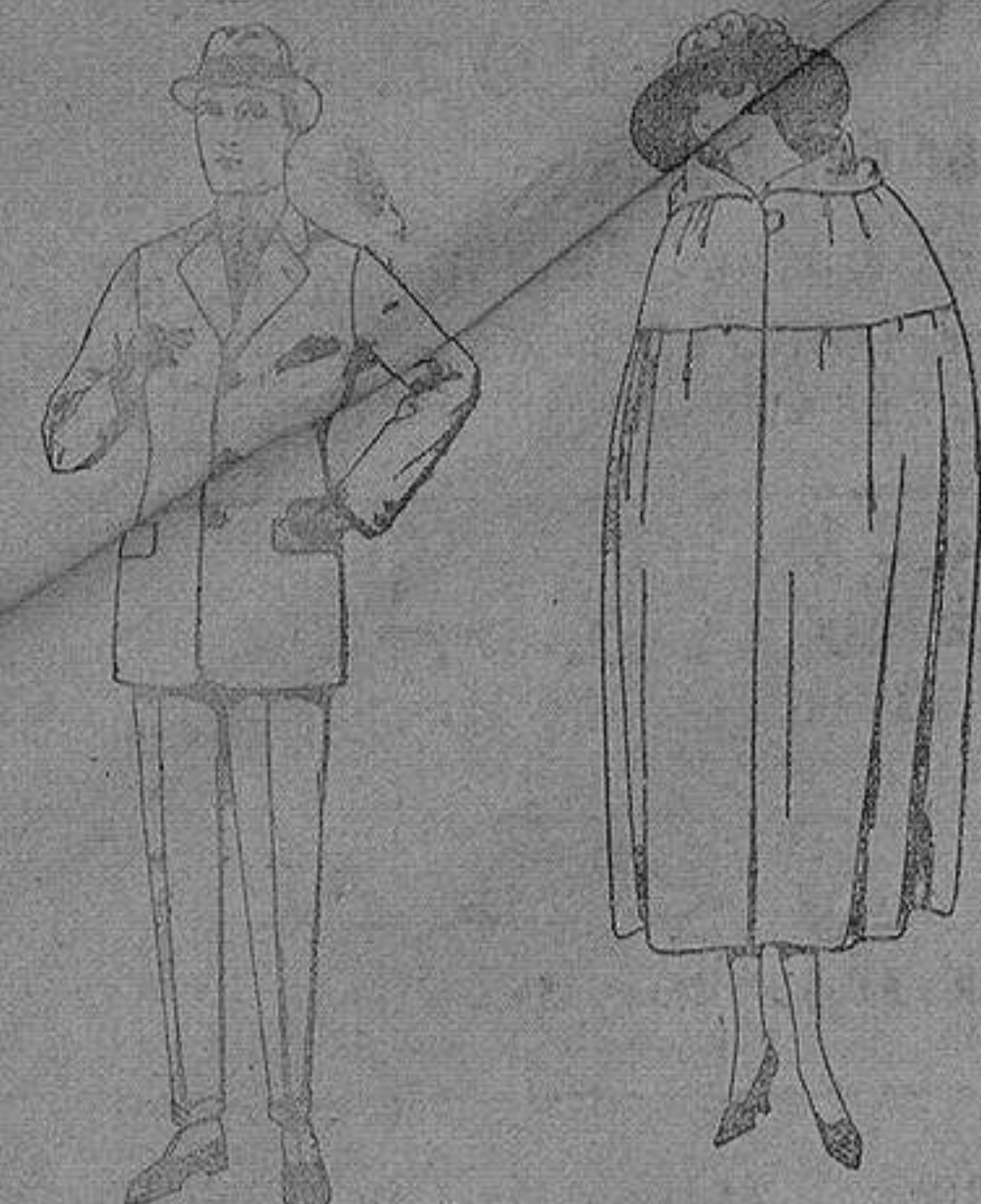
Trajes de chariot, patén etc. de ps. 88 a 136

Sucursales: Madrid, Barcelona, Almería, Bilbao, Cadiz, Cartagena, Gijón, Granada, Málaga, Palma de Mallorca, Santander, Sevilla, Valencia, Valladolid, Zaragoza