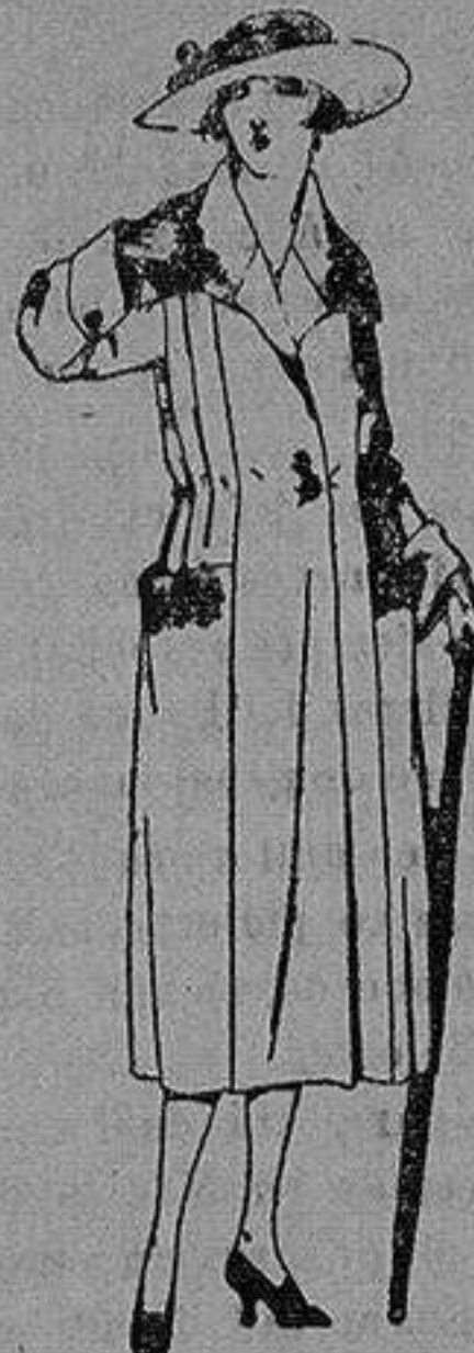
Abrigos de pañete, gamuza etc. en azul y color, adornos bordados. de ptas. 70 a 120