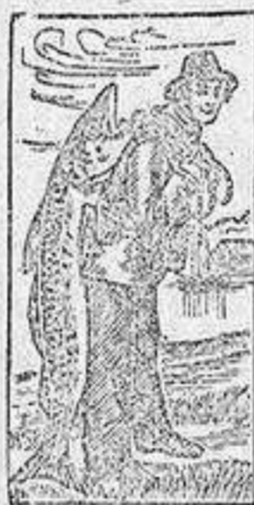
Marca de fábrica.

no descuidar un catarro pues puede ser precursor de pulmonías, de la Tisis, ó de otras graves enfermedades. La Emulsión de Scott cura el catarro, sana la irritación de la garganta y los pulmones, fortifica y robustece el organismo. Es una combinación de los dos agentes curativos, aceite de hígado de bacalao ó hipofosfitos, reconocidos universalmente por los médicos como los más poderosos en las enfermedades extenuantes y especialmente para los Niños. Exijase la legítima