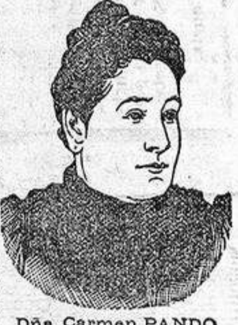
Una distinguida comadrona escribe