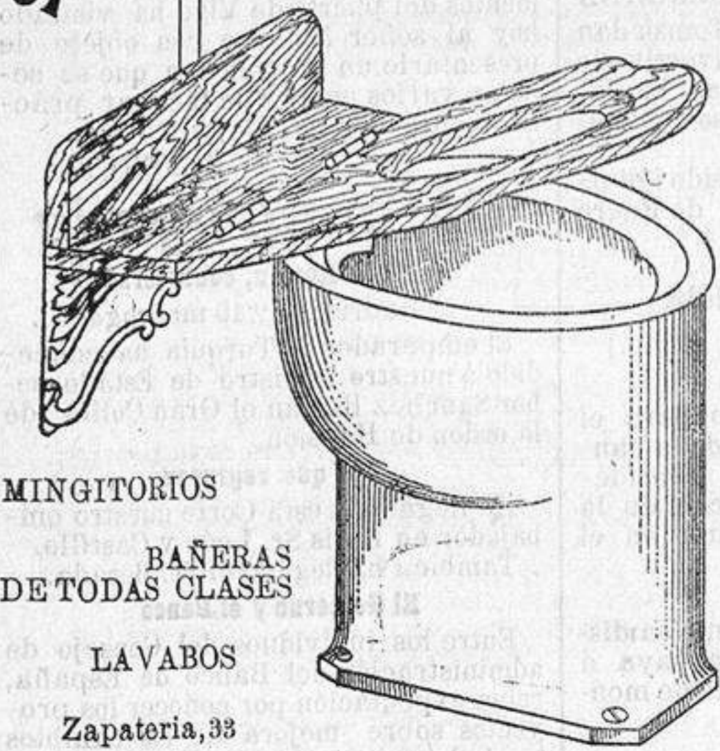
MINGITORIOS BAÑERAS DE TODAS CLASES LAVABOS Zapateria, 33