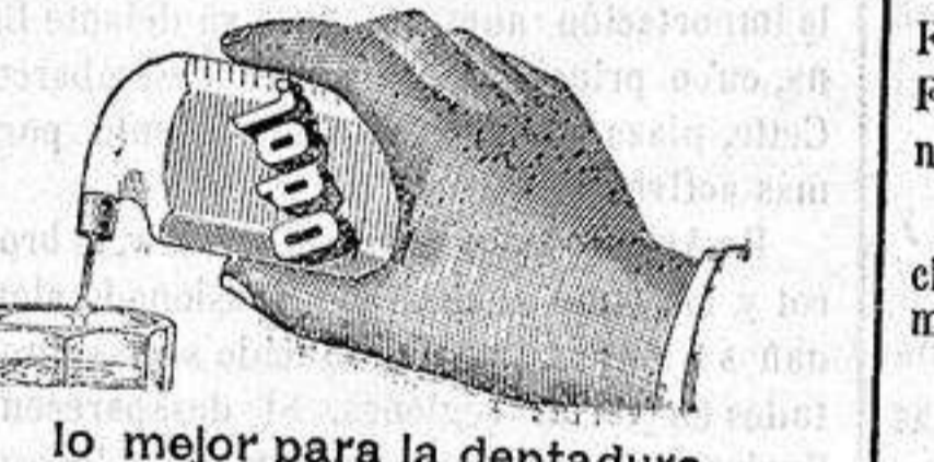
lo mejor para la dentadura el frasco Ptas. 5/50.

Se ha señalado el jueves próximo para el acto de entregar á la Reina la contestación del Congreso al Mensaje de la Corona, para lo cual irán