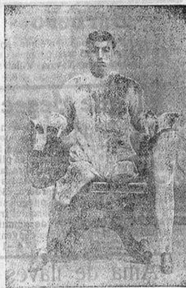
Antes del tratamiento.

MÉDICO ORTOPÉDICO DE LAS CLÍNICAS DE BERLÍN Y VIENA