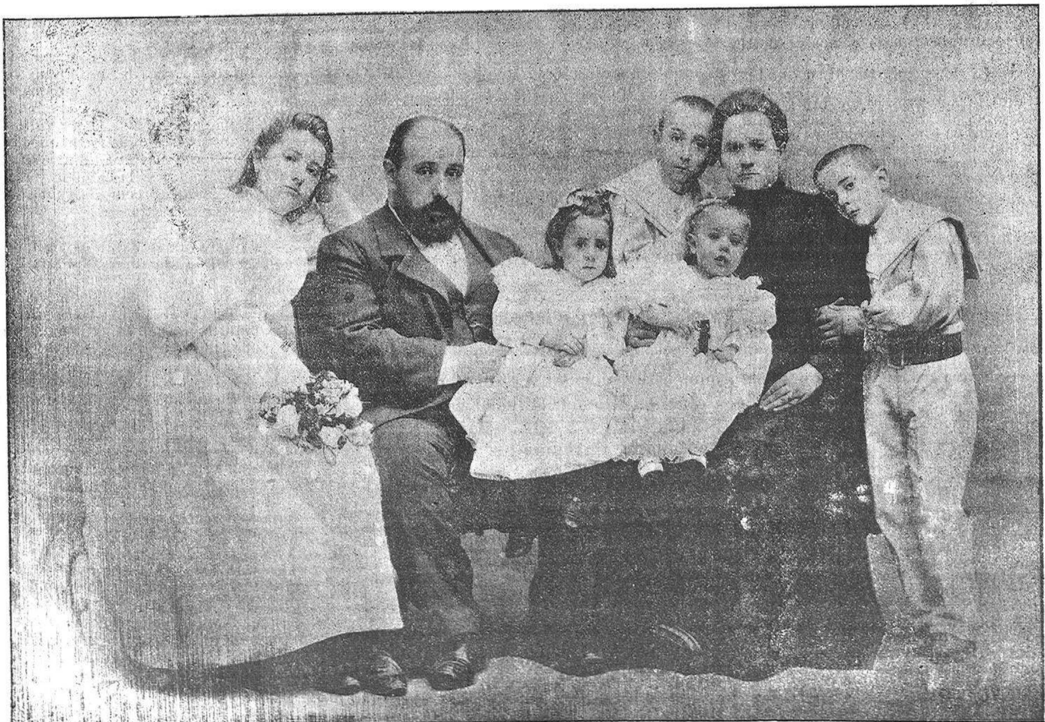
LOS DUCHS DE SOLFERINO Y SOS FILLS

Era la Duquesa una de las damas carlistas més estimada de nostra Familia R..... y al seu costat havia passat recientment llargas temporadas en Venecia, Bruselas y Lucerna, puig el Sr. Duch es sens dupte un dels que 'ns podria ilustrar respecte la marxa del Carlisme en los presents y crítichs días.