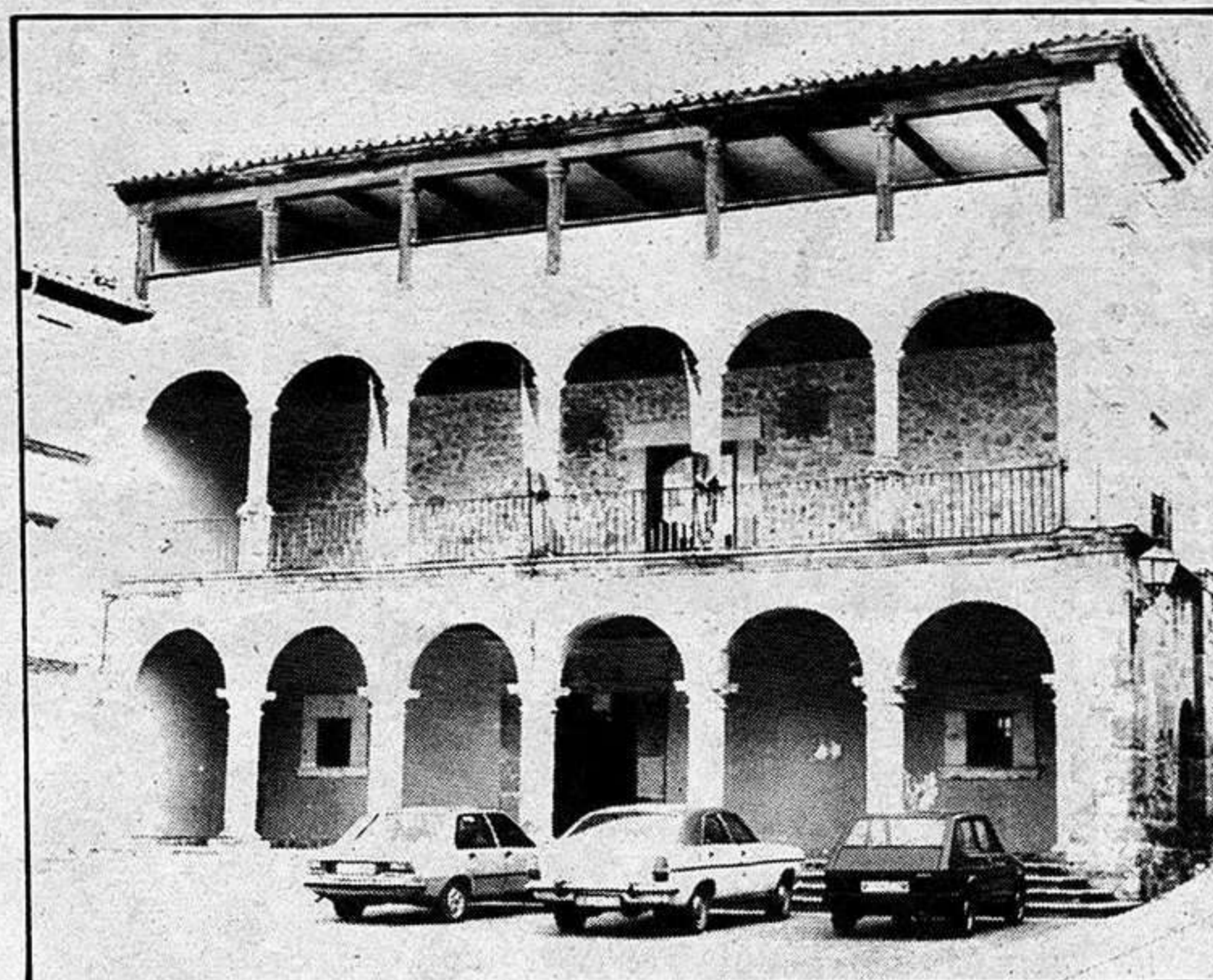
Una vez aprobado el Presupuesto Municipal Ordinario, éste permanecerá expuesto en el Ayuntamiento de Sigüenza