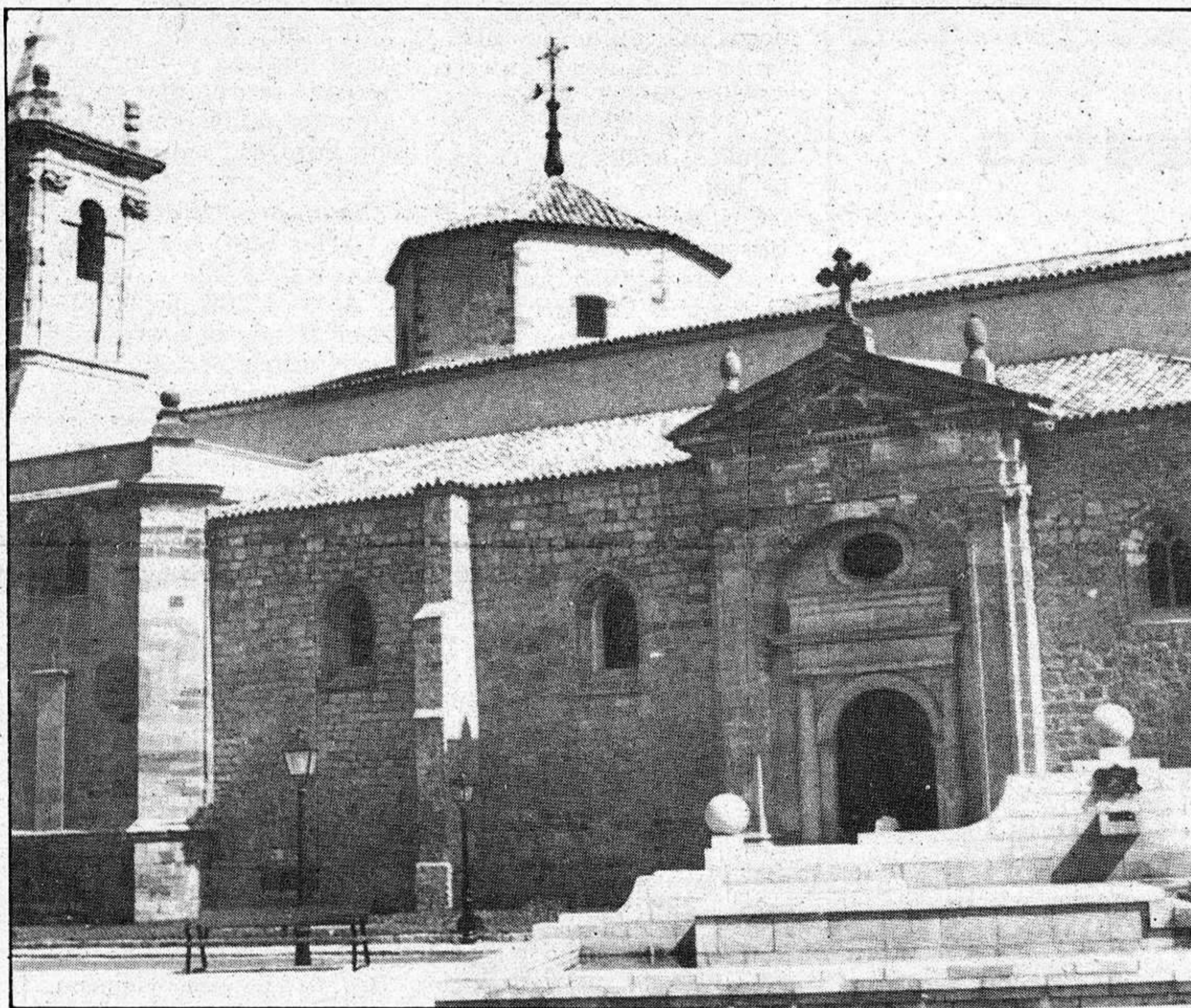
La iglesia de San Francisco, actual Centro Cultural

Jadraque: día 23 de mayo a las 21,00 horas en los