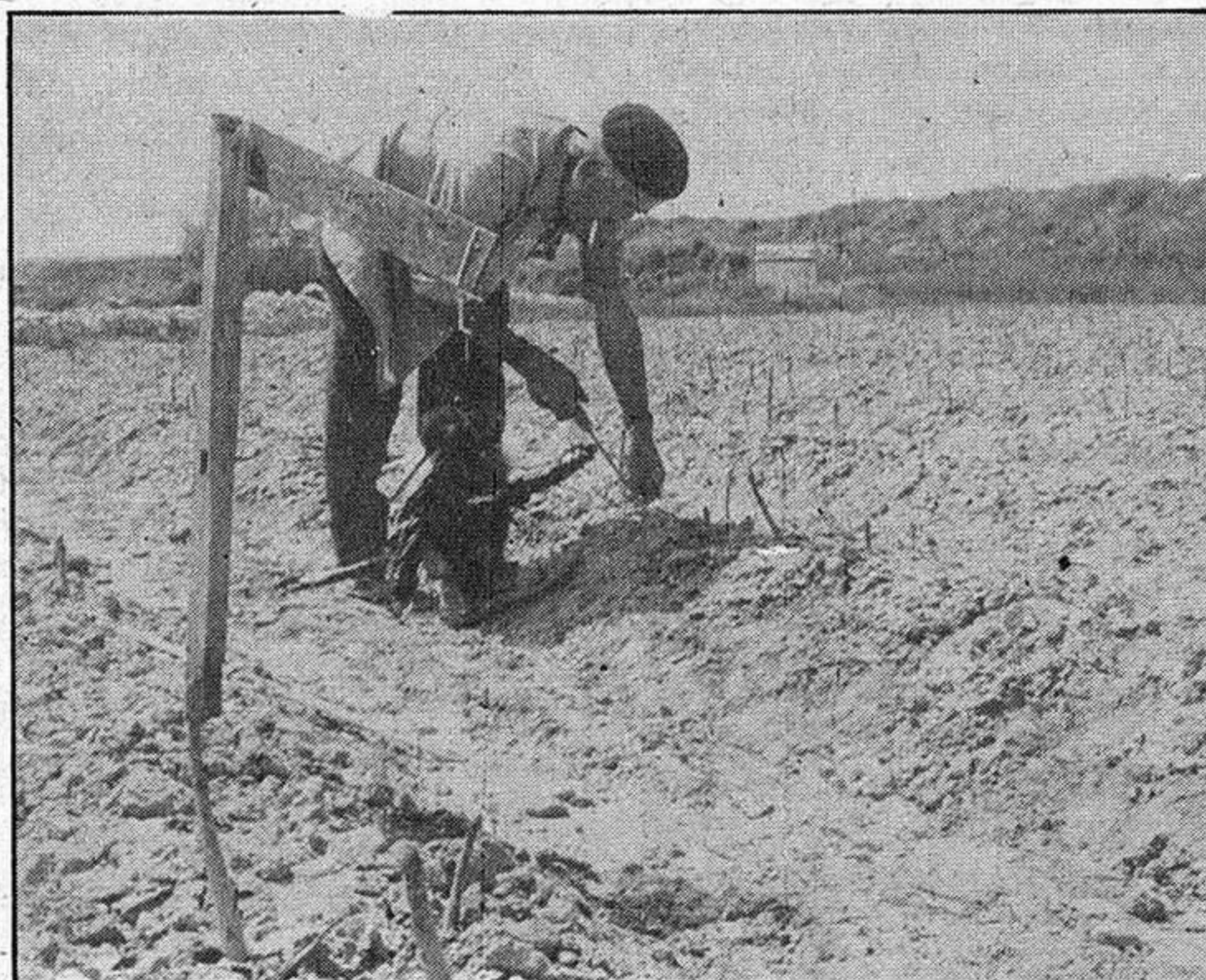
Los agricultores hicieron ayer día de descanso para conmemorar a su patrón, San Isidro Labrador

Los actos comenzaron a las 11 de la mañana con una solemne misa en la iglesia de San Ginés, y posterior procesión con el Santo hasta el parque de la Concordia donde se llevó a cabo la ofrenda de productos de campo y niñas del colegio provincial San Jo-