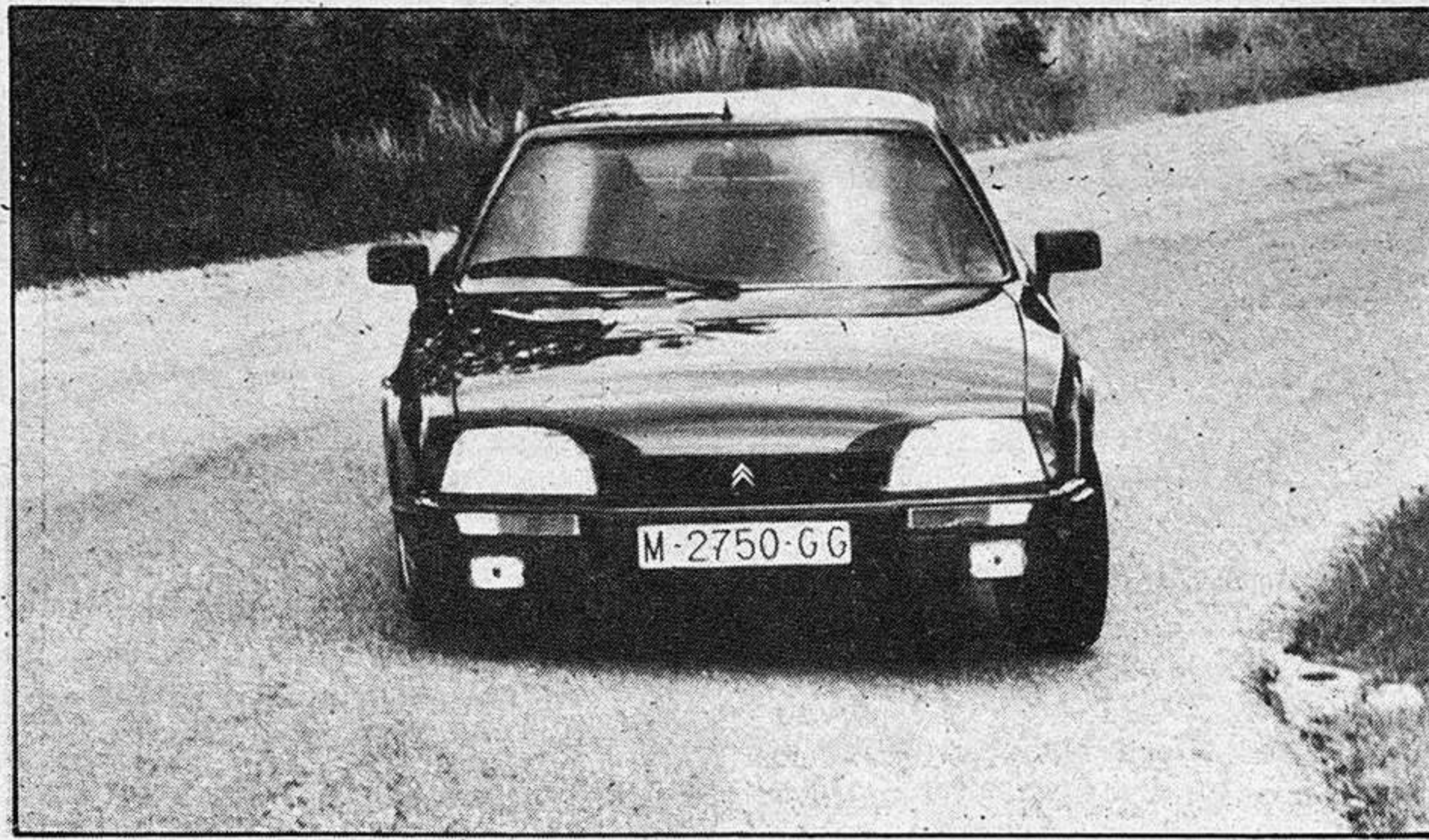
Un potente equipo de iluminación es la nota dominante de esta versión GTi Turbo del Citroën CX en su vista frontal. Sobre el capó-motor, una discreta "T" —hay muchas otras a lo largo y ancho del automóvil— recordando la naturaleza del motor.