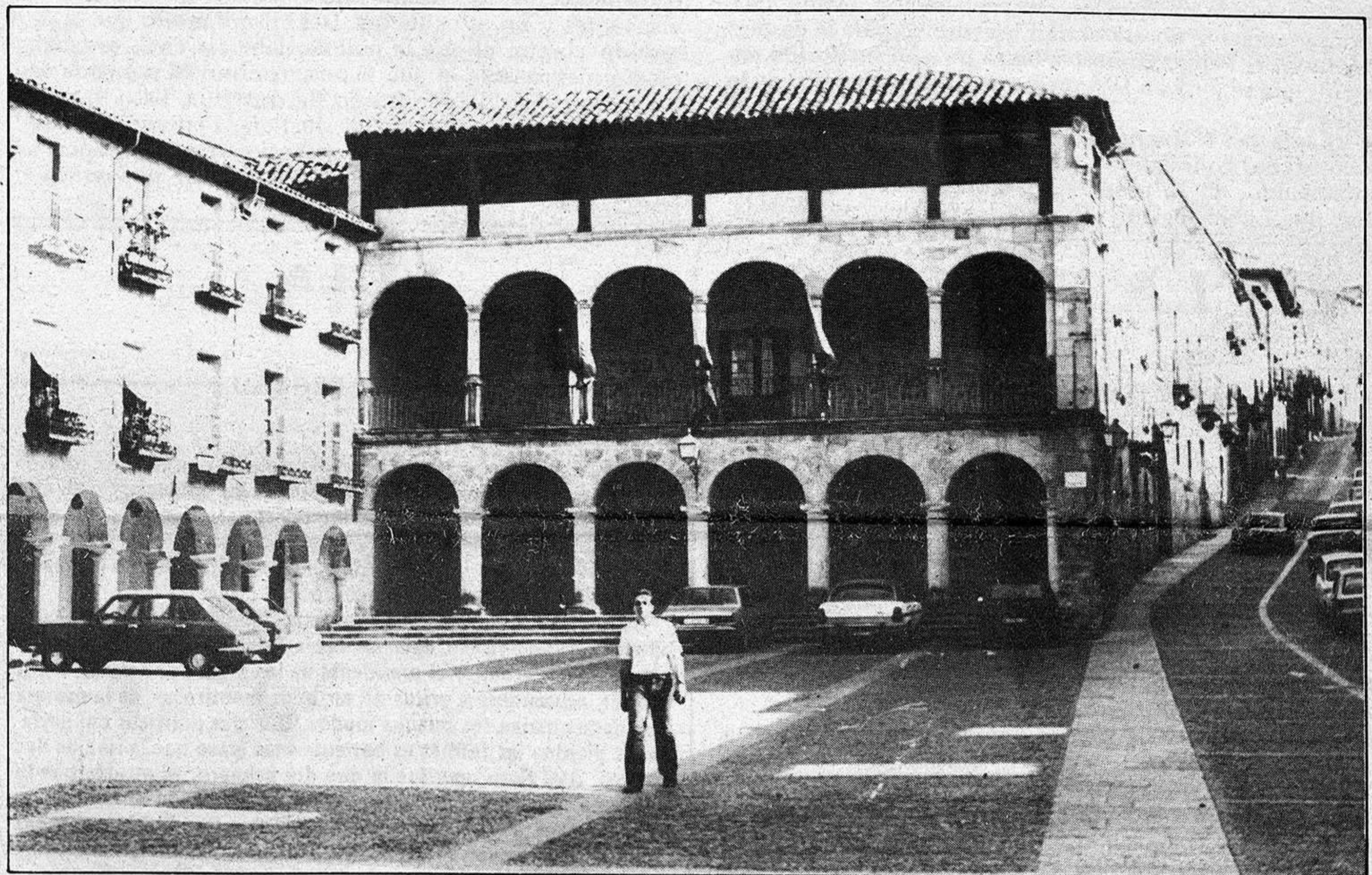
Ayuntamiento de Sigüenza.

Durante la celebración del pleno, —duró aproximadamente tres horas— que tuvo lugar el martes