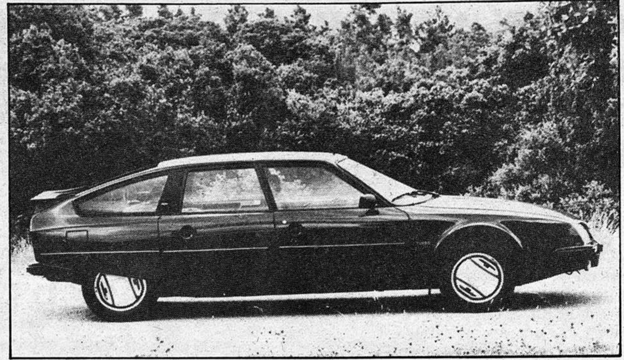
De nuevo menciones en forma de "T" en el Citroën CX GTi Turbo, en este caso sobre las llantas, que son de diseño específico para la versión y están hechas en aluminio. También es específico el alerón posterior, más ornamental que efectivo