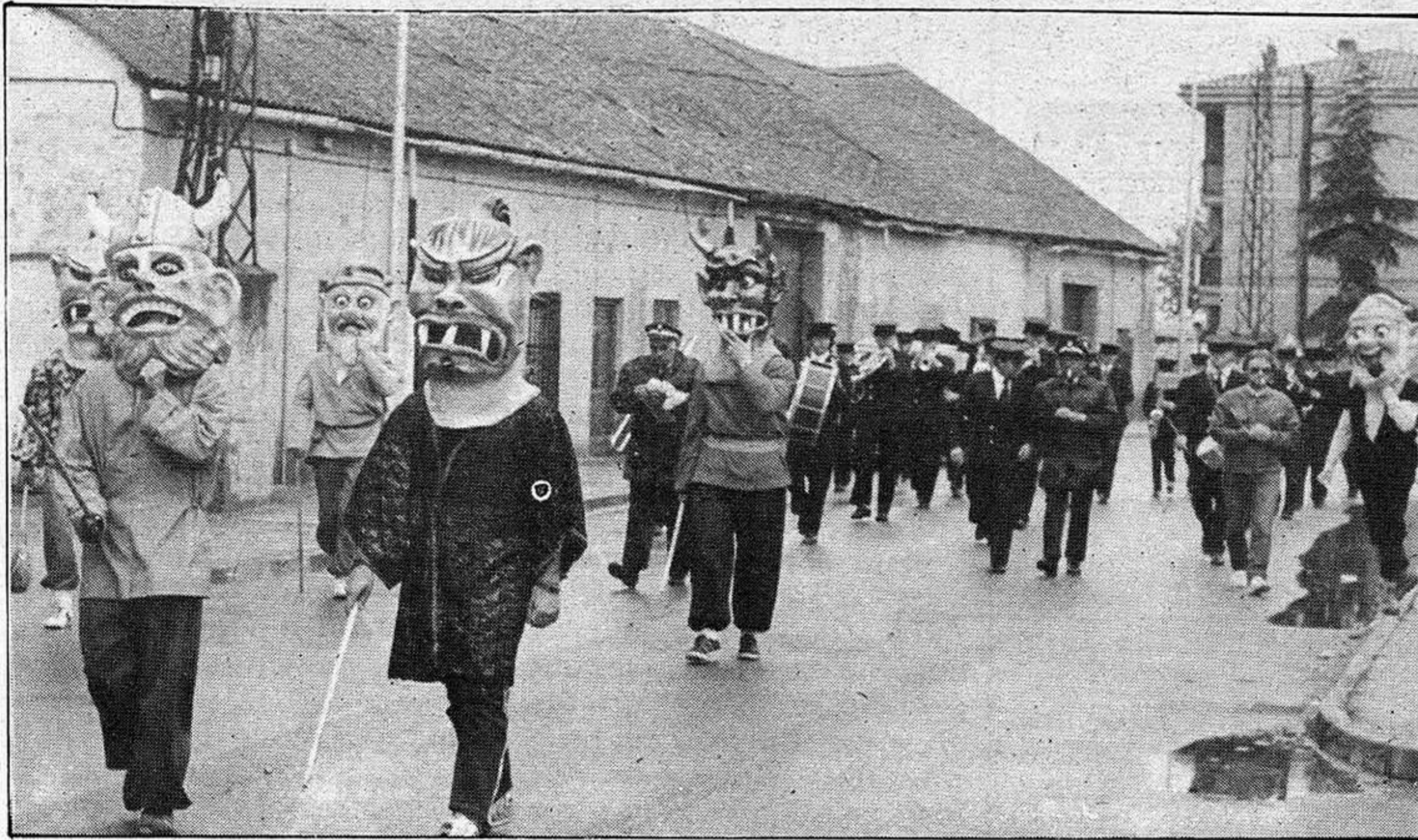
Pasacalles de las fiestas de San Isidro en Azuqueca