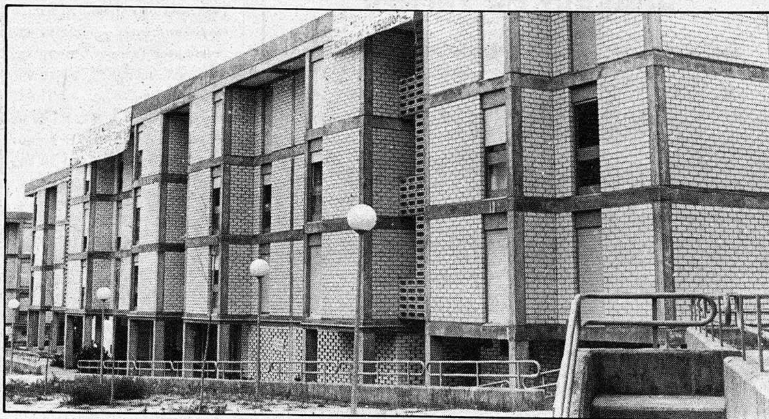
Polígono "El Balconcillo"

A propuesta del consejero de Presidencia y Gobernación, el gabinete José Bono acordó remitir hoy jueves a la Mesa de las Cortes el proyecto de ley de la función pública de Castilla-La Mancha. Este proyecto de ley tiene como características es de estar originado tanto en el estatuto de autonomía como en el texto de la ley de la reforma de la función pública. Entre las características de este proyecto de ley figuran las siguientes: está previsto que el cincuenta por ciento de los altos cargos —directores generales y secretarios generales técnicos— sean funcionarios; otra peculiaridad, importante