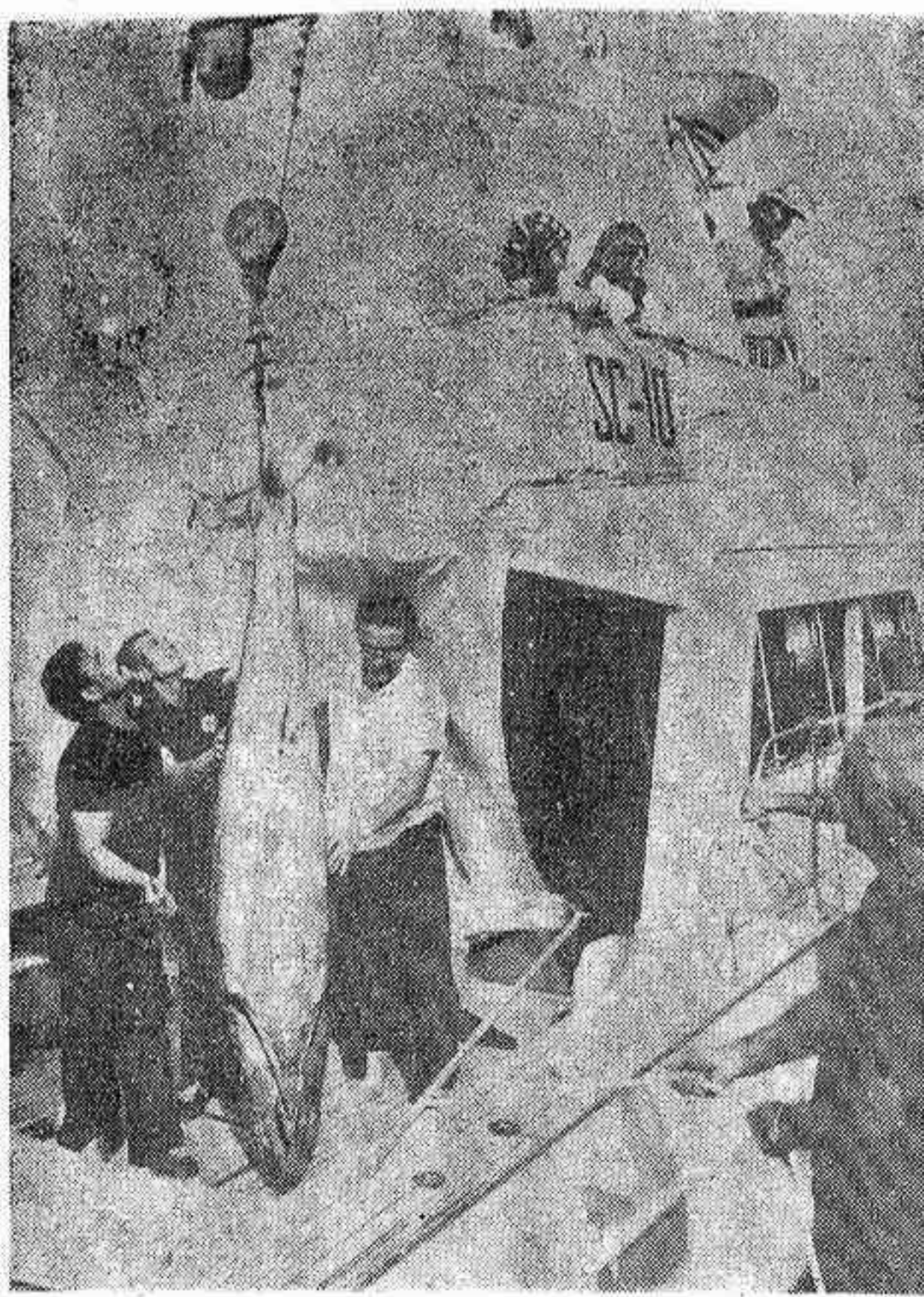
embarcación «La Ulla II», al salir del puerto se rompió y hubo de regresar, y el «Esturión», precisamente el segundo clasificado, estuvo a punto de perder su puesto y quedar descalificado a causa del tiempo que empleó en

—¿Habrá atún en los próximos días? —Lo veo difícil, las embarcaciones suelen ir a la misma zona y esto en parte es un obstáculo. Desgraciadamente, en la jornada de ayer, la suerte no estuvo demasiado repartida. La