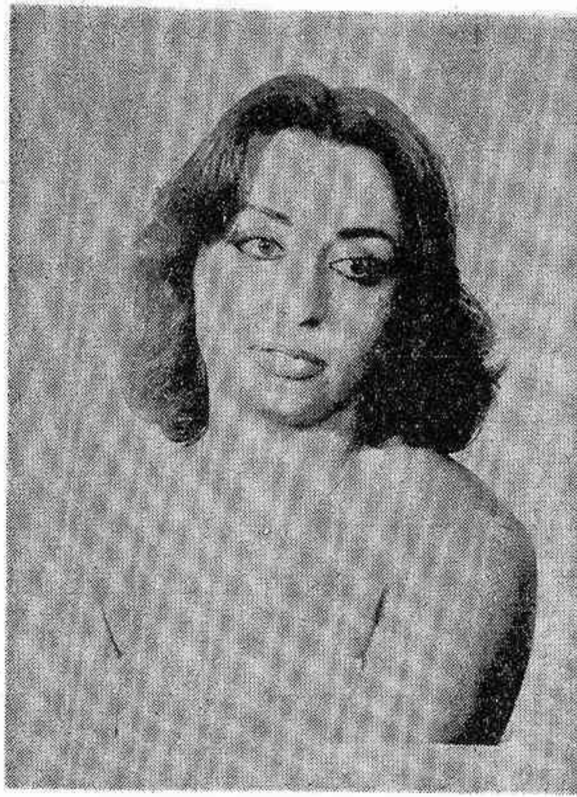
Me gusta ir a la última moda, soy romántica y algo temperamental.

¿Qué representa para ti esta elección? Una gran ilusión porque representar a un pueblo es algo muy importante.