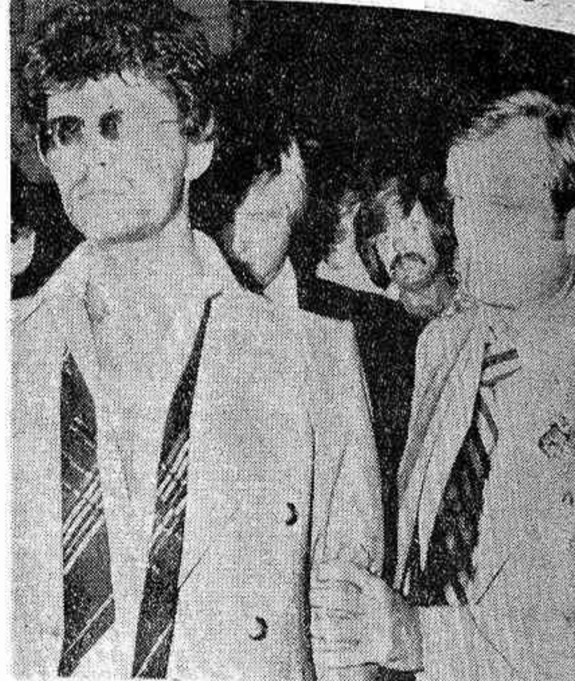
En la foto, la Policía escolta a los dos terroristas croatas después de que se rindieron...