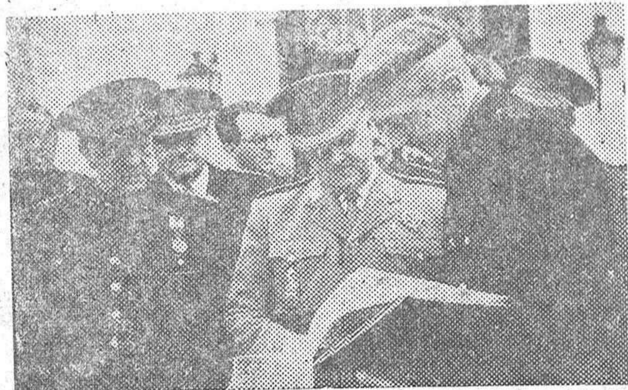
Con motivo del X aniversario de la fundación, el Frente de Juventudes ha rendido un homenaje ante el Caudillo de España, tras de haber finalizado en Arenys del Mar su IX Consejo Nacional. Asistieron al acto más de tres mil muchachos de las Falanges Juveniles de Franco y otros doscientos jefes de Falange de los campamentos «Santa María» y «Sancho el Fuerte».—SCRIP.

Mañana domingo, a las once y media, se celebrará en el paseo de Calvo Sotelo una «Mañana del camarada», en la que actuarán diversos grupos musicales y de teatro, a la que está invitado todo el vecindario.