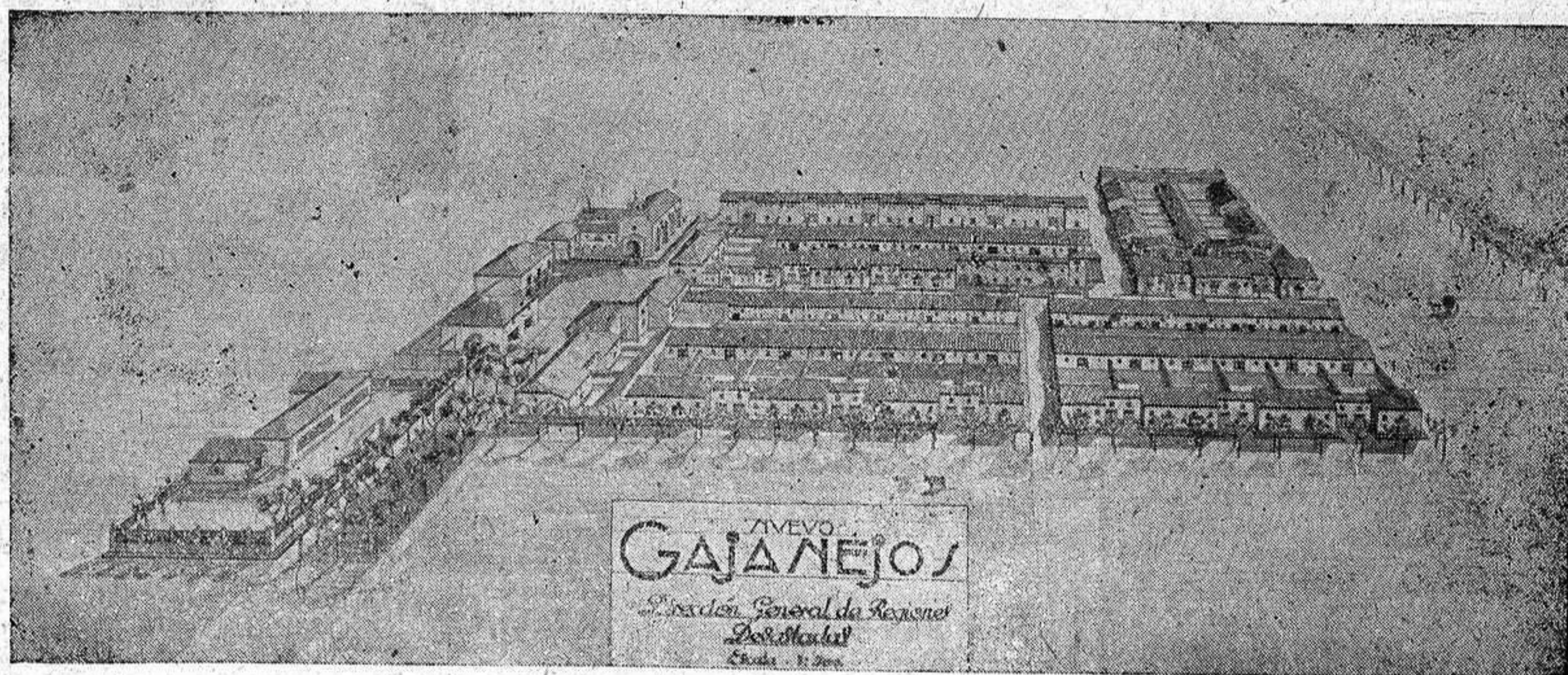
Fotografía de la maqueta del nuevo pueblo de Gajanejos, reconstruído por Regiones Devastadas, que esta tarde ha sido inaugurado oficialmente por el Caudillo.