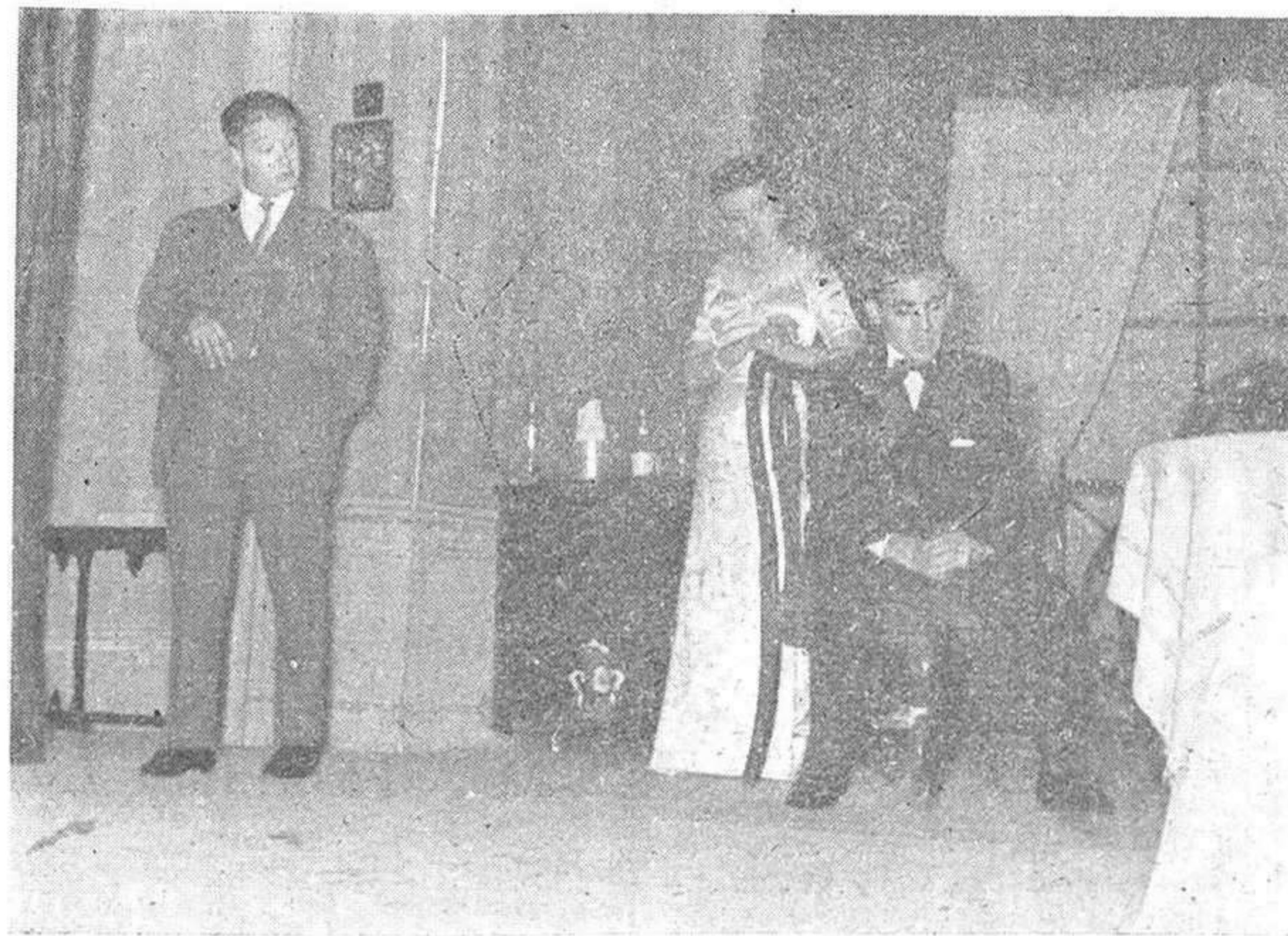
Una escena de «Llama un inspector»

tada por todos los demás, y una vez terminada, se elevan en el templo las notas solemnes de una salve. Después, los muchachos depositan ante la imagen un magnífico ramo de claveles y todos, tras de santiguarse devotamente, salen de nuevo a la calle.