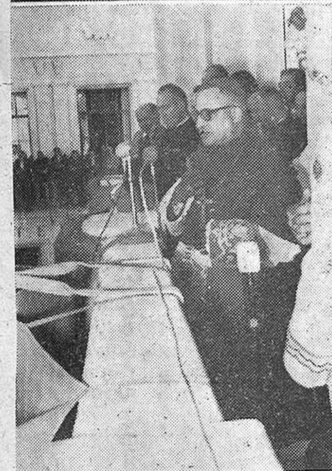
Arriba: El Excmo. Sr. Obispo, don Pablo Gúrpide Beope, durante el solemne Tedeum celebrado en la iglesia parroquial de San Nicolás, y posteriormente durante su importante discurso, pronunciado en el balcón principal de nuestro Palacio Municipal, ante millares de arriacenses.