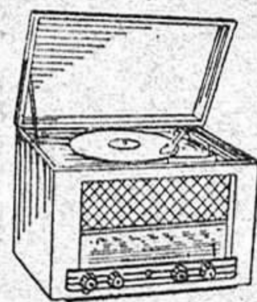
HE 423 A