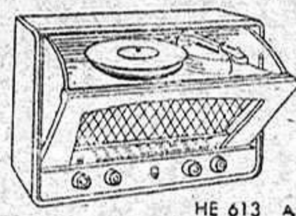
HE 613 A

Canjee este anuncio por su tarjeta-participación en un Distribuidor Philips