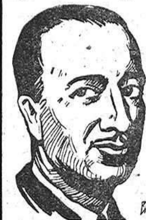
Ministro plenipotenciario, señor Erice

hacia los pueblos árabes, tan vinculados por la historia y profundas afinidades espirituales a nuestra patria. Embajada extraordinaria que, como ha dicho nuestro Caudillo en su mensaje, radiado a los pueblos árabes, van a reforzar estos lazos y testimoniar a los jefes de Estado y hombres de gobierno árabes la gratitud de España por la digna actitud que en su defensa mantuvieron en el campo de los debates internacionales.