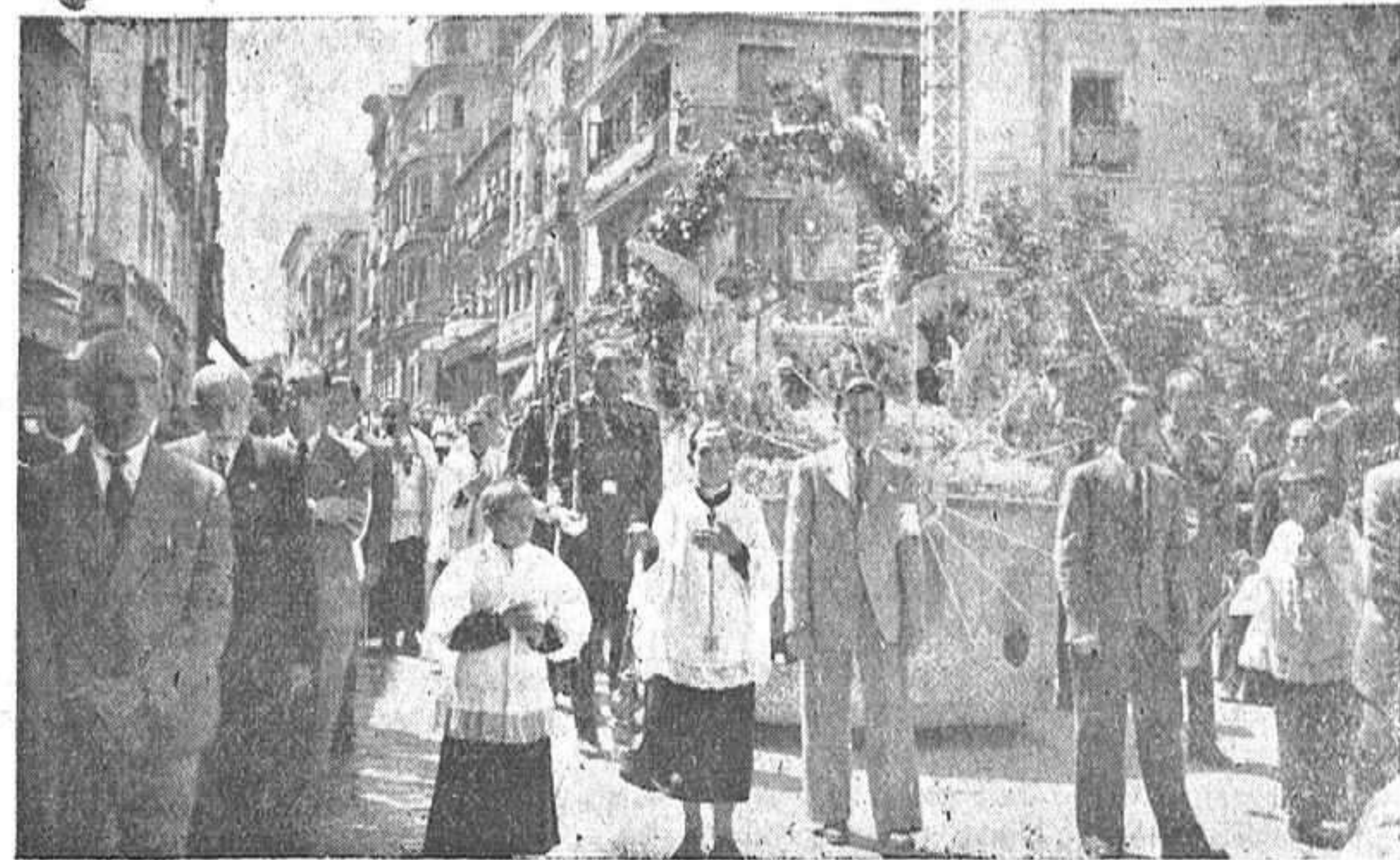
Aunque con algún retraso, debido a no existir talleres de fotográfico en nuestra capital, publicamos esta fotografía de la procesion del Corpus a su paso por las calles de la ciudad.

Particular vende magnífica y selecta COLECCION DE DISCOS Totalmente nuevos. Mozart, Strauss, Wagner, Rimski, Chopin, Rossini, etcétera, y zarzuelas españolas: Razón: Museo, 33, pral.