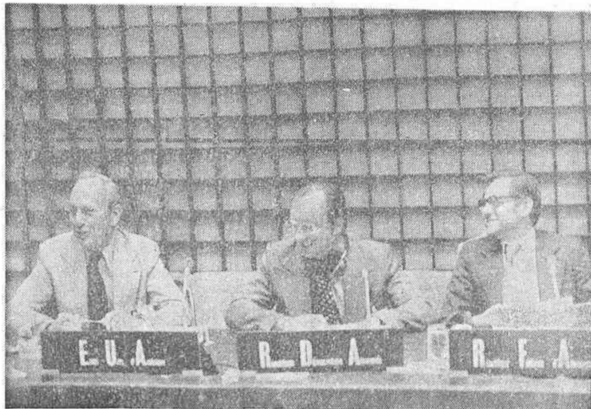
Delegados de Estados Unidos de América, República Democrática Alemana y República Federal Alemana en la sesión preparatoria para la cumbre de la Conferencia Europea de Seguridad y Cooperación, que concluyó con un acuerdo que ratifica la propuesta española. La cumbre se celebrará en el próximo mes de octubre.