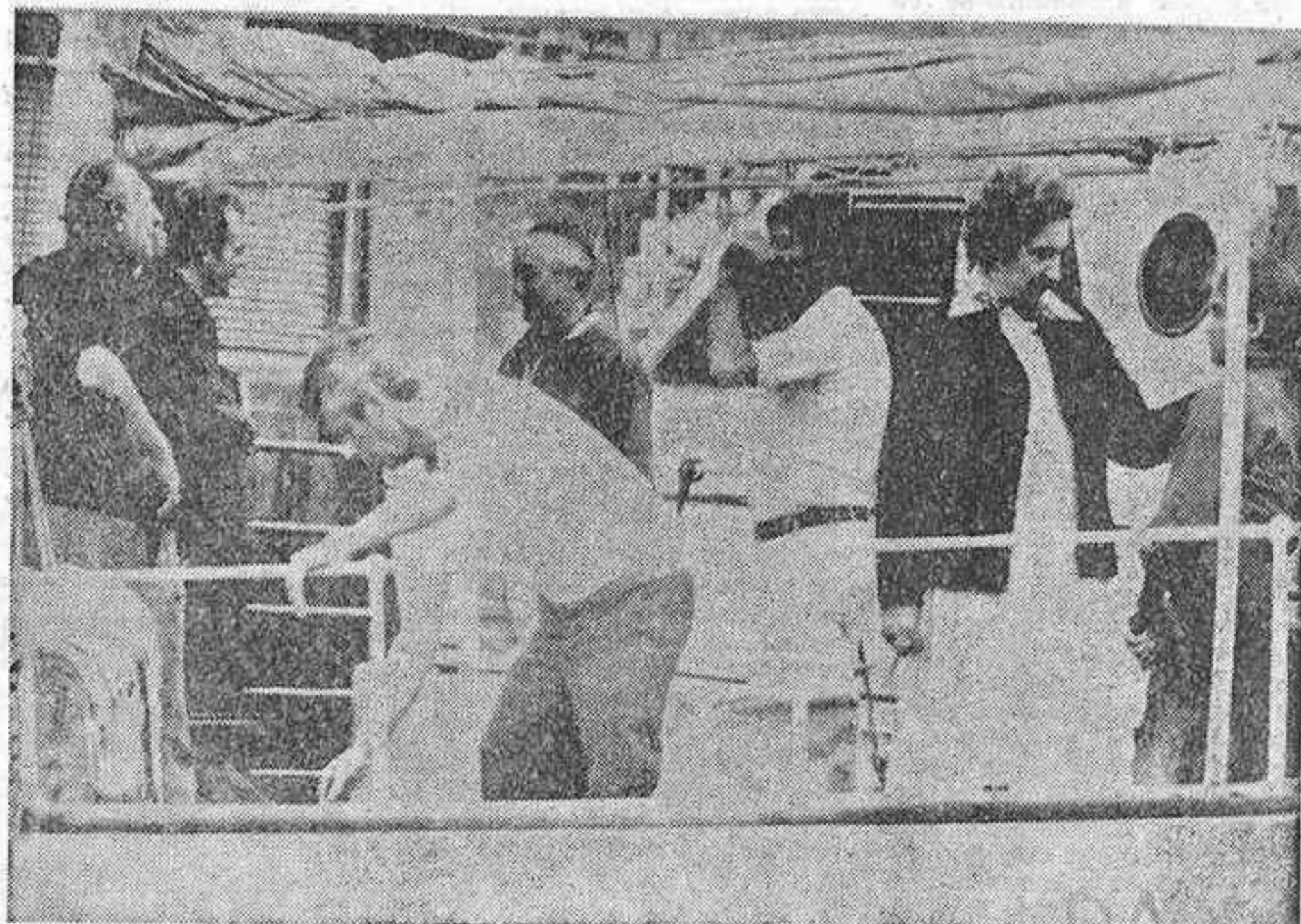
SS. AA. RR. los Condes de Barcelona llegaron ayer a Palma de Mallorca a bordo del "Giralda", que atracó en el puerto junto al "Fortuna" de los Reyes de España. Posteriormente S.M. el Rey, acompañado de sus hijos, el Príncipe de Asturias y las infantas Elena y Cristina, llegó al puerto para reunirse con sus padres. En la foto, S. M. el Rey junto a los condes de Barcelona, a bordo del "Giralda".