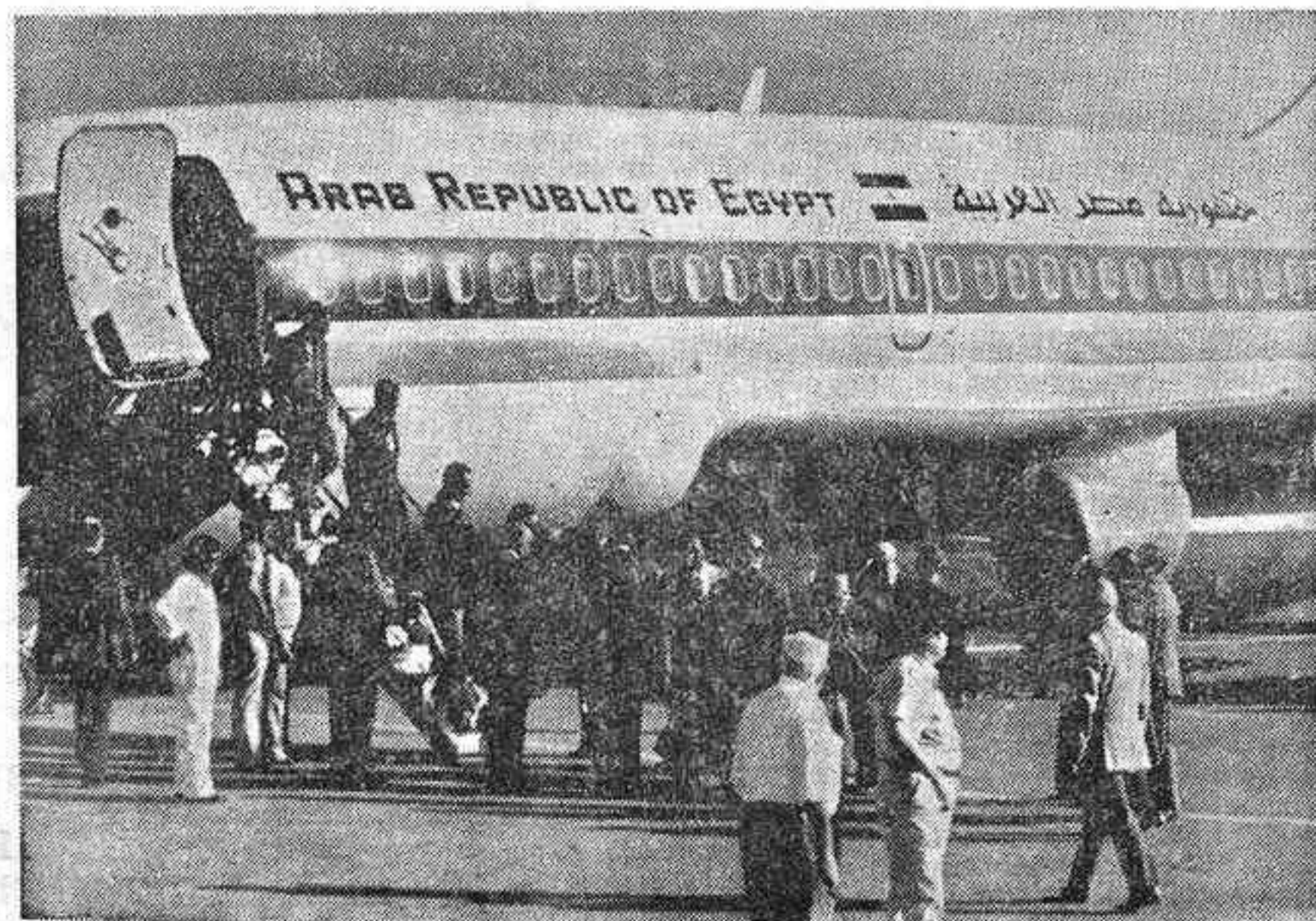
TELL AVIV.—Oficiales israelíes dan la bienvenida a oficiales del Ejército egipcio a su llegada al aeropuerto Ben Gurion para preparar la visita que realizará el presidente Anwar El Sadat a Israel hoy sábado.