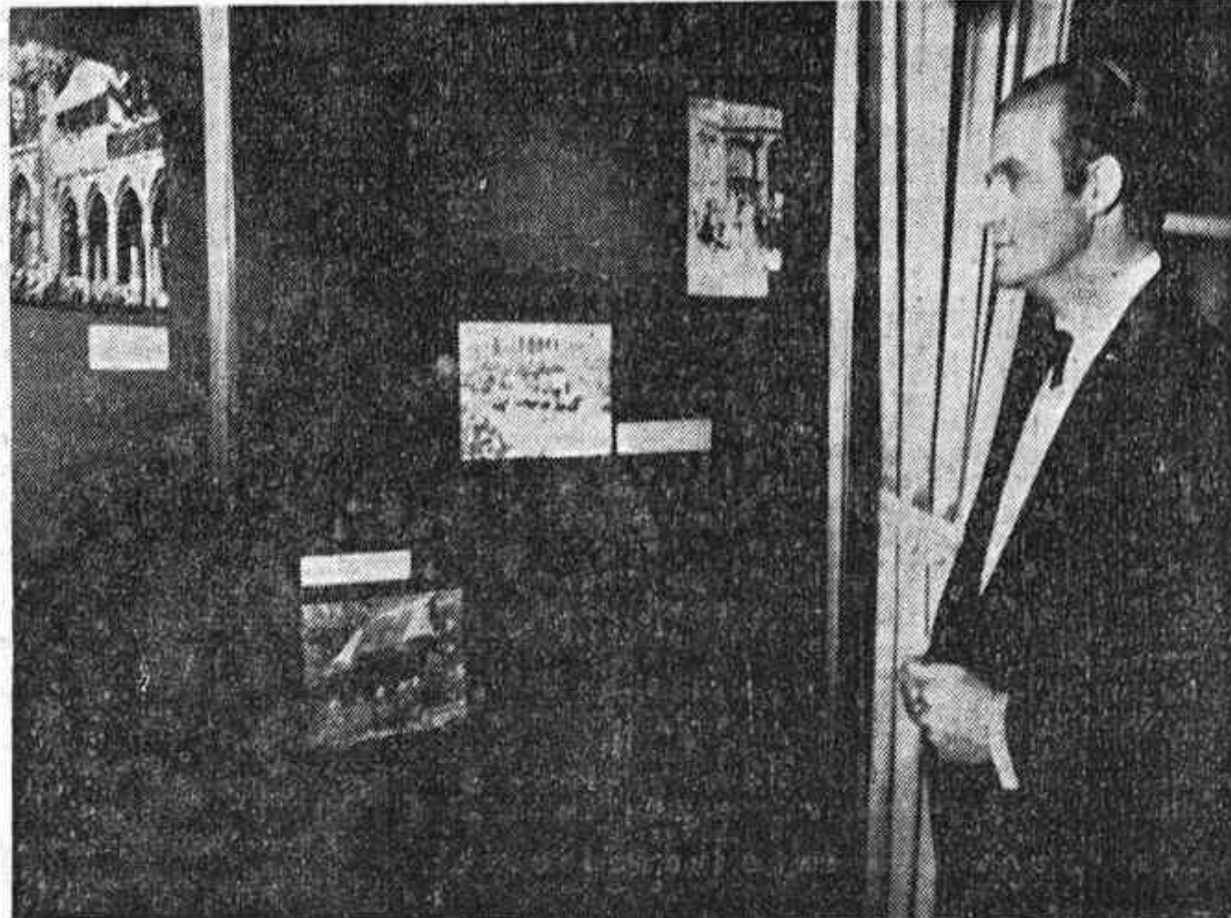
BRUSELAS.—Su Majestad el Rey don Juan Carlos visitó la Exposición retrospectiva de documentos gráficos del viaje oficial de don Alfonso XIII a Bélgica en el mes de mayo de 1923.

SE PUSIERON EN CONTACTO DIRECTO CON LOS TRABAJADORES ESPAÑOLES EMIGRANTES