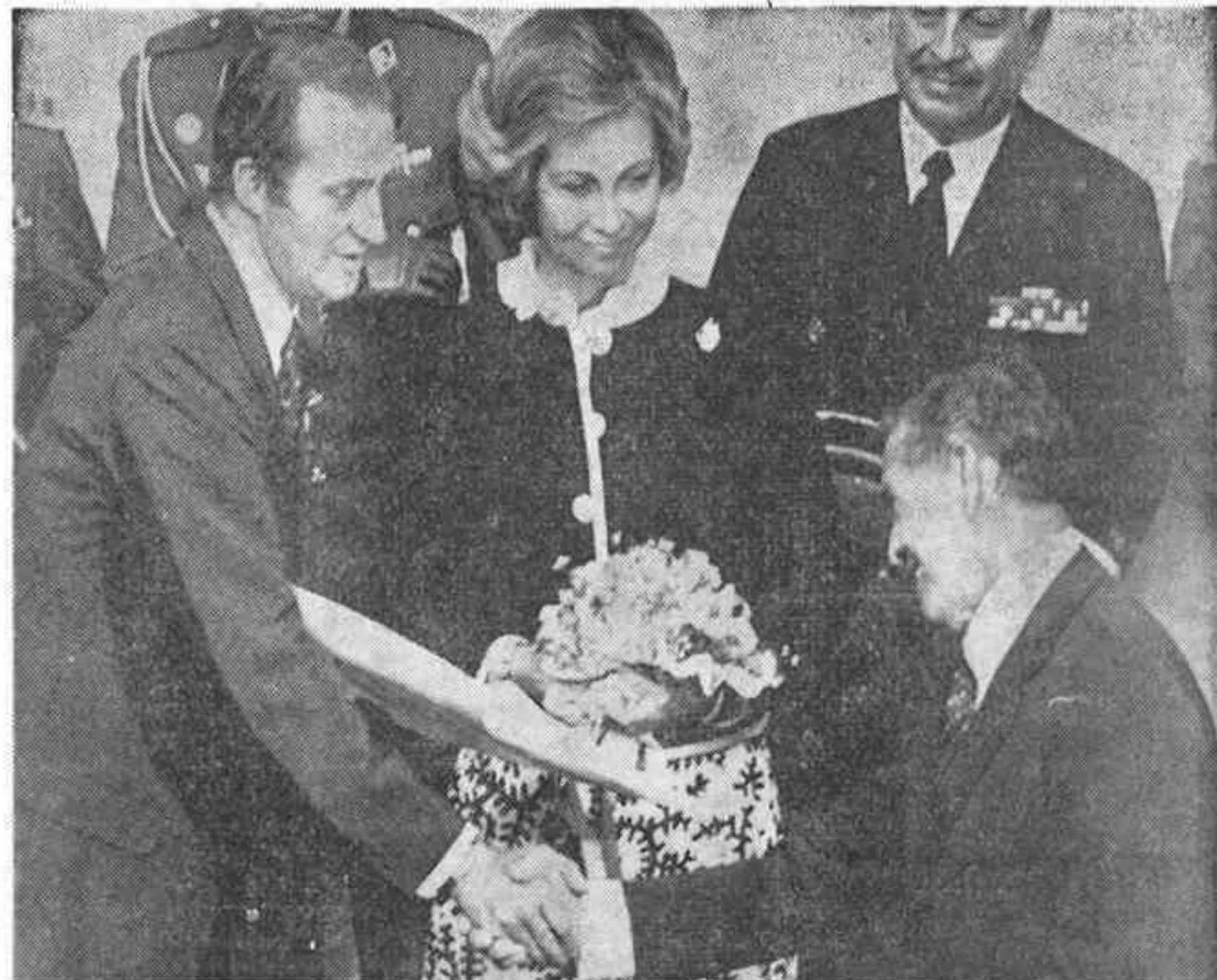
QUITO. — S. M. el Rey don Juan Carlos, recibe de manos del Presidente del Instituto Ecuatoriano de Cultura Hispánica, el pergamino que le acredita como Presidente honorario de la referida institución. El acto se celebró en la Casa de Benalcázar.

Los monarcas ofrecieron una cena de gala al presidente Roldos