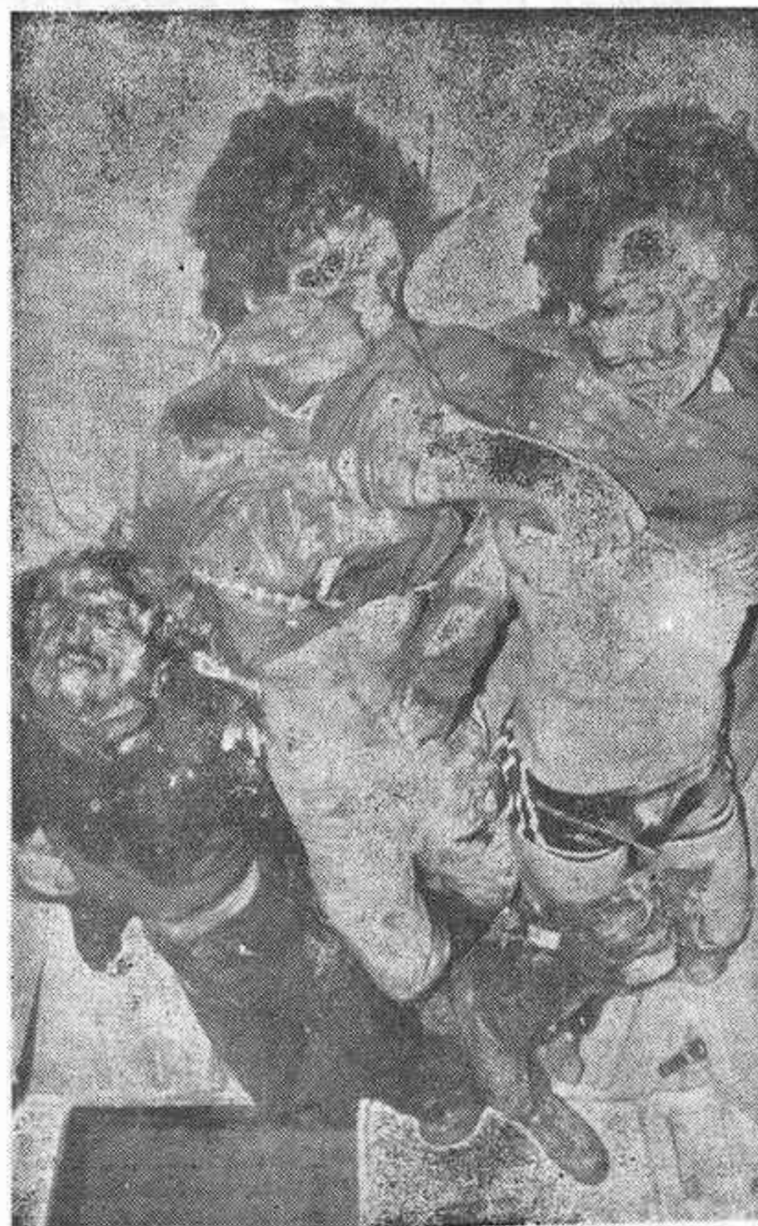
KIBBUTZ HANITA (Israel). — Tropas israelíes dieron muerte a tres comandos palestinos armados, que cruzaron la frontera libanesa. El choque, en el que no se registró ninguna baja israelí, ocurrió a dos millas al sur de la frontera, y es el primer incidente desde el pasado día 7 de abril, en que cinco palestinos fueron muertos en el asalto a una guardería infantil en Misgav.

VARSOVIA, 15 (Efe). — Con la propuesta soviética de celebrar una conferencia mundial para los focos de tensión internacional y para evitar la guerra, finalizó hoy la cumbre del Pacto de Varsovia.