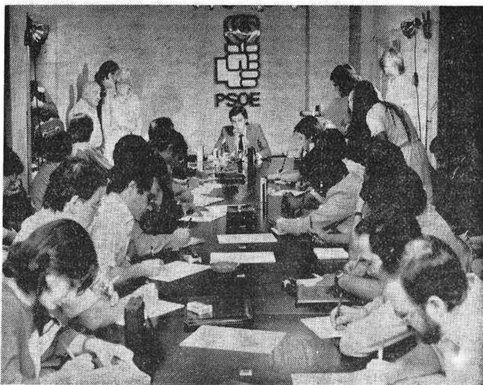
“El presidente del Gobierno debe presentar al país, lo antes posible, y sin retrasar las sesiones parlamentarias, su nueva alternativa programática, y entonces el Partido Socialista dará su opinión o respuesta al respecto”, ha manifestado el secretario general del PSOE, Felipe González, en una conferencia de Prensa convocada para informar sobre el contenido de la reunión de la Ejecutiva Federal del Partido y cuyo único punto del orden del día fue “La actual situación política”. En la foto, un momento de la reunión de los informadores con el líder socialista.

El Gobierno debe presentar cuanto antes su nueva alternativa programática