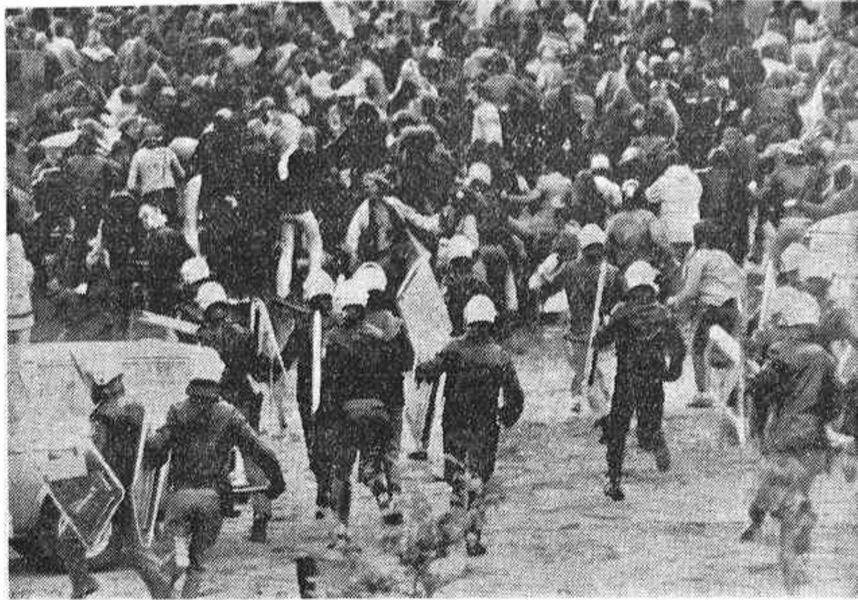
HAMBURGO, 26 (Efe). — Ciento dos policías y cuatro manifestantes heridos, uno de ellos muy grave, es el balance de la jornada de violencia vivida el lunes en Hamburgo cuando miles de manifestantes trataron de boicotear un acto protagonizado por el candidato conservador a la cancillería, Franz-Josef Strauss.

El herido de gravedad es un carpintero de 16 años que cayó a la vía del metro y fue atropellado por un tren mientras las fuerzas del orden empujaban a los manifestantes hacia el interior de la estación del suburbano.