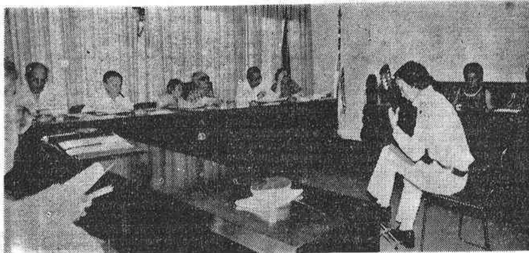
Un momento de las pruebas de preselección

Comenzó ayer el Certamen Internacional de Guitarra "Francisco Tárrega", en Benicasim, que este año llegó a su XIV edición, y en el que se inscribieron 28 participantes, de los que solamente 14, superaron la preselección.