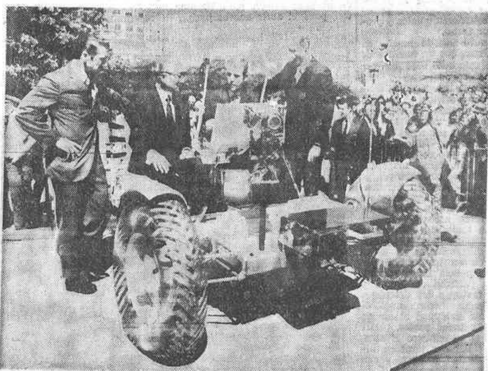
Una copia del «Rover» utilizado recientemente en la exploración de la Luna, ha sido expuesto en las Naciones Unidas...