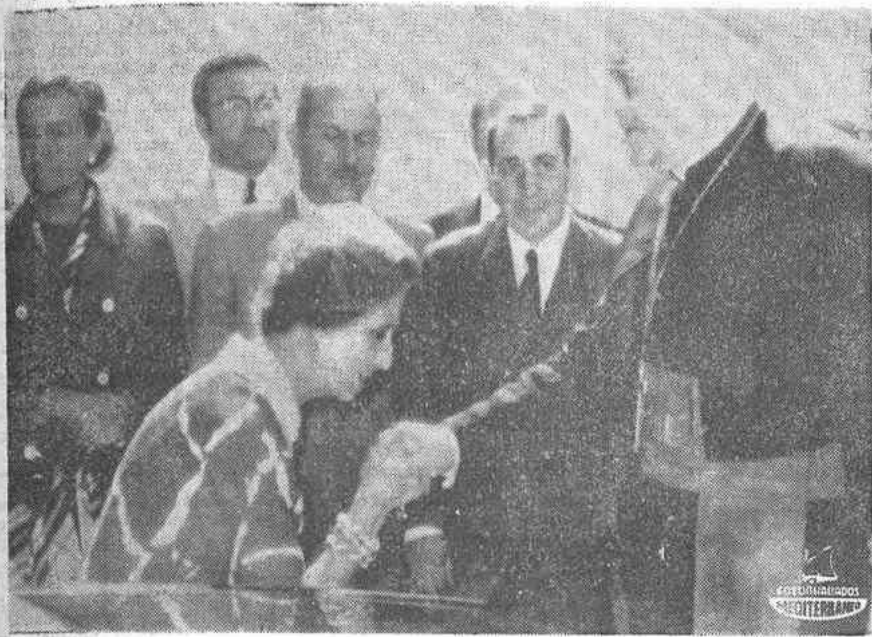
LA CORUÑA. — Dña. Carmen Polo de Franco presidió la inauguración de la Residencia para Matrimonios y personas de edad avanzada «Padra Rubinos», siendo recibida por el Cardenal Arzobispo de Santiago de Compostela, D. Fernando Quiroga Palacios.