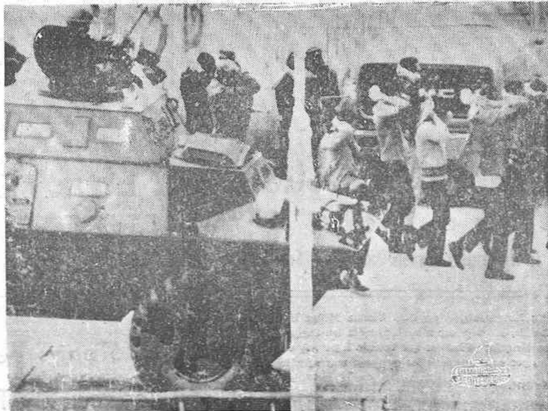
LA PAZ. — Soldados bolivianos vigilan, armados, la Universidad de San Andrés, uno de los últimos reducidos de resistencia en defensa del Gobierno del general Torres. Unos 120 estudiantes han sido detenidos.