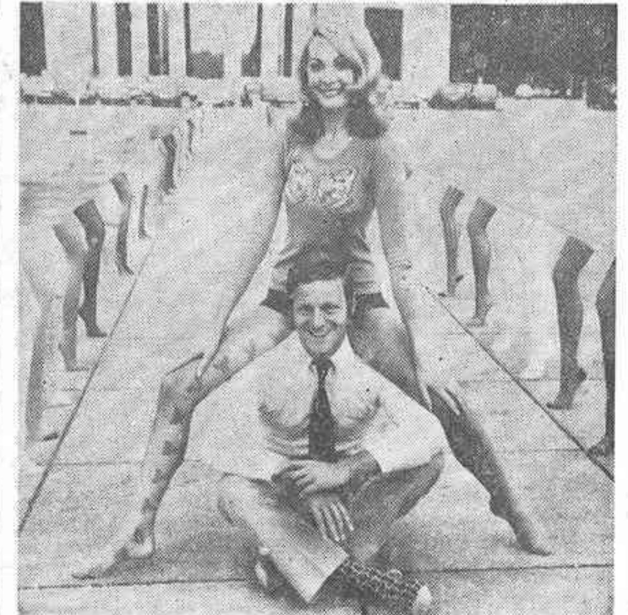
Los comerciantes alemanes han organizado unas semanas de exhibición de medias y calcetines...