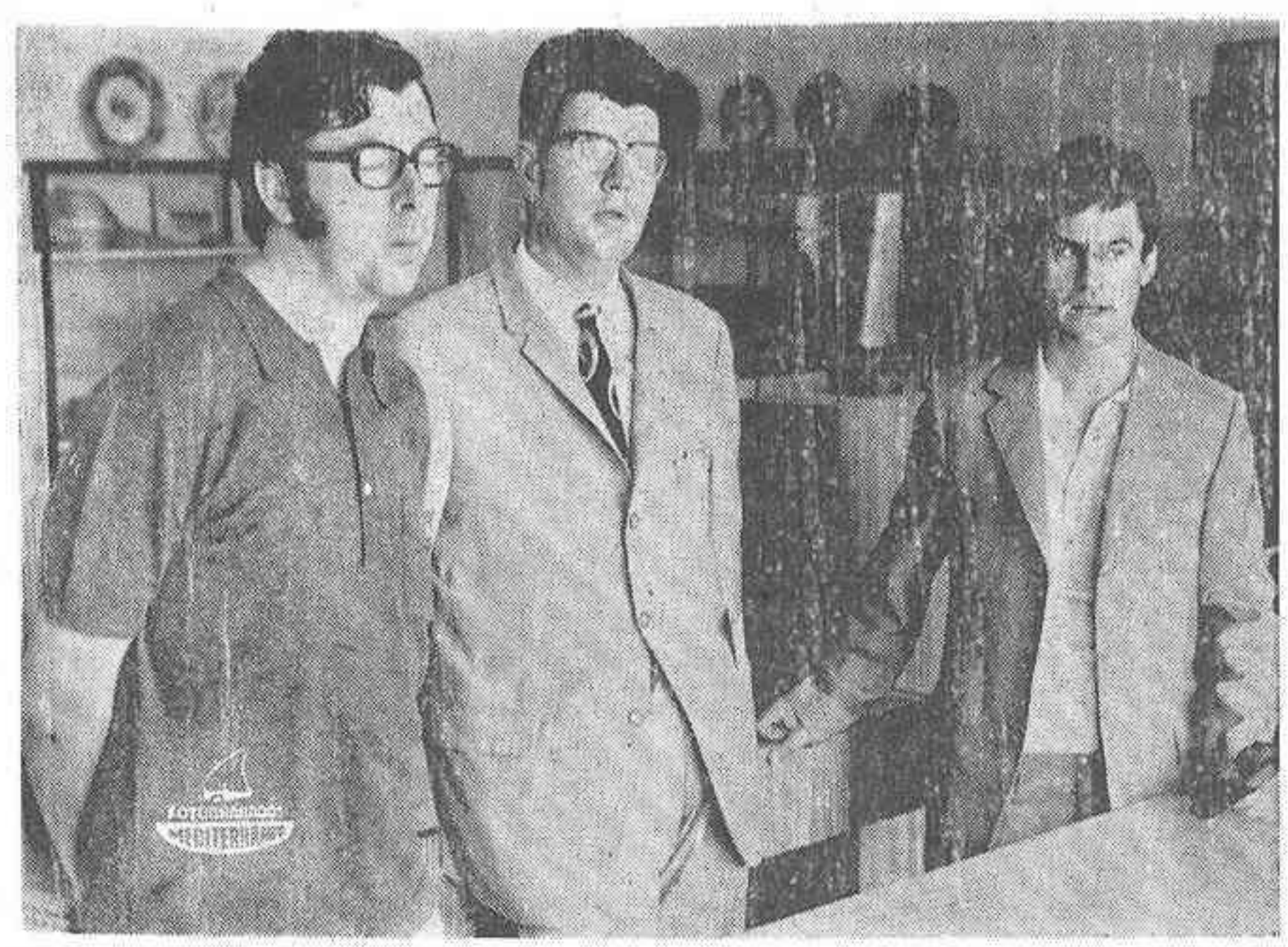
El Jurado, deliberando.

Se ha efectuado una rigurosa selección de las obras recibidas que optaban a los premios del Primer Concurso Nacional de Pintura. Fueron 128 cuadros los llegados en el plazo reglamentario. Una buena parte procedente de Valencia y su región; una magnífica aportación de Zaragoza de 13 óleos y el resto de variado origen, principalmente cataluña.