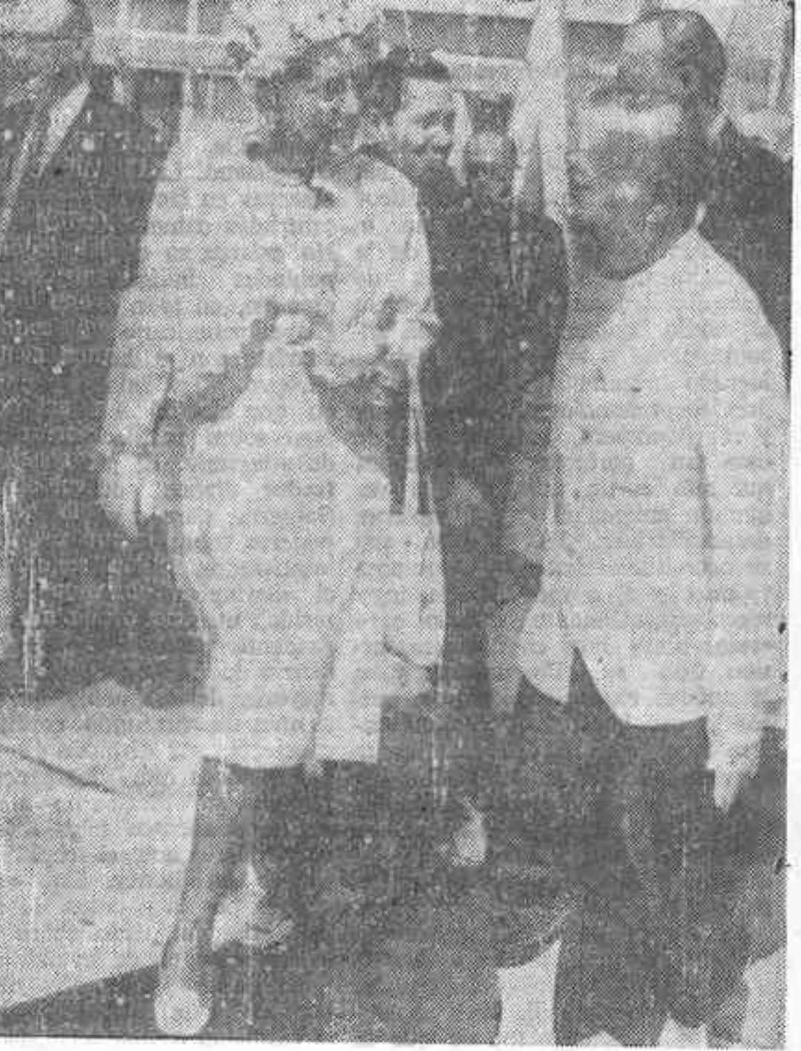
BANGKOK (Thailandia). - El príncipe Dhani Niwat representando a los reyes de Thailandia, despiden a la reina Juliana de Holanda y al príncipe Bernardo (a la derecha al fondo parcialmente oculto) cuando a real pareja abandona el país para dirigirse a la antigua colonia holandesa indonesia.