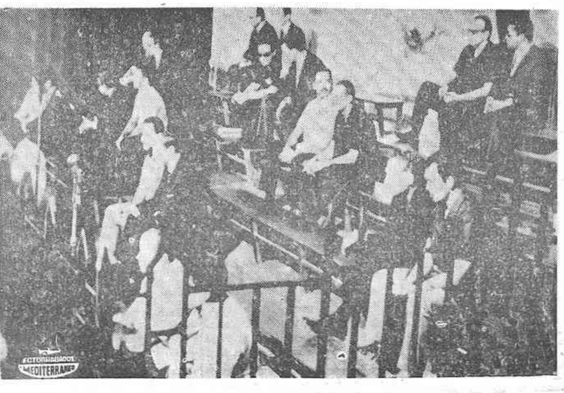
EL CAIRO. — Los 91 acusados de alta traición por su participación en el fracasado complot contra el presidente Anwar el Suddath, se sientan, uno a uno, en el banquillo...