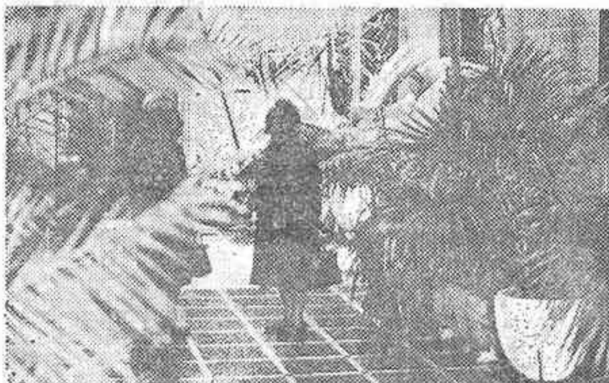
Por ejemplo en esta Residencia de Ancianos creada por las Cajas de Ahorros, con la colaboración de Usted, nuestros mayores gozan de una nueva vida tranquila, perfectamente atendidos.

Vaya donde vaya, Usted puede disponer de su dinero sin llevarlo consigo. Si antes de salir de viaje pide en su Caja la tarjeta de impositor, puede retirar con ella la cantidad que precise en cualquier lugar. Sin rellenar impresos. Sin consultas. Siempre habrá cerca una de las 5.500 Oficinas de las Cajas de Ahorros. Y en todas encontrará este servicio • Las Cajas de Ahorros Confederadas se distinguen fácilmente. Porque ofrecen: servicio de intercambio, transferencias, domiciliación de pagos, cheques de viaje, cambio de divisas, etc., en sus 5.500 Oficinas destinadas sólo a servicios financieros • Por este emblema • Porque su Consejo de Administración trabaja desinteresadamente. Gratis. Y no tienen accionistas. Entonces sus beneficios no van a bolsillos particulares, sino a centros de investigación, clínicas, bibliotecas, premios literarios, campos deportivos, restauraciones artísticas, ... (4.000 millones se destinaron a estas obras el año pasado).