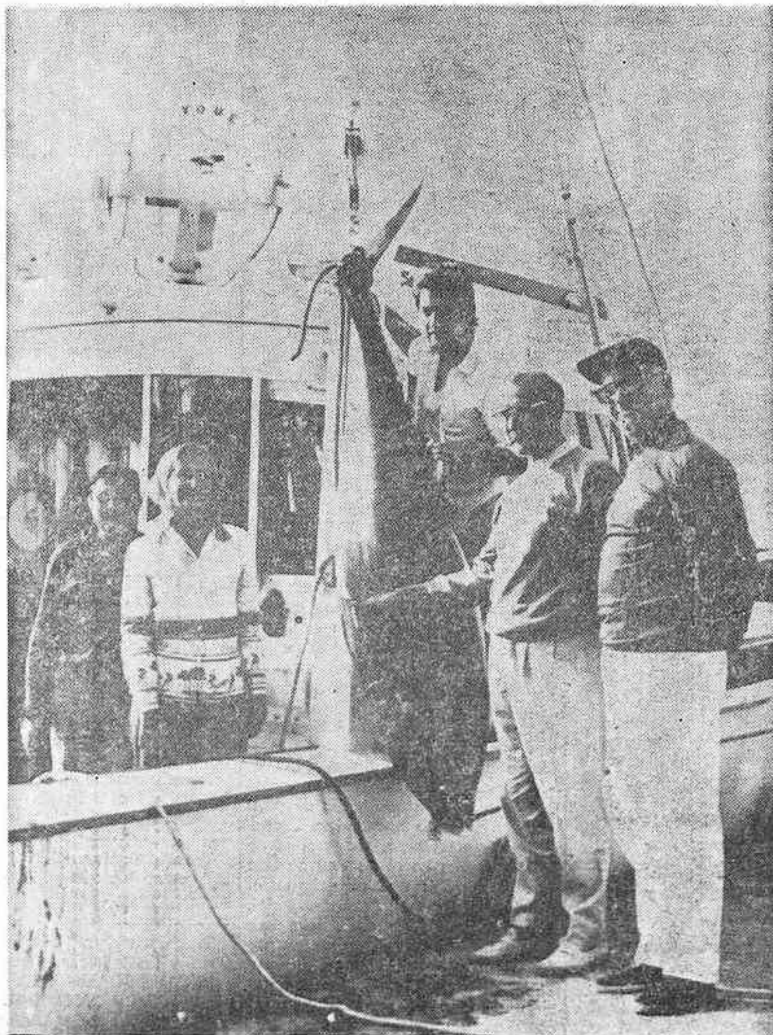
TARRAGONA. — El Ministro de Hacienda de Bélgica, profesor André Vlerick, tripulando el yate «Yque», ha pescado frente a las costas de Torredembarra un autún gigante de 180 kilos de peso. En la captura también intervinieron la esposa del Sr. Vlerick y el hijo del propietario del yate. — (Foto CIFRA GRAFICA)