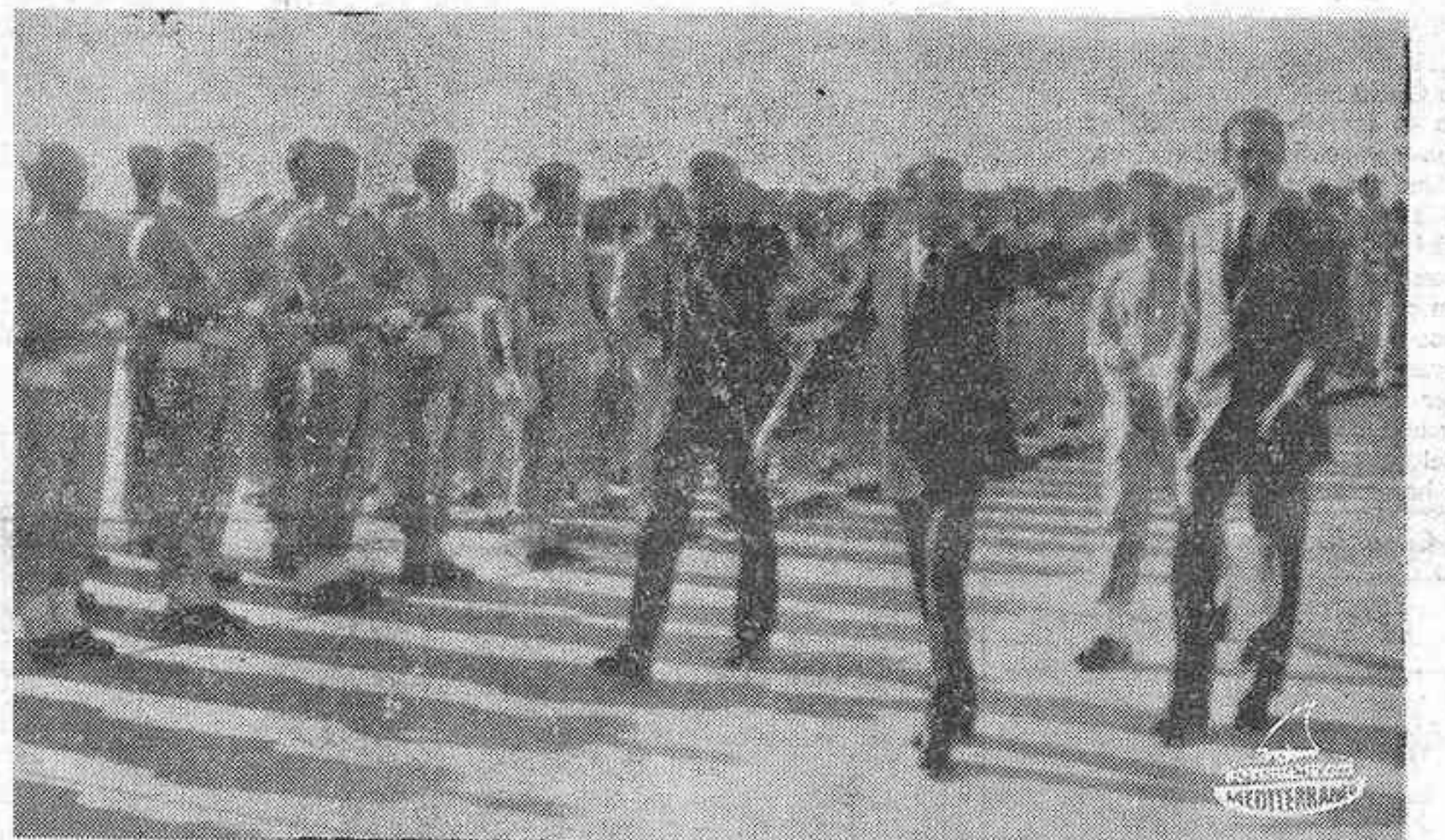
RABAT. — El Rey Hassan II corresponde a los aplausos de la multitud que le esperaba a su regreso de París, tras haber terminado felizmente su viaje después que el avión real fue ametrallado por uno de los cazas de escolta.

«El avión de Su Majestad —continuó Benhima pasando a contar los acontecimientos desde su comienzo— aterrizó a las 14'35 del miércoles día 16 y el General Ufkir, que le esperaba con otras per-