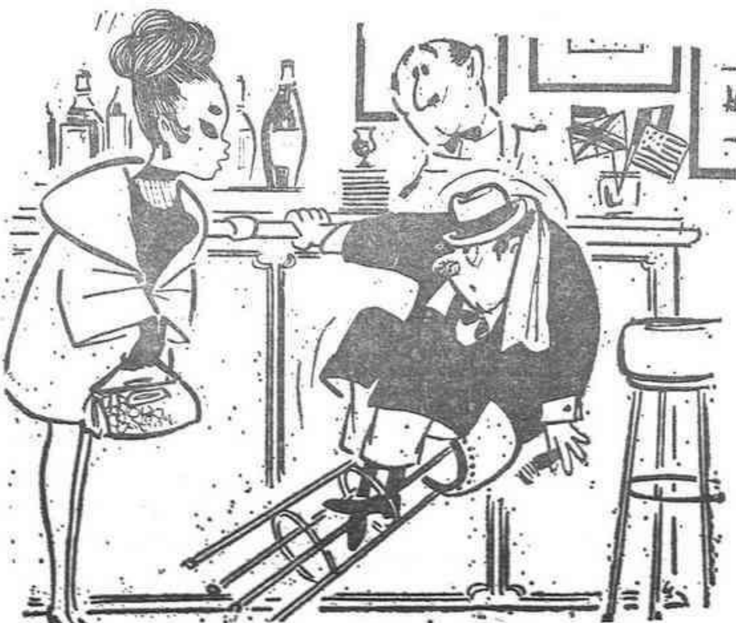
—Llevas mucho tiempo esperando, Max?.