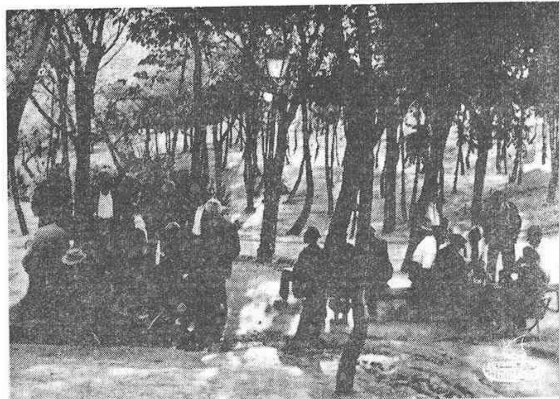
Uno de los problemas más grandes cuando llega la jubilación es el de la ocupación...

L A gran esperanza de los ancianos españoles tiene su fundamento en el Orden Ministerial del Ministerio de Trabajo de 19 de marzo de 1970, que creó el Servicio Social de Asistencia a los Ancianos, dependiente de la Dirección General de Seguridad Social y como un servicio a sus pensionistas. Desde el 1 de julio de este mismo año el Servicio comenzó su funcionamiento administrativo y hasta hoy tiene ya en su haber la creación de varios Hogares, como el de Manzanares y el de La Coruña, y proyectos que se harán realidad en breve plazo. El Servicio plantea su actividad en dos vertientes: la acción directa, por la que él mismo lleva a cabo una serie de realizaciones, y la acción concertada, por la que facilita a otros organismos —Diputaciones Provinciales, Ayuntamientos, Cáritas y fundaciones diversas— asesoramiento técnico y préstamos a largo plazo para que lleven a cabo sus planes de ayuda a los ancianos. Los planes de acción concertada estaban previstos para una segunda fase; pero ha sido tal la acogida de su iniciativa, que ya ha comenzado a funcionar en los primeros meses de ponerse en marcha la fase primera.