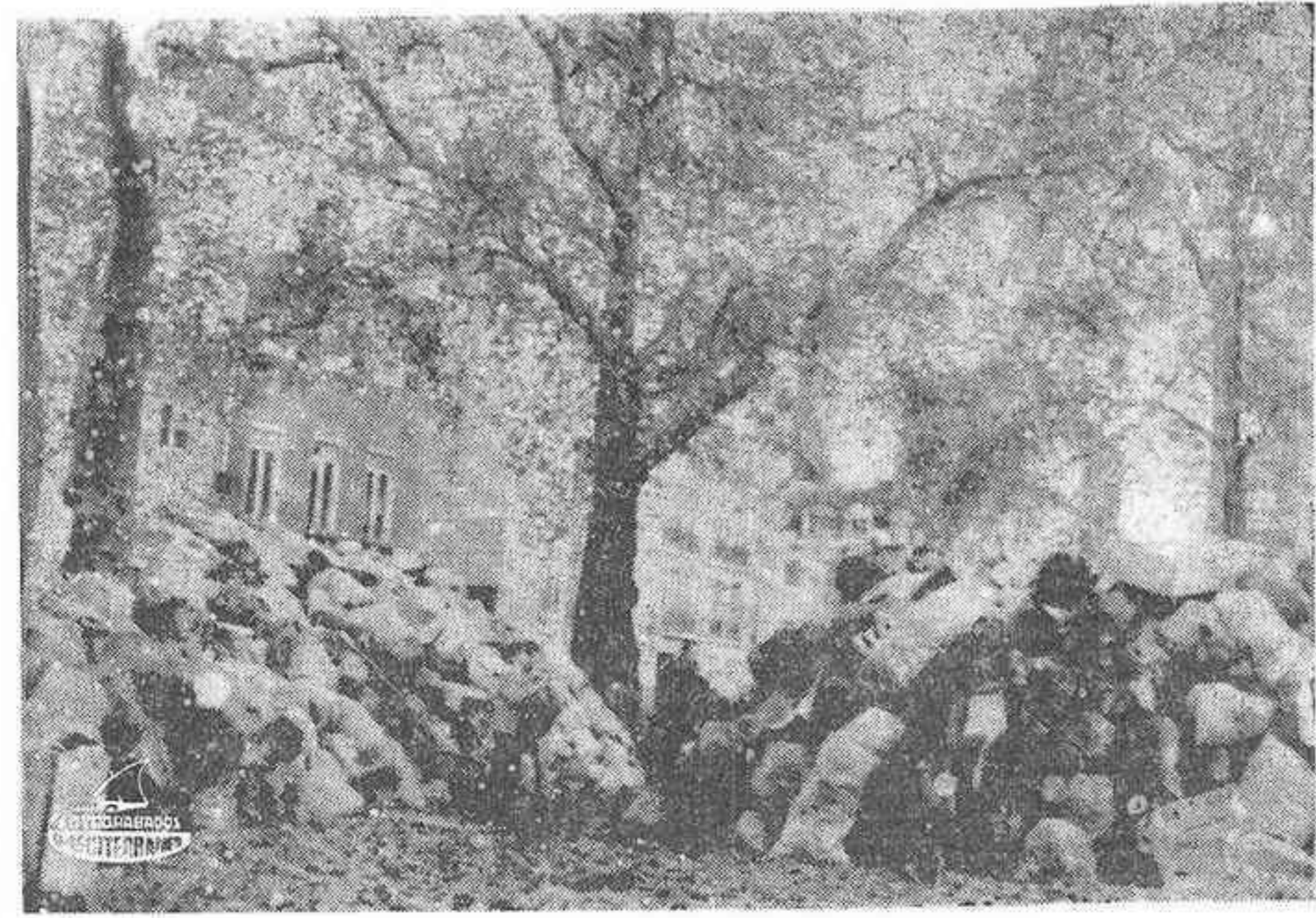
LONDRES. — Basura, la mayoría contenida en sacos de plásticos, se apila en la Berkeley Square, mientras los trabajadores municipales ingleses continúan su huelga. Los empleados piden una subida semanal de unas 500 pesetas.

LONDRES, 5. (Efe). — La huelga de empleados municipales de Gran Bretaña terminó esta noche al aceptar los líderes sindicales un aumento semanal de dos libras diez chelines (6 dólares) para 290.000 empleados.