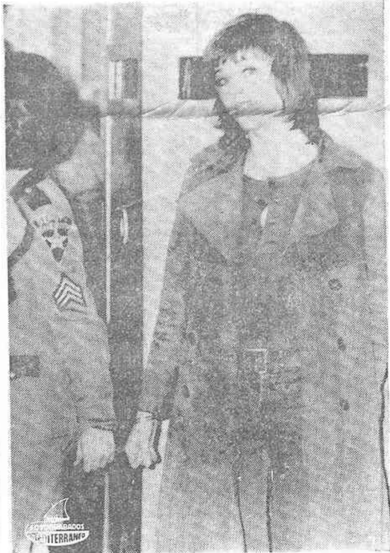
CLEVELAND (Ohio). — La actriz Jane Fonda aparece aquí después de haber sido interrogada en la Corte Federal acusada de haber hecho frente a un agente de aduanas en el aeropuerto de Cleveland por contrabando de unas píldoras sin identificar.