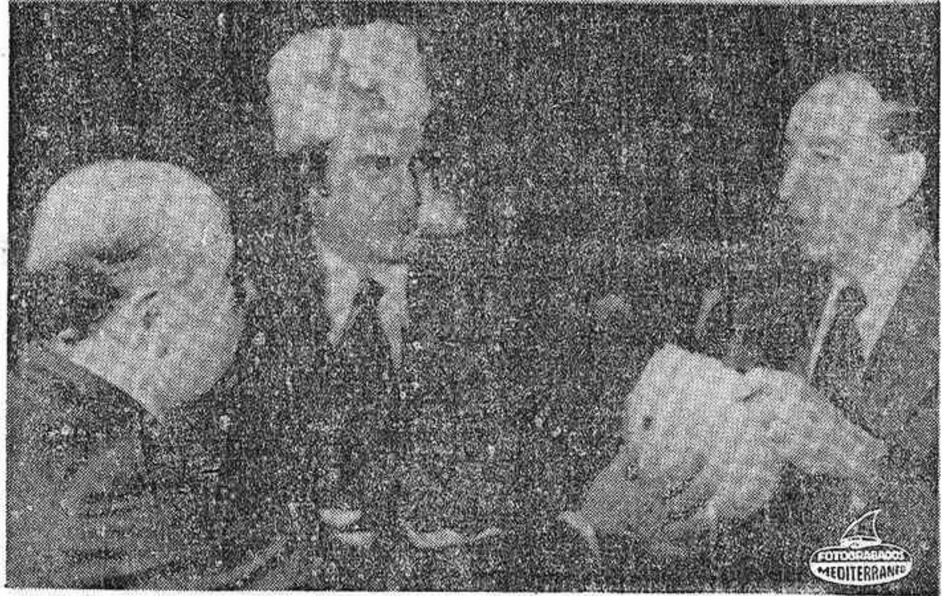
MONTREAL (Canadá). — En la parte superior de la foto, grupos de manifestantes portan carteles y pancartas en tanto prorrumpían en gritos contra el Gobierno iraní, ante la Embajada del Irán. Abajo, el jefe del Gobierno iraní, Jamir Abbas Hoveida (izquierda), en el interior de la Embajada, ofrece sombreros al Ministro de Comercio e Industria de Quebec, Guy Saint Pierre (centro) y al Ministro Federal de Sanidad y Bienestar, Marc Lalonde. Los ministros de ambos países han iniciado conversaciones en torno a un propuesto acuerdo comercial entre sus respectivos países.