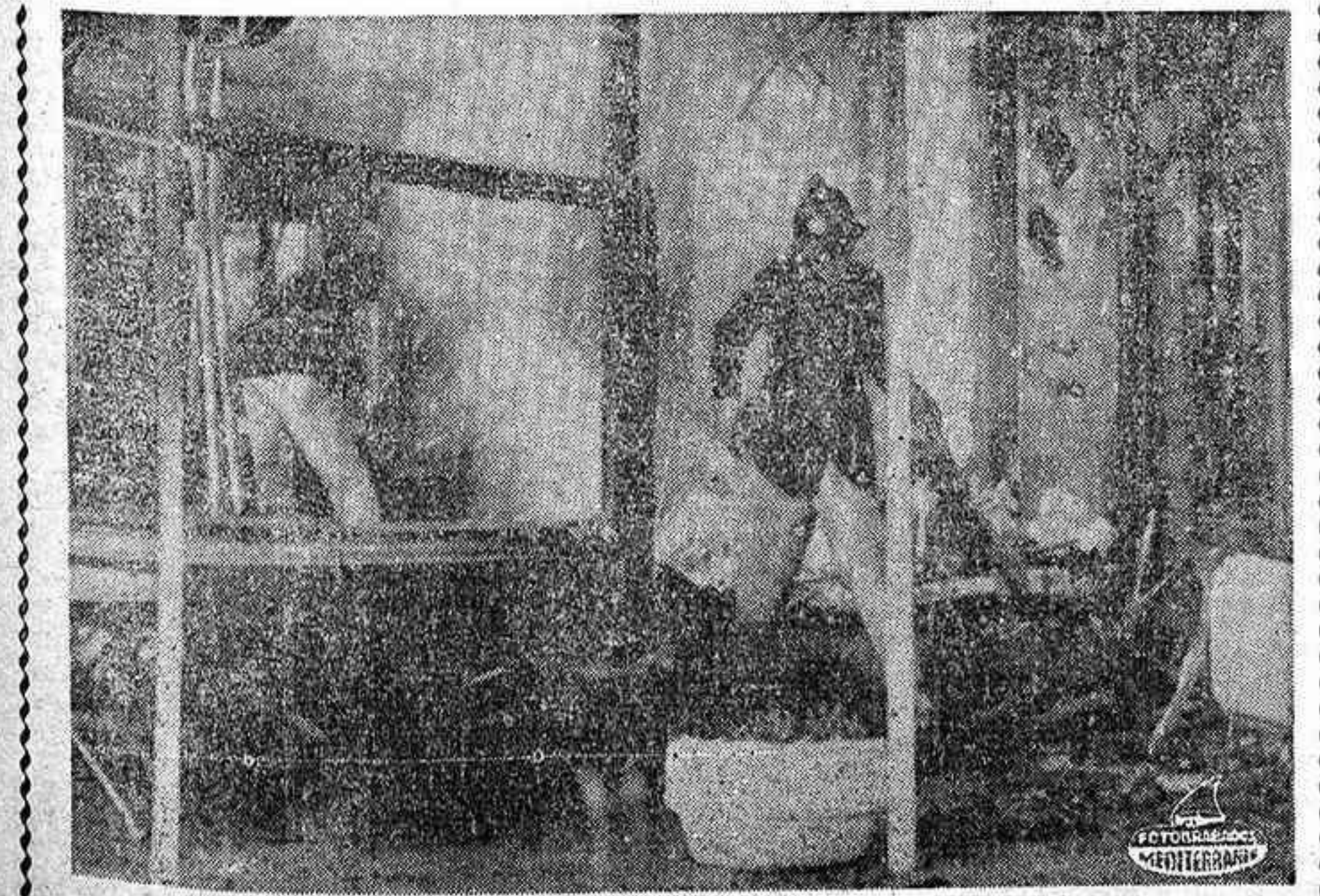
NOTTINGHAM (Inglaterra). Los bomberos durante los trabajos de extinción de un incendio registrado en una residencia de ancianos. Hubo que lamentar 18 muertos. El fuego se produjo en forma rápida en tanto dormían 49 residentes. La policía ha declarado que la mayoría de las víctimas eran inválidos que rebasaban los 80 años de edad.