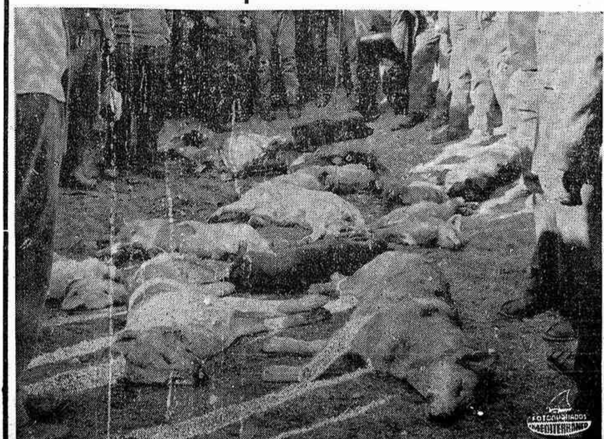
SORIA. — Cinco perros salvajes y tres zorras fueron muertos en el curso de una cacería organizada por aficionados sorianos para exterminar a las fieras que últimamente han cobrado más de cuatrocientas víctimas entre las reses lanares de esta provincia. La batida, llevada a cabo por cuarenta aficionados, se efectuó en el monte conocido por Valonsadero. En la foto, los cazadores junto a algunas de las piezas cobradas. — (Foto Cifra Gráfica)