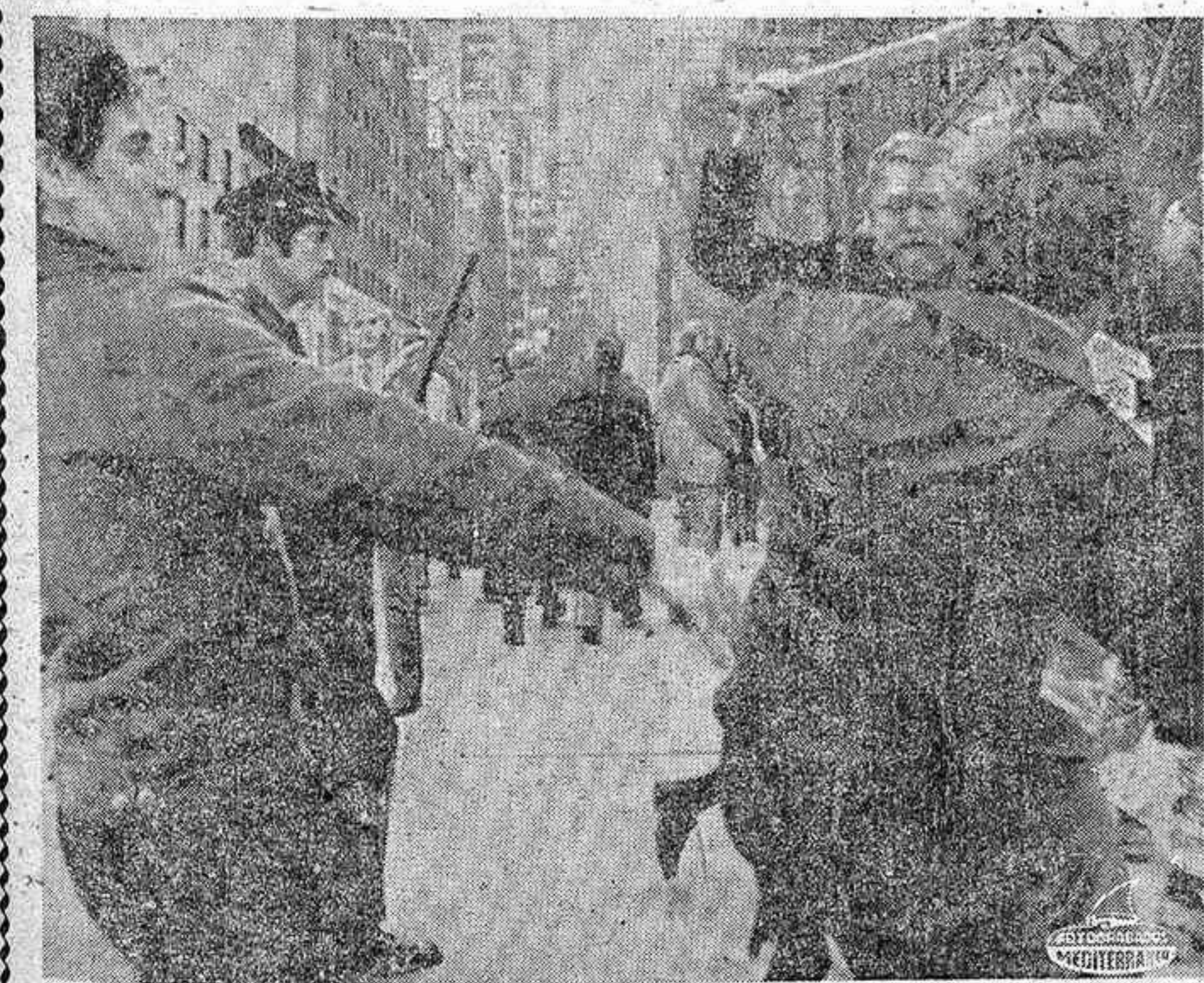
NUEVA YORK. — Con la porra en alto, un agente de la policía (derecha), trata de poner fin a un choque entre simpatizantes rivales, árabes y judíos, que se manifestaron ante la sede de las Naciones Unidas, en favor y en contra de la presencia de Yasser Arafat, dirigente de la Organización de Liberación de Palestina, en la ONU.