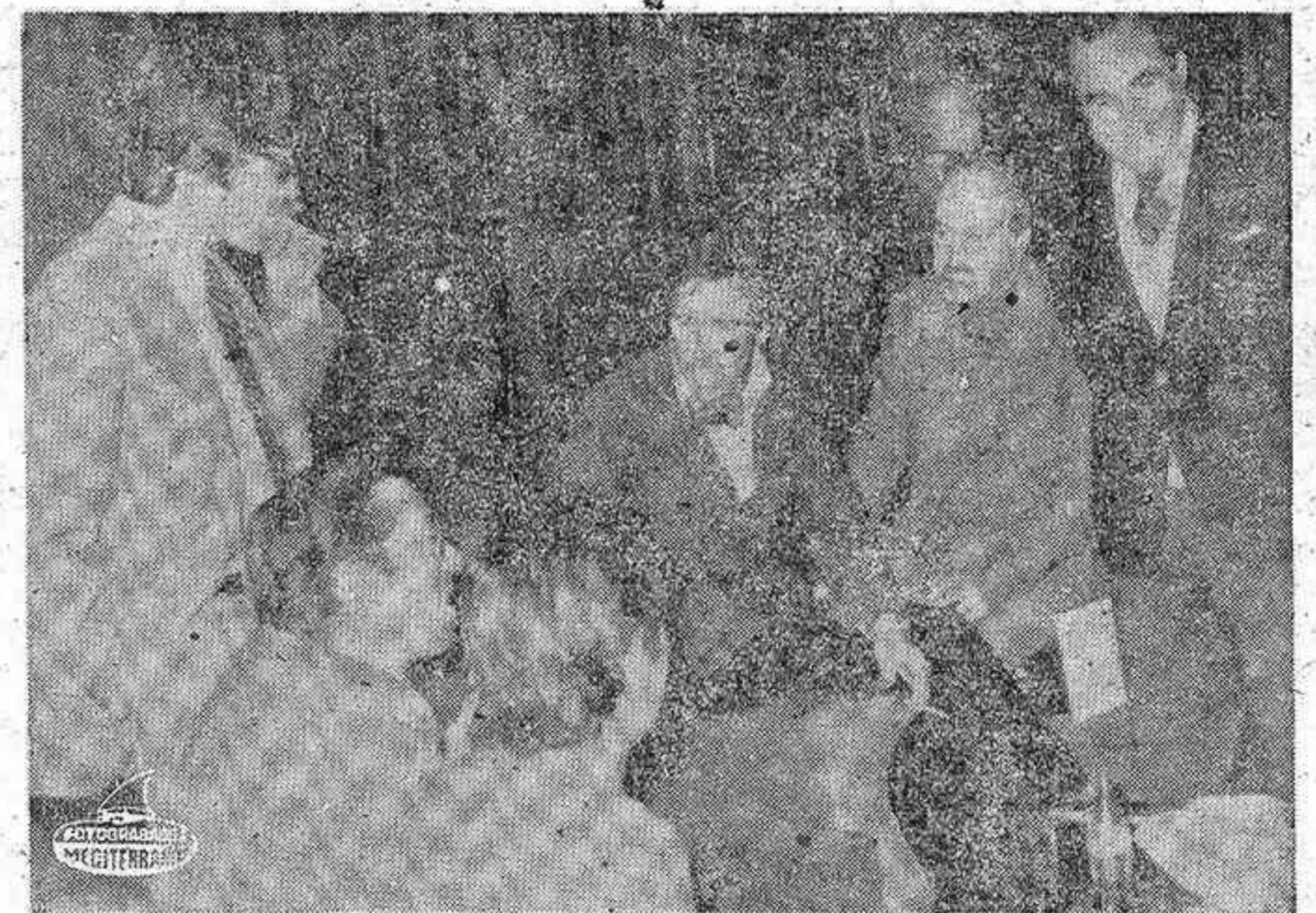
TARRAGONA. — Lord Snowdon, esposo de la Princesa Margarita de Inglaterra, durante la rueda de prensa celebrada en esta ciudad con motivo de su estancia en la misma para efectuar un reportaje fotográfico en una industria petroquímica de esta ciudad.