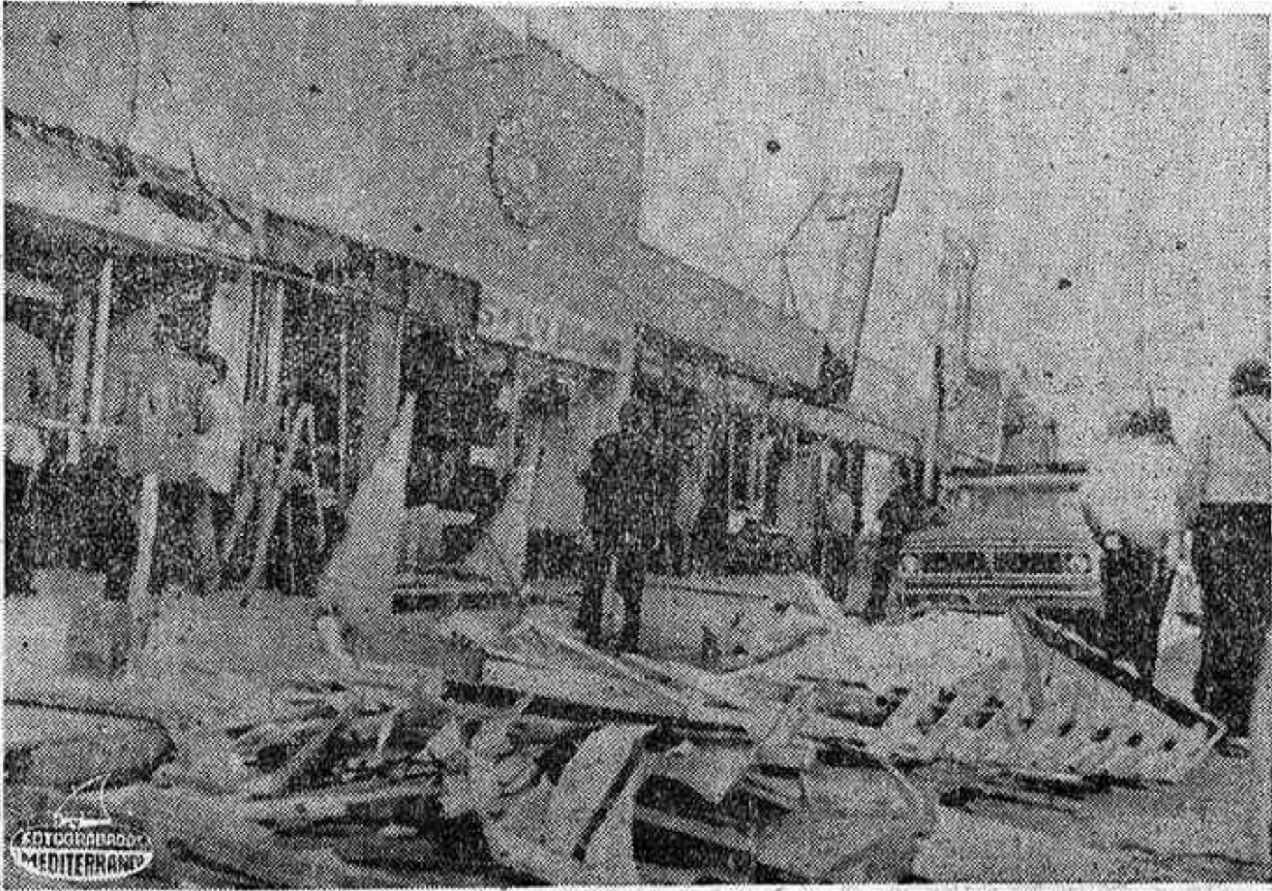
LOS ANGELES. — Una bomba fue arrojada contra una librería de la ONU en el distrito de Wilshire y según llamadas telefónicas a los medios informativos se alegó que el atentado estaba relacionado con la Organización de Liberación de Palestina. Las autoridades creen que puede tener relación con la intervención prevista en la ONU en Nueva York, del dirigente guerrillero palestino Yasser Arafat.