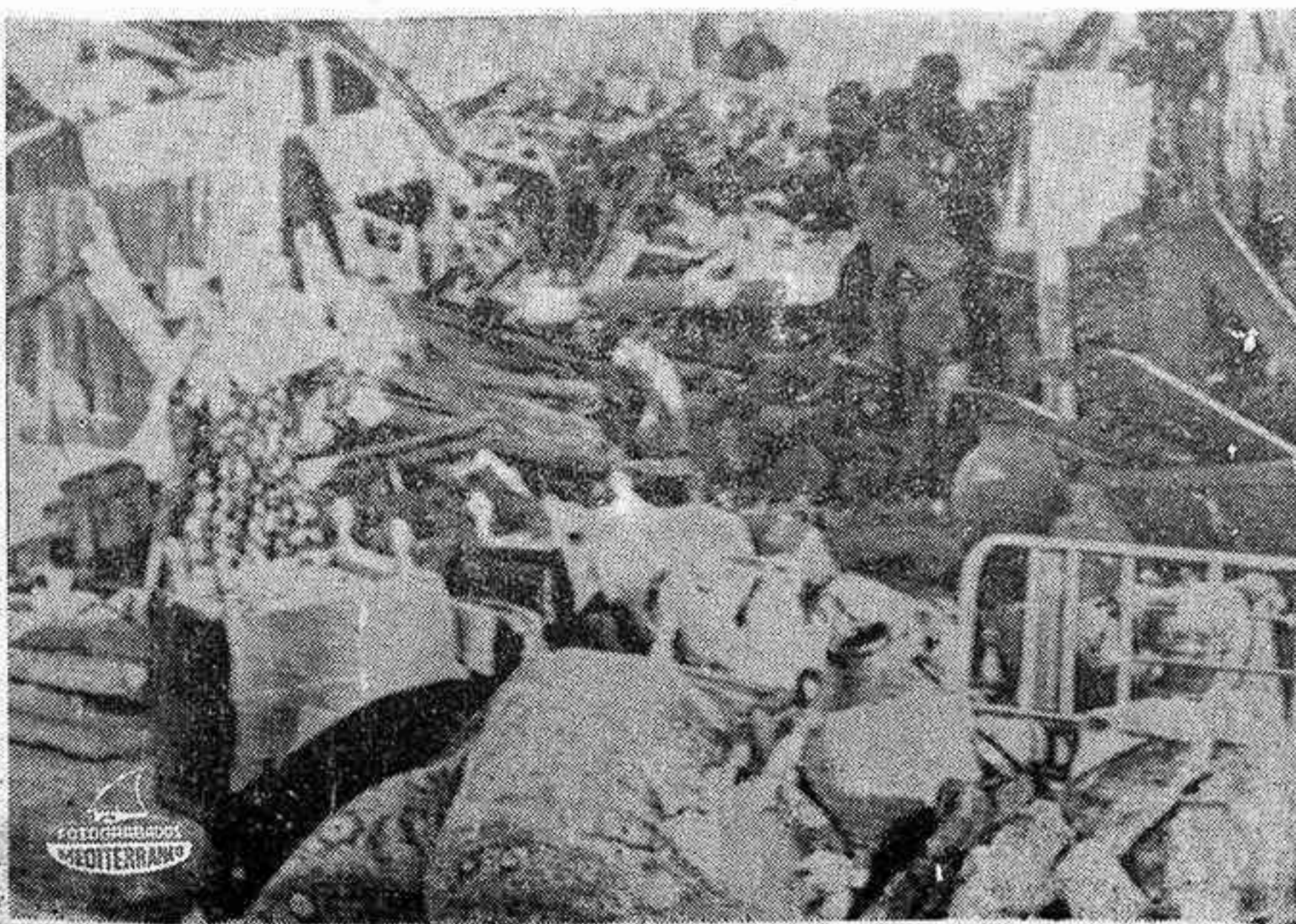
BINGHOL.— Un terremoto ha asolado esta zona de Turquía, causando cerca de mil muertos. La fotografía recoge un aspecto parcial de los daños sufridos.