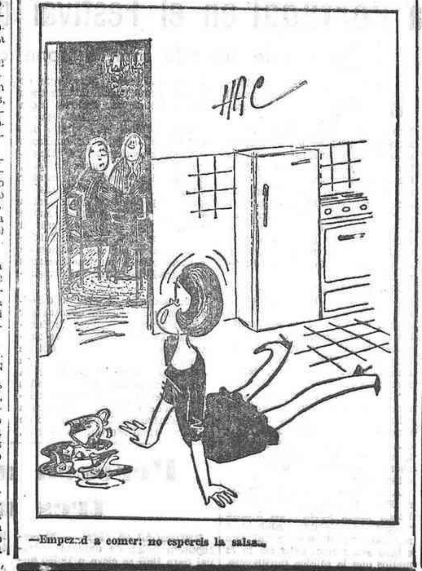
—Empieza a comer: no esperes la sala.

Otro avión USA obligado a dirigirse a Cuba Cuando realizaba el vuelo entre Atlanta-Miami NUEVA YORK, 25. (Efe).— Un avión DC-8 de la Eastern Airlines, que llevaba a cabo un vuelo entre Atlanta (Georgia) y Miami (Florida), ha sido secuestrado hoy y su piloto obligado a dirigirse a Cuba. El aparato que realizaba el vuelo 955 llevaba 53 pasajeros a bordo, más siete personas integrantes de la tripulación, de acuerdo con los primeros informes revelados en Miami.