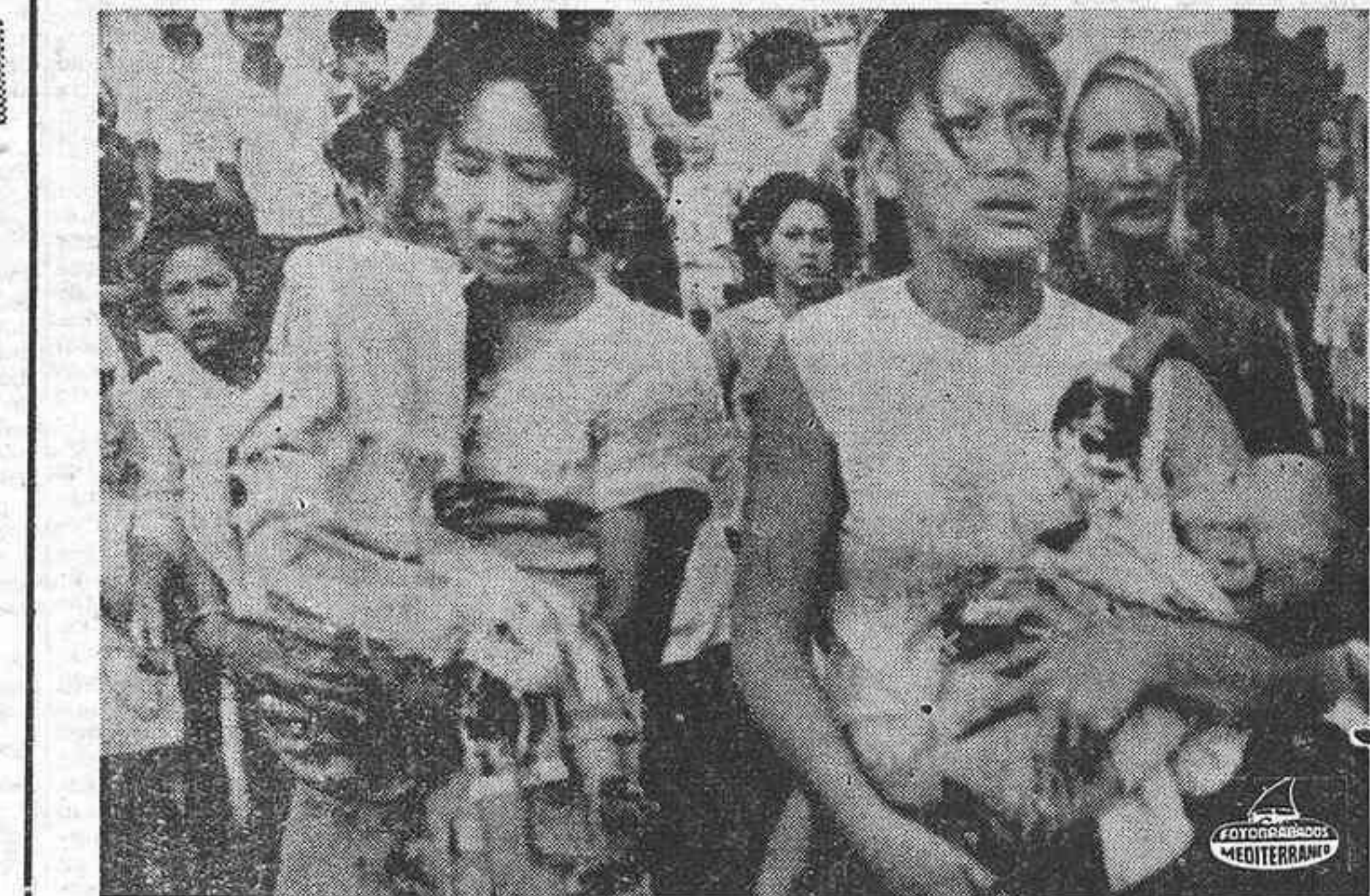
SAIGON. — Dos madres vietnamitas sostienen a sus hijos heridos en sus brazos esperando una ambulancia, después del ataque con morteros y otros proyectiles hecho por los comunistas sobre Saigón. Cuatro personas han muerto.

Unos 19.000 obreros de los 46.000 de estas plantas, desafiaron a los jefes de sus sindicatos en cuanto a un nuevo convenio sobre sueldos y salarios y han permanecido en sus casas.