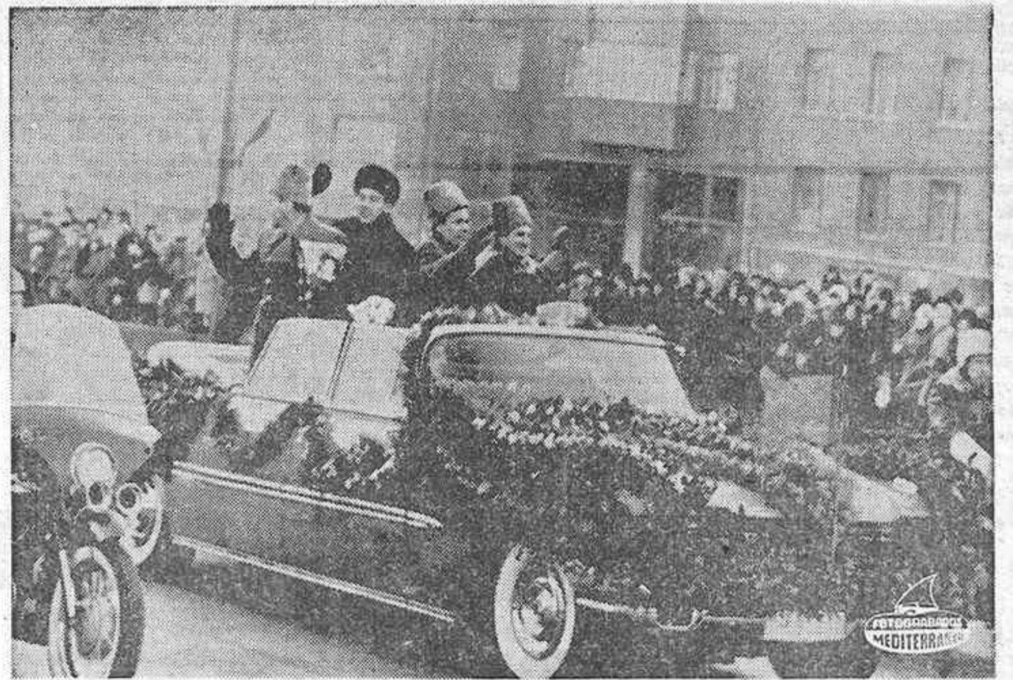
MOSCÚ. — Los moscovitas han recibido en triunfo a los astronautas de las naves Soyuz 4 y Soyuz 5. En la foto, el coche con los astronautas que saludan: Shatalov, Elyseev, Khrunov y Bolynov.

Se registraron dos heridos, siendo detenido el autor, que parece se trata de un enfermo mental