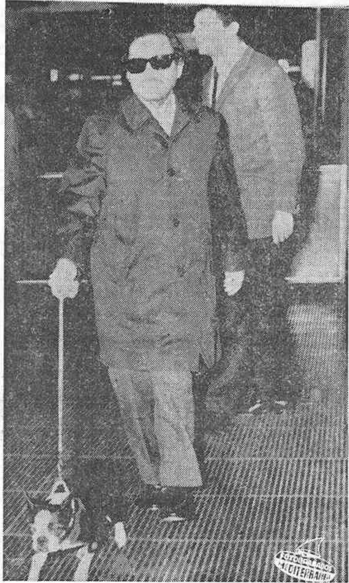
ROMA. — El famoso escritor norteamericano recientemente convertido al catolicismo, Tennessee Williams, acompañado por su perro, a su llegada el martes pasado a Roma.