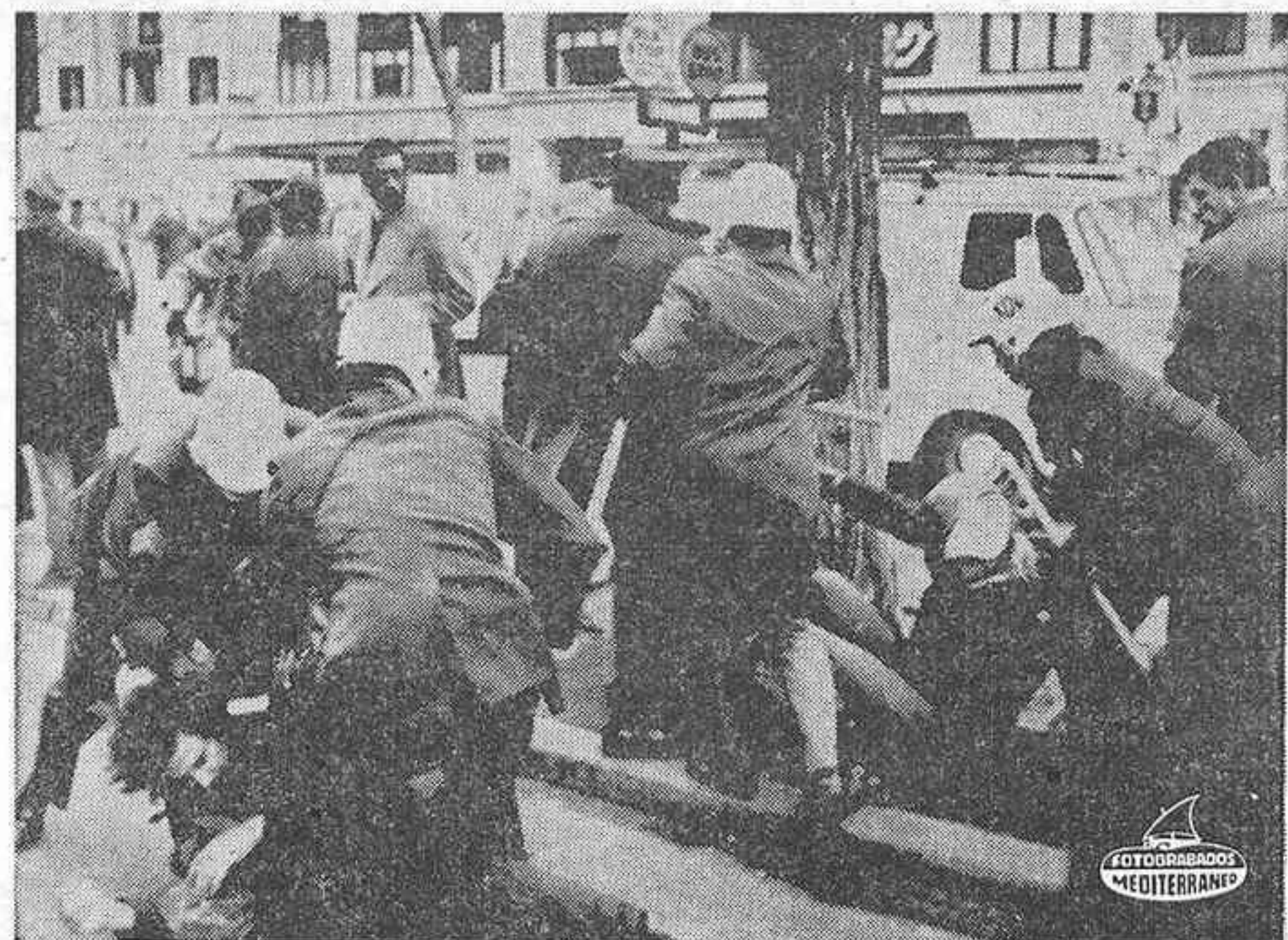
WASHINGTON. — La policía lucha con los manifestantes, a unos metros de la ruta que recorrerá el Presidente Nixon tras la toma de posesión. Más temprano, los manifestantes arrojaron piedras al paso de la comitiva presidencial.