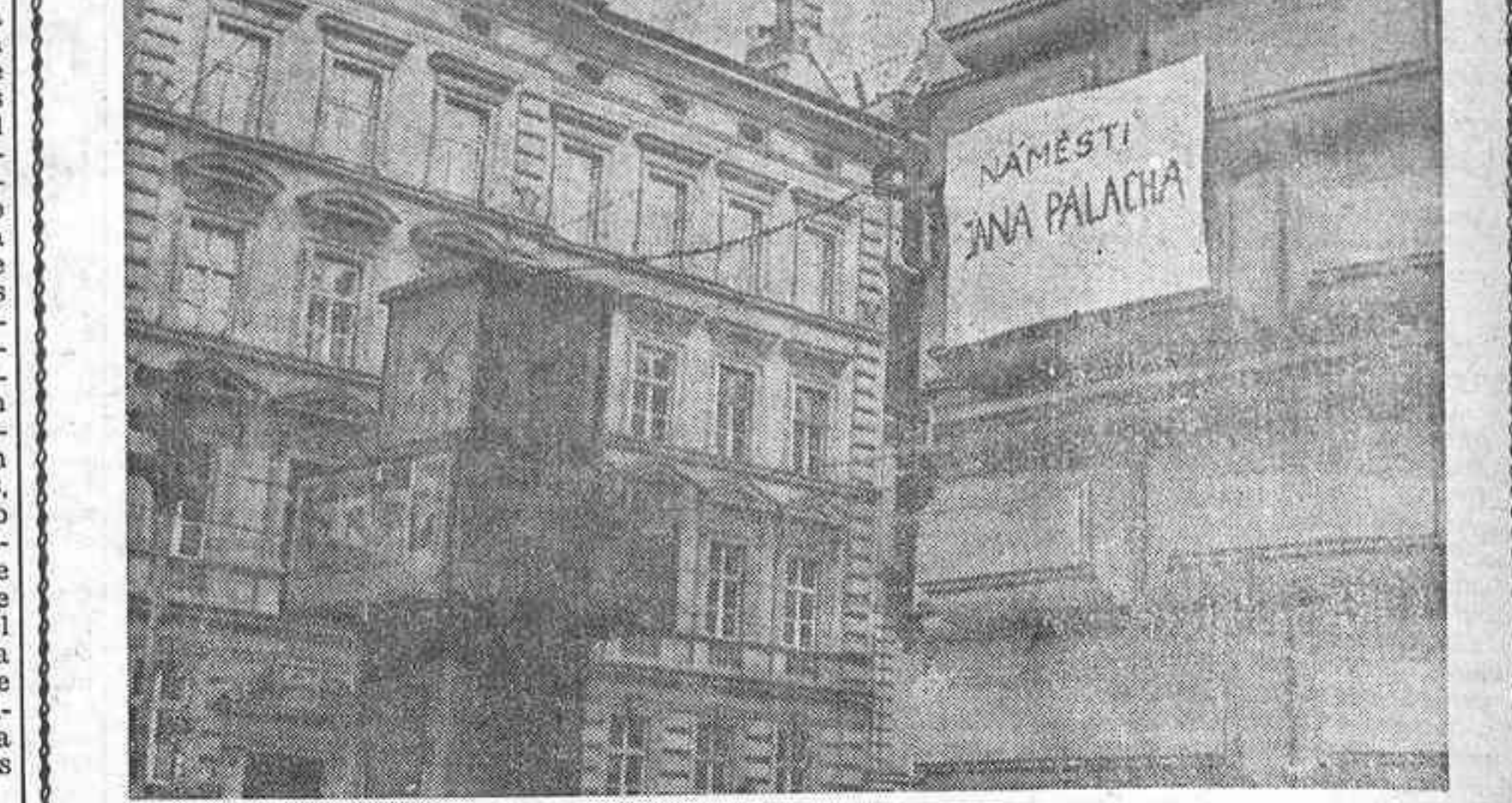
PRAGA. — Los estudiantes checoslovacos, sin aprobación oficial, han rebautizado la plaza que está frente a la Facultad de Filosofía de Praga, con el nombre de Jana Palach, el estudiante que se prendió fuego y se convirtió en "antorcha humana" en la plaza de San Wenceslao.

La manifestación de esta mañana, a la que se han sumado en masa durante el trayecto los alumnos de varios centros de enseñan-