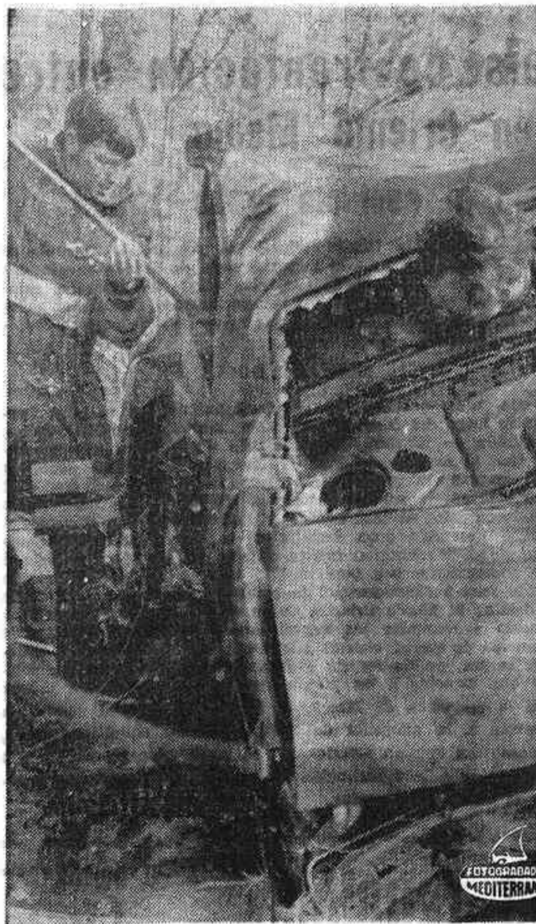
NEWBURYPORT (Massachusetts).— Con su cabeza empotrada en la ventanilla trasera, David Turnington, de 30 años, aguarda angustiadamente su rescate por un bombero que trata de abrir la puerta del automóvil con una barra. El coche, poco antes, había volcado sobre su techumbre tras haber recibido un inesperado y violento golpe con un trozo de roca desprendida. Turnington y dos ocupantes más resultaron con fracturas en las piernas.—(Telefoto UPI-CIFRA).