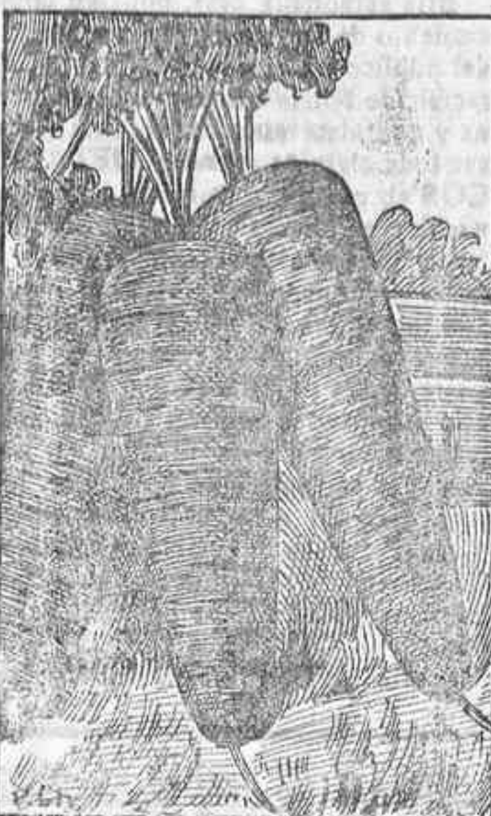
Zanahoria Medio larga

Méndez Núñez, No. 16.—Santa Cruz de Tenerife