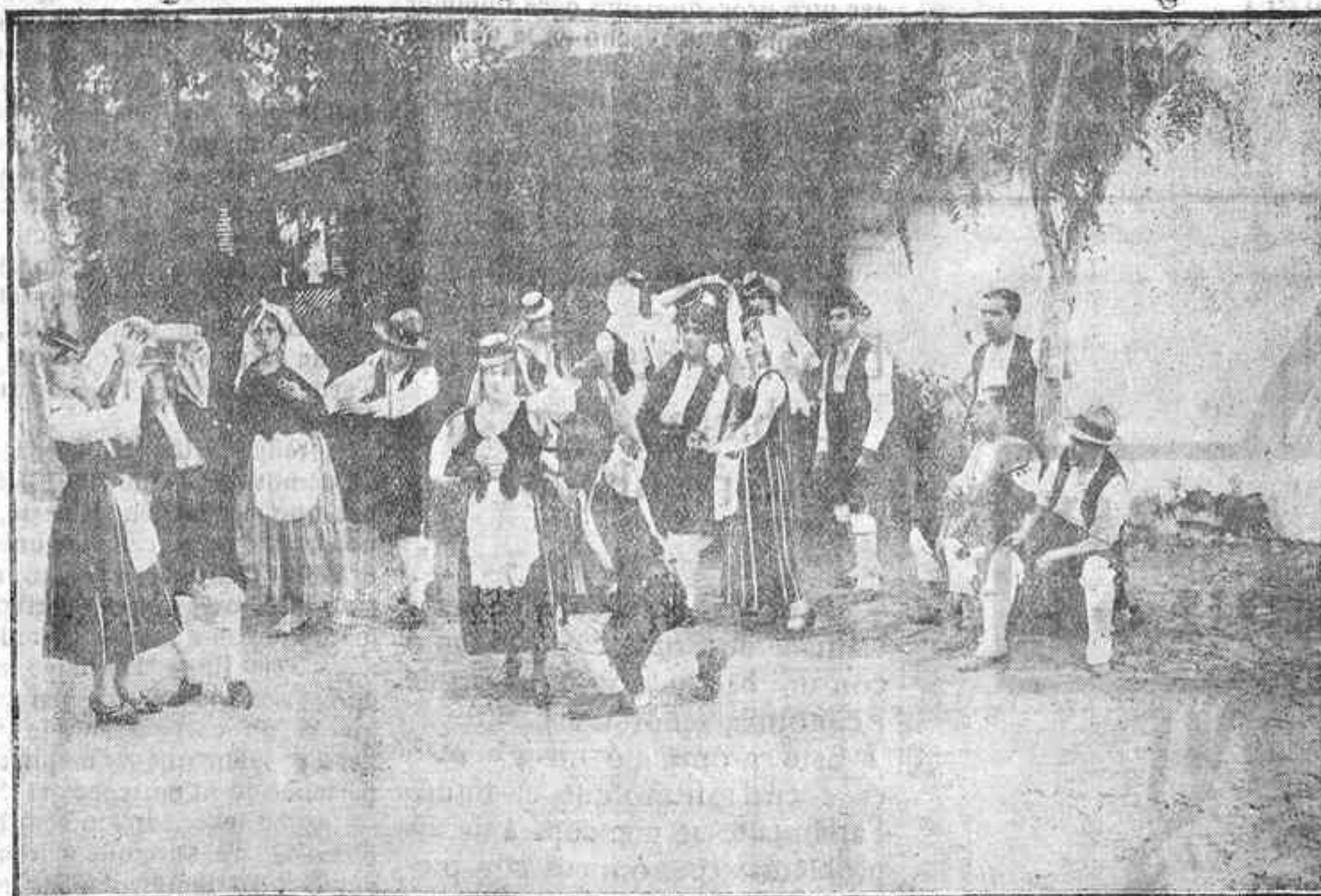
Uno de los grupos de bailadores que tomarán parte en la gran fiesta regional que se celebrará mañana a las 9 de la noche, en la Plaza de Toros, organizada por la Masa Coral de la Juventud Republicana.