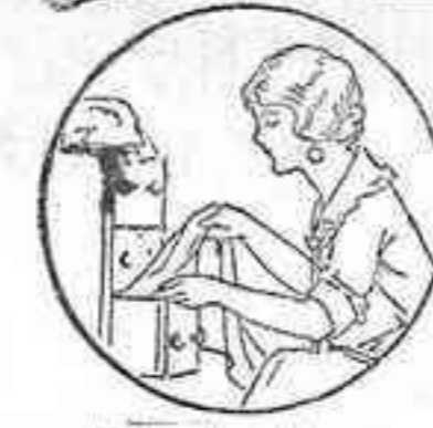
No deseches sus blusas o vestidos cuando pierdan su color original.

Horas de ensayo por el Jefe del Taller . . . . . De 9 a 1 y de 2 a 5 Horas de graduación por el Director científico. . . . . De 4 a 7 ALFONSO XIII, 56 — TELÉFONO 51