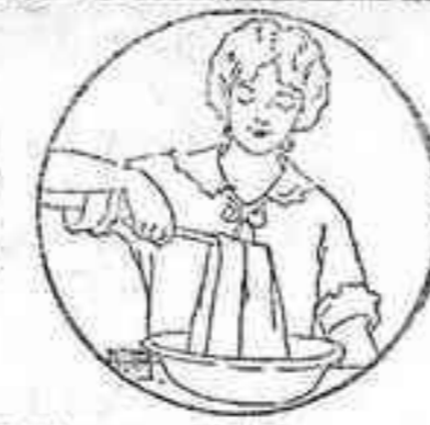
Tíñalos pronto y fácilmente con uno de los bellísimos tintes RIT.