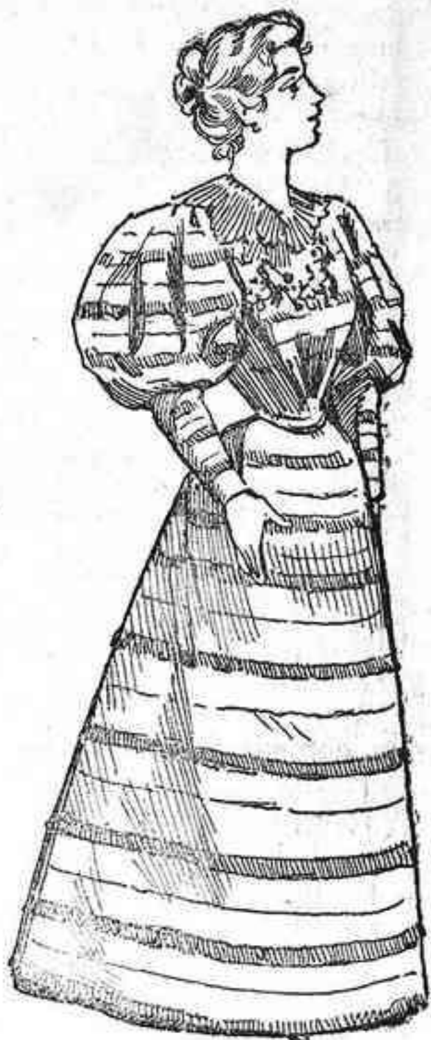
Toilette de casa

Hácese de lana oscura con rayas de seda claras. El cuerpo entra en la falda; drapéase en grandes pliegues a la cintura. Sobre el forro ajustado; guarnécese con un collete ó gorguera de muselina de seda, debajo del cual, sobre el pecho, se forma con cinta de terciopelo bordado una Paillette . La falda, forma campana, vá sesgada ligeramente en la cintura por delante, y montada a grandes pliegues por detrás. Las mangas de una sola pieza no llevan más que una costura. Son bouffantes hasta el codo y ajustadas desde éste a la muñeca. El cinturón es de paño.