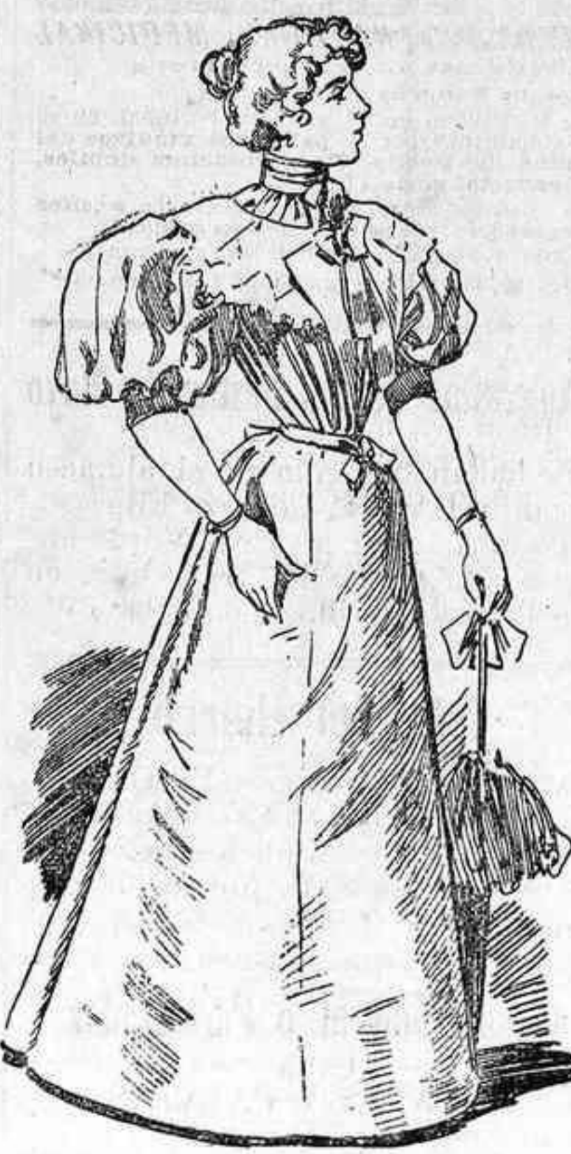
Traje de mañana

La falda forma campana se compone de diferentes paños, cortados los dos delanteros al hilo y los restantes al bias.