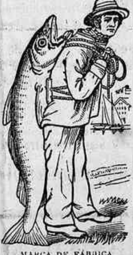
MANCA DE FÁBRICA