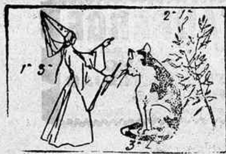
La solución, mañana.