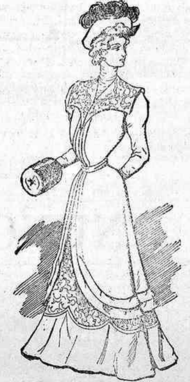
La falda adórnase con una alta banda de encaje, colocada sobre el bajo de paño, cuyo borde superior se corta en forma de guirnalda.