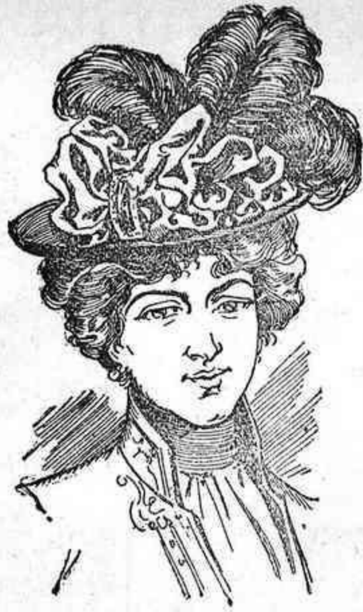
La ejecución no es complicada y el sombrero resulta verdaderamente «charmant» encantador.