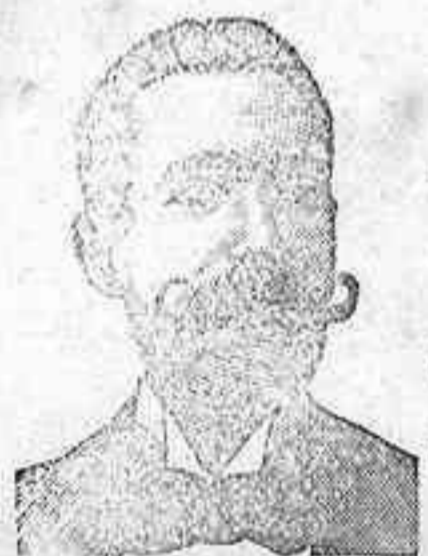
A. Salvati Costanzi Calle Diputación, n.º 435 Barcelona.

ó Inyección antivenérea y Roob antisifilítico COSTANZI