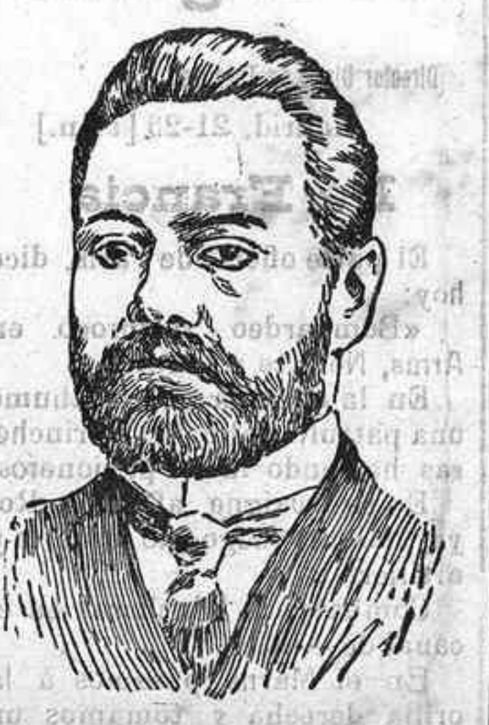
Gondchikow ministro de municiones de Rusia.