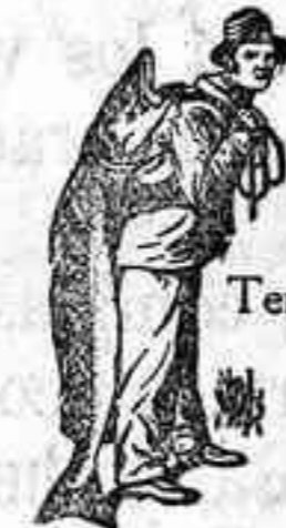
Obténase siempre la Emulsión con esta marca "El Pescador", marca del procedimiento Scott.

de aceite de hígado de bacalao é hipofosfitos de cal y sosa cuyas intensas propiedades nutritivas se derivan de su alta pureza y actividad de sus ingredientes y de la perfección de su elaboración.