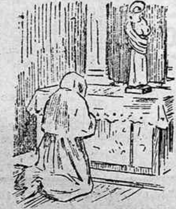
La solución, mañana.