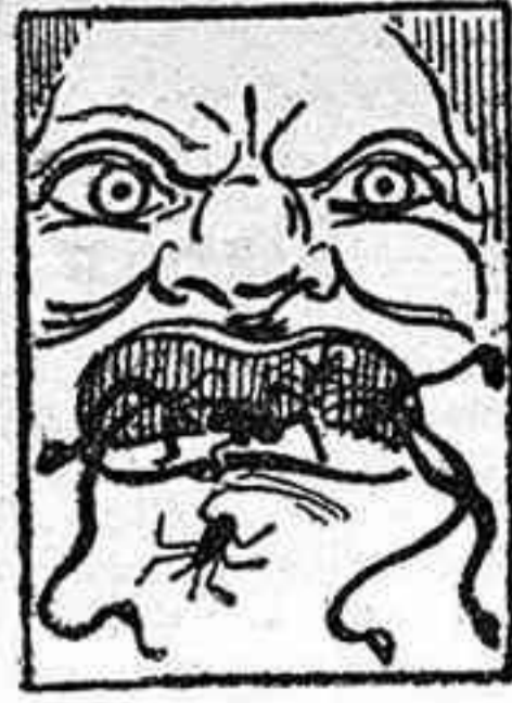
La solución, mañana.