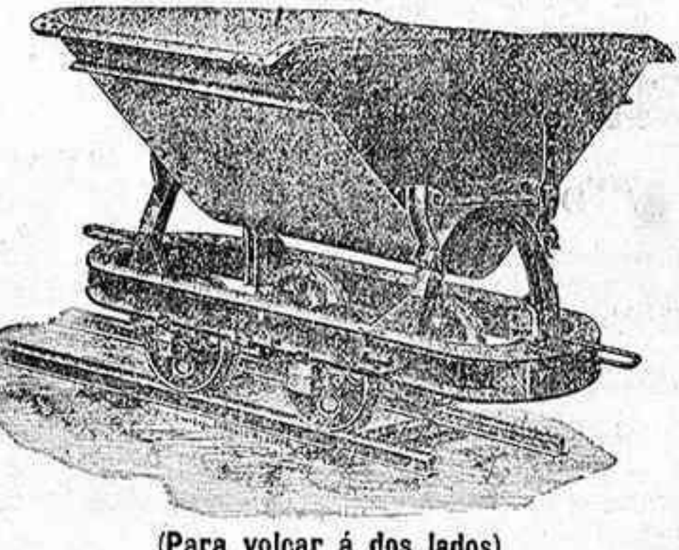
(Para volcar á dos lados)

Se emplean hoy en todas las galerías de Explotación de aguas trabajos de terrenos, plantíos de plátanos para la conducción del fruto etc., etc.