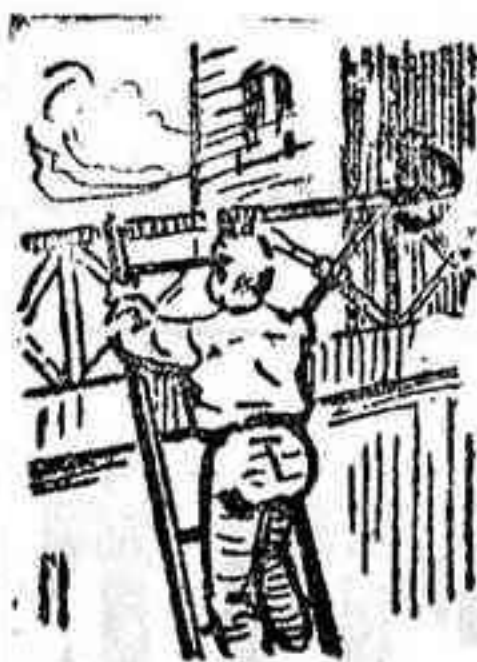
La solución, mañana