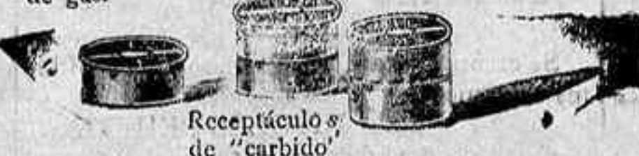
Receptáculo de "carbido"

En el presente grabado el tenedor de gas está representado en su condición baja al lugar donde el agua se derrama del tubo flexible en el embudo que comunica con el compartimiento que contiene el "Carbido" con el gas.