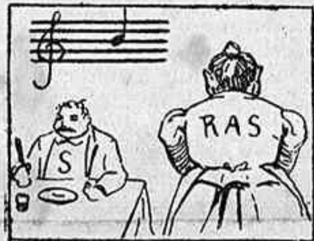
La solución, el lunes.