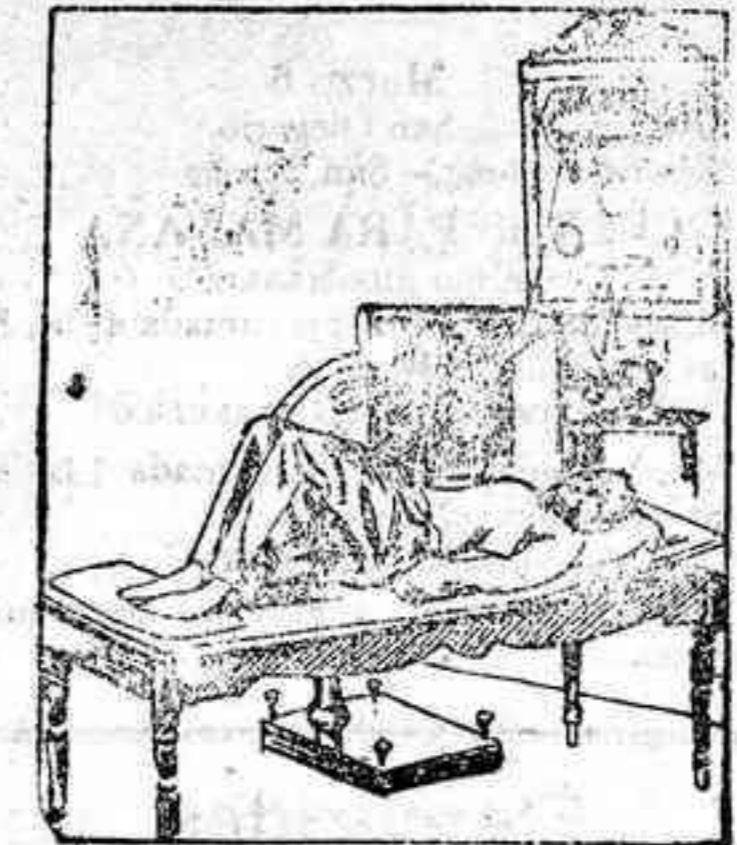
Fotografía del vacío con la blanda

Esta inspección fotográfica es sumamente interesante, porque permite apreciar el estado de la vejiga y sus partes inmediatas.