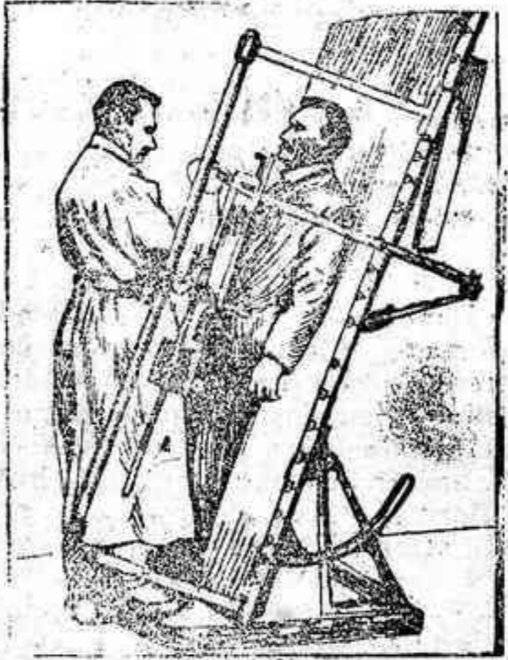
Observaciones ortoradiográficas del volumen del corazón.

Desde este momento los rayos Roentgen comenzaron á ejercer su misión en la Medicina.